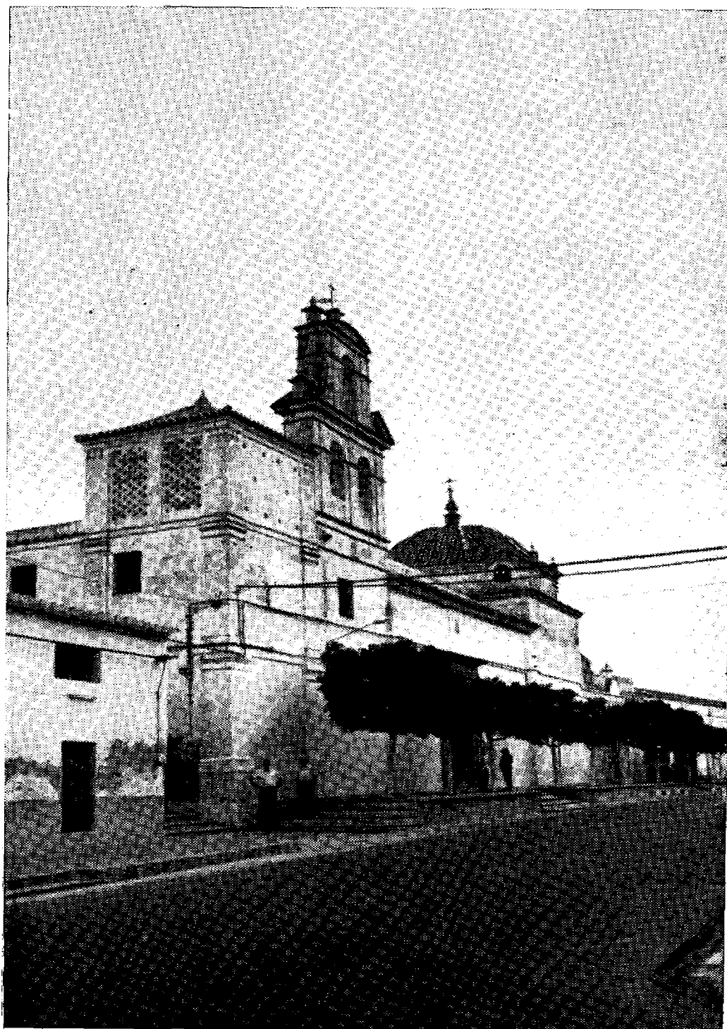
Lámina 1. Villalba del Alcor. Exterior del convento de San Juan Bautista.