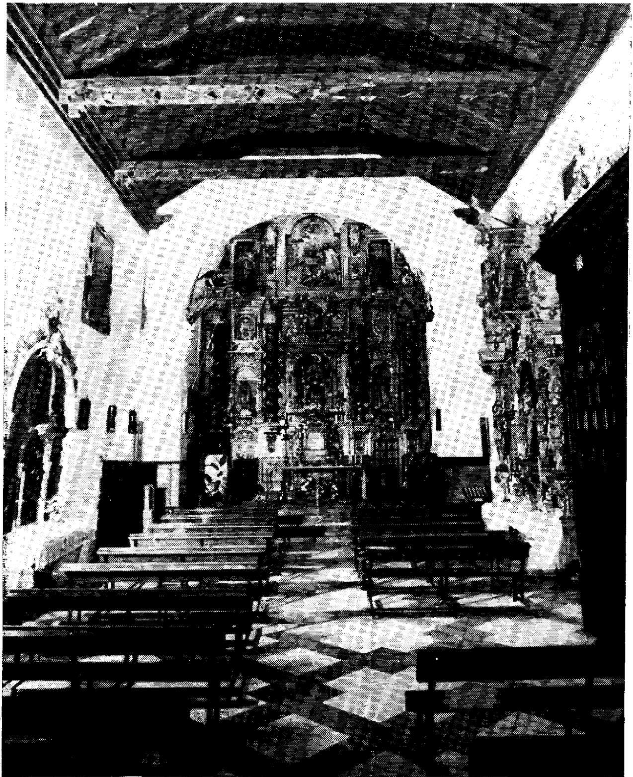
Lámina 4. Villalba del Alcor. Interior de la iglesia del convento de San Juan Bautista.