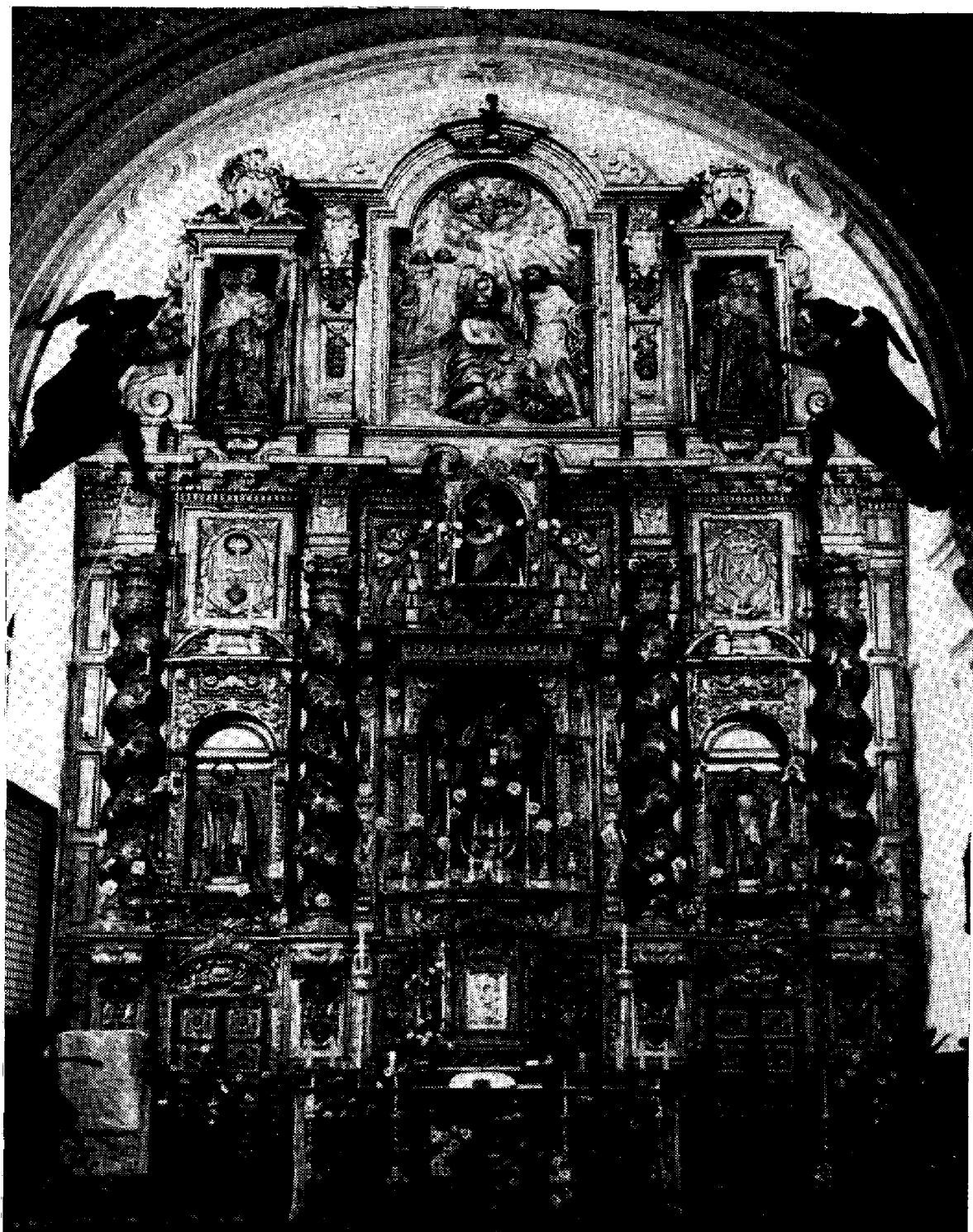
Lámina 5. Villalba del Alcor. Retablo mayor de la iglesia conventual de San Juan Bautista.