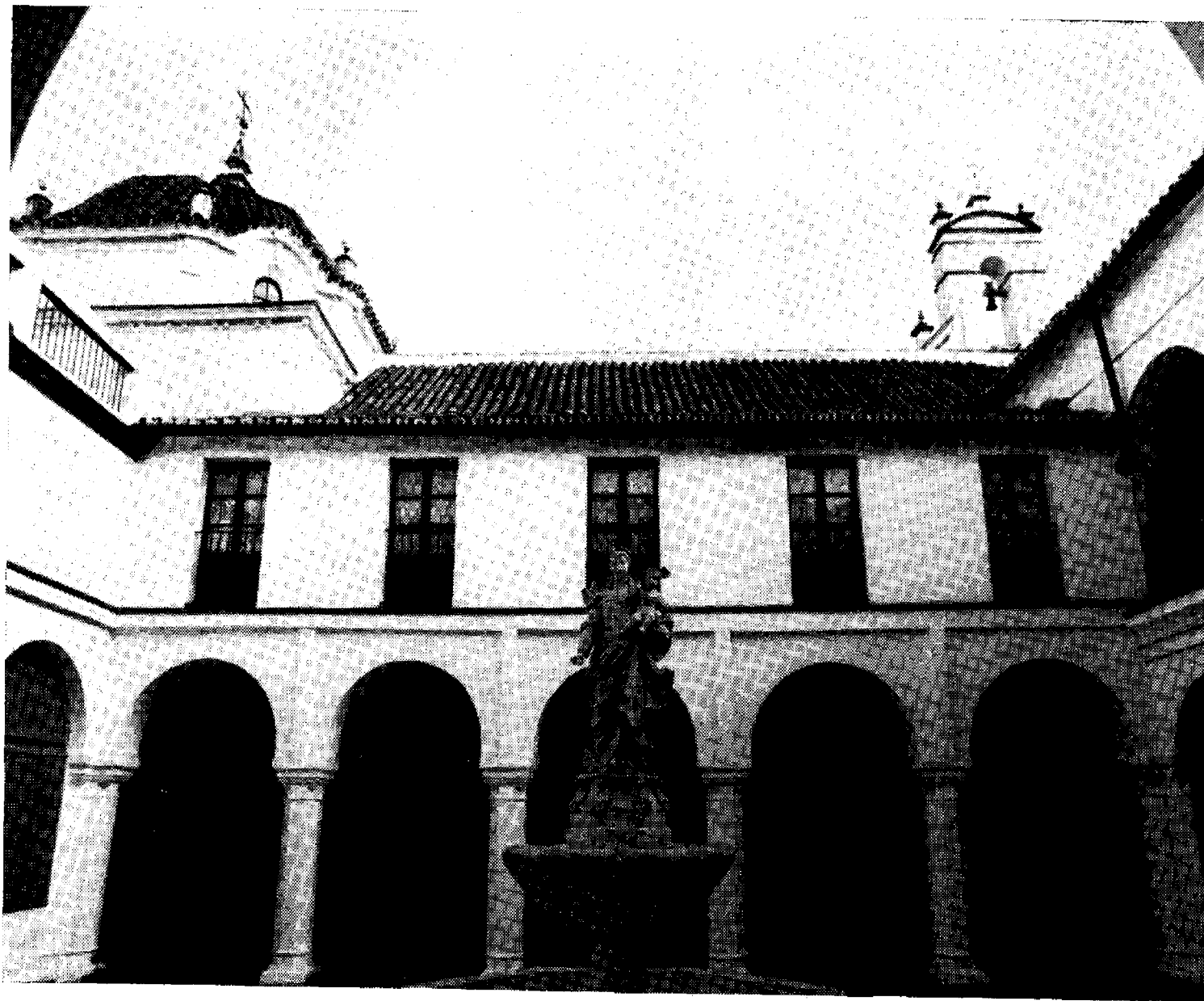
Lámina 3. Villalba del Alcor. Claustro principal del convento de San Juan Bautista.