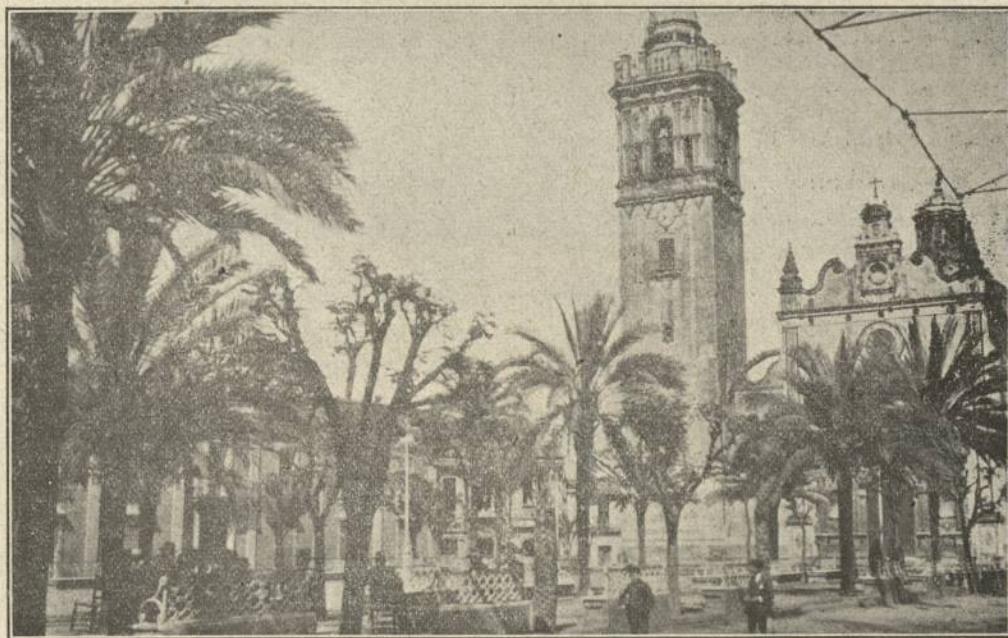
LA PALMA (Huelva).—Vista del Paseo de Alfonso XIII

El iberoamericanismo es una fuerza espiritual, un sentimiento ancestral que está por cima de todos los intereses y de todas las conveniencias; pueden dos pueblos no entenderse, tener aranceles que cierren sus fronteras, formas de gobierno distintas y sin embargo, el sentimiento de origen, el idioma, todos los valores éticos, pueden unirlos con mayor fuerza que el tratado de nación más favorecida, hecho generalmente en beneficio de