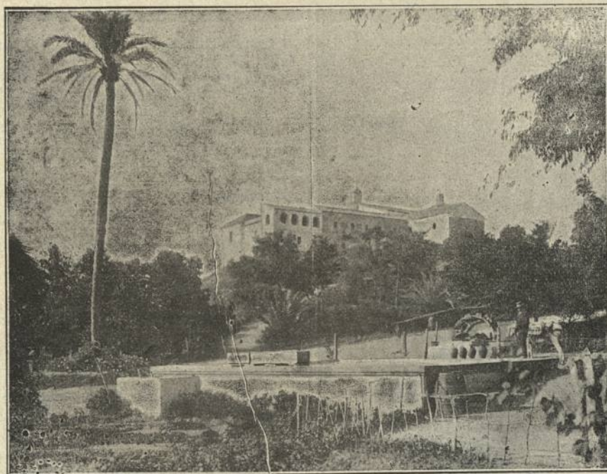
Vista general del Monasterio de La Rábida

Pídanse detalles á la SOCIEDAD COLOMBINA