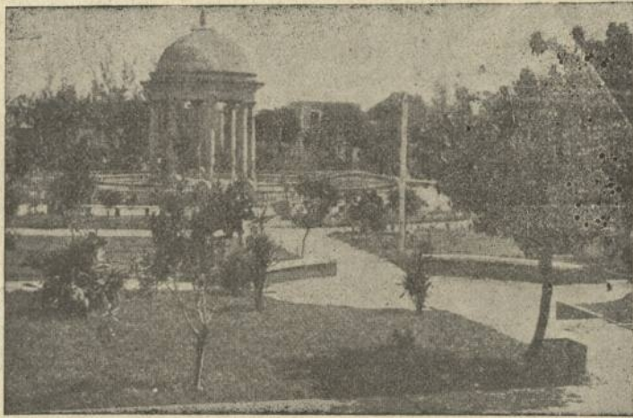
SANTO DOMINGO (R. D.)—Paseo de la Independencia.

Acercámonos a una de las bocas de cueva por donde acaba de salir un tren de mineral. Era una entrada en medio punto de suprema belleza, gracias al sulfato de cobre que la formaba un arco azul de transparencia infinita. El dintel, las jambas de esa puerta de troglodita, constituían una pura e intensa cristalización turquí, que producía una fascinación irresistible: la masa neutra de los yacimientos. Se pensaba en la vivienda del hada de las minas. Por ahí no se debía de pensar en el seno de la tierra, sino en el interior de un palacio mágico. Un obrero acudió con un candil para servirnos de guía y nos engolfamos en el subterráneo corredor. El techo, alto, revestido de tablones, con bóveda. La marcha, cómoda; a medida que nos internábamos, aumentaba la temperatura, ha-