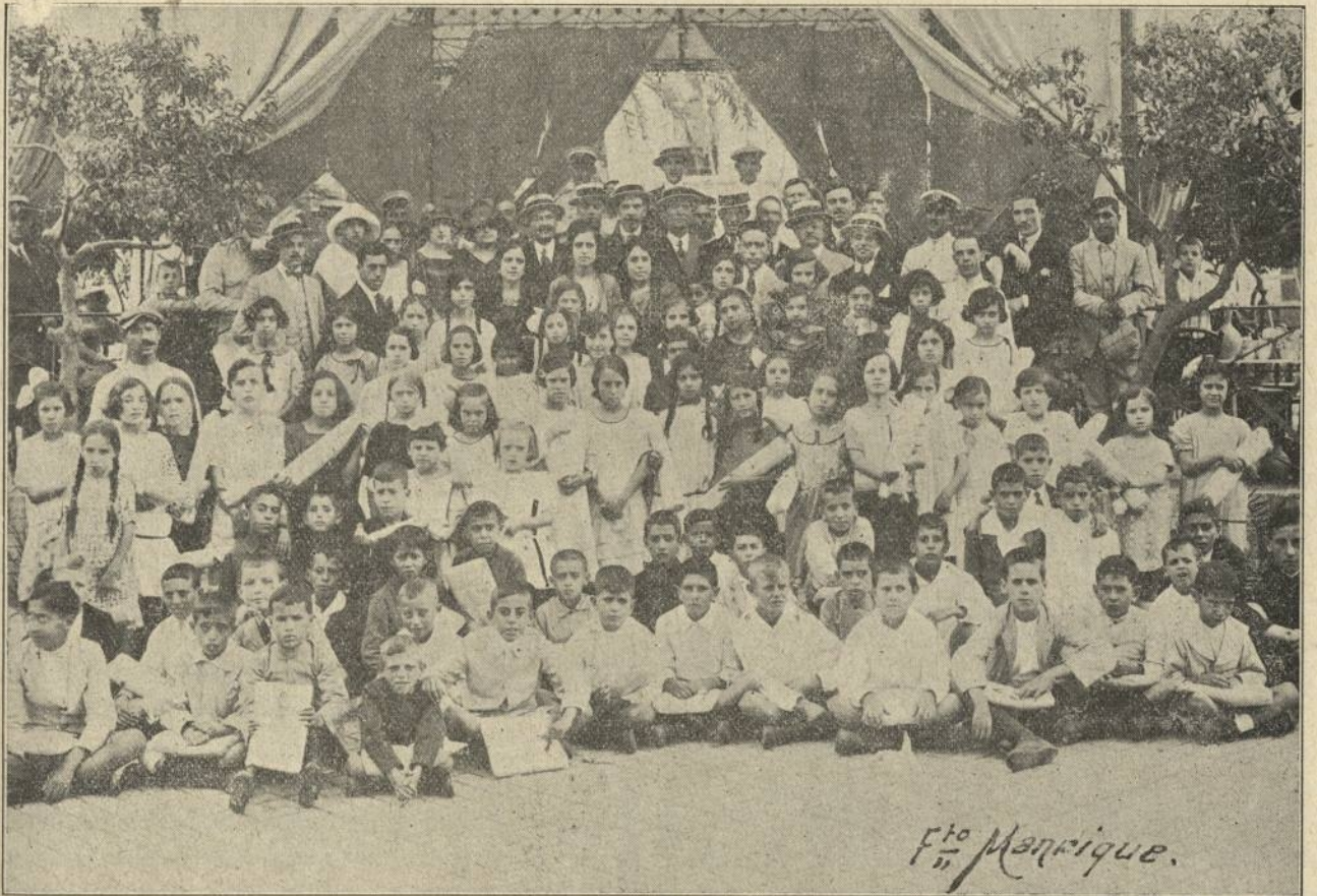
HUELVA.—Colonia Escolar de las playas de Punta Umbría.

¿Que se puede esperar de Estados que glorifican eso? El