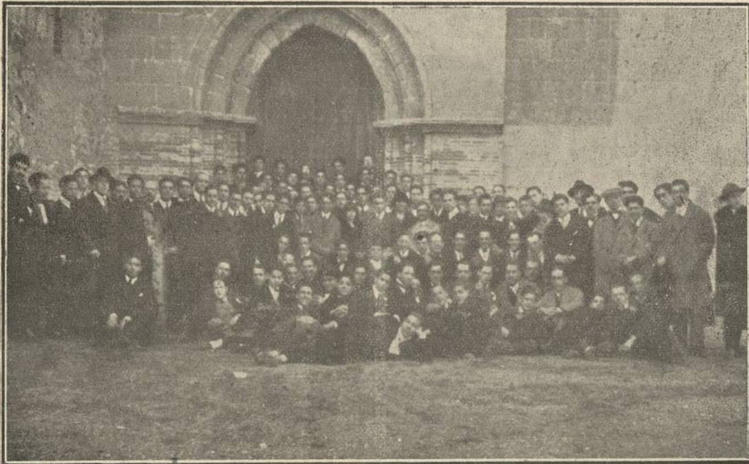
La «Tuna de Coimbra» y los estudiantes de Huelva en La Rábida.

Después, el señor Marchena Colombo ensalzó en un canto magnífico y vibrante la tierra hermana de Portugal e hizo un paralelo admirable de las glorias de Portugal y España y terminó diciendo: Si Portugal tiene el nido de águilas de Sagres, desde donde se lanzaron los navíos del Infante don Enrique por mares nunca d'antes navegados , España tiene este Santuario, claustro de mundos, yunque de diamante, del que surgió el fiat lux de la raza Iberoamericana. ¡Estudiantes de Coimbra! ¡Estudiantes de Huelva! ¡Grabad en vuestros espíritus con caracteres imborrables, las palabras de vuestro compañero Gomes D'Almeida! ¡Grabadlas y decidlas a vuestros hermanos de Portugal y España y daréis a nuestras patrias, mejor dicho, a nuestra patria Iberia, días gloriosos para la cultura universal, como los de Vasco de Gama, Colón y los