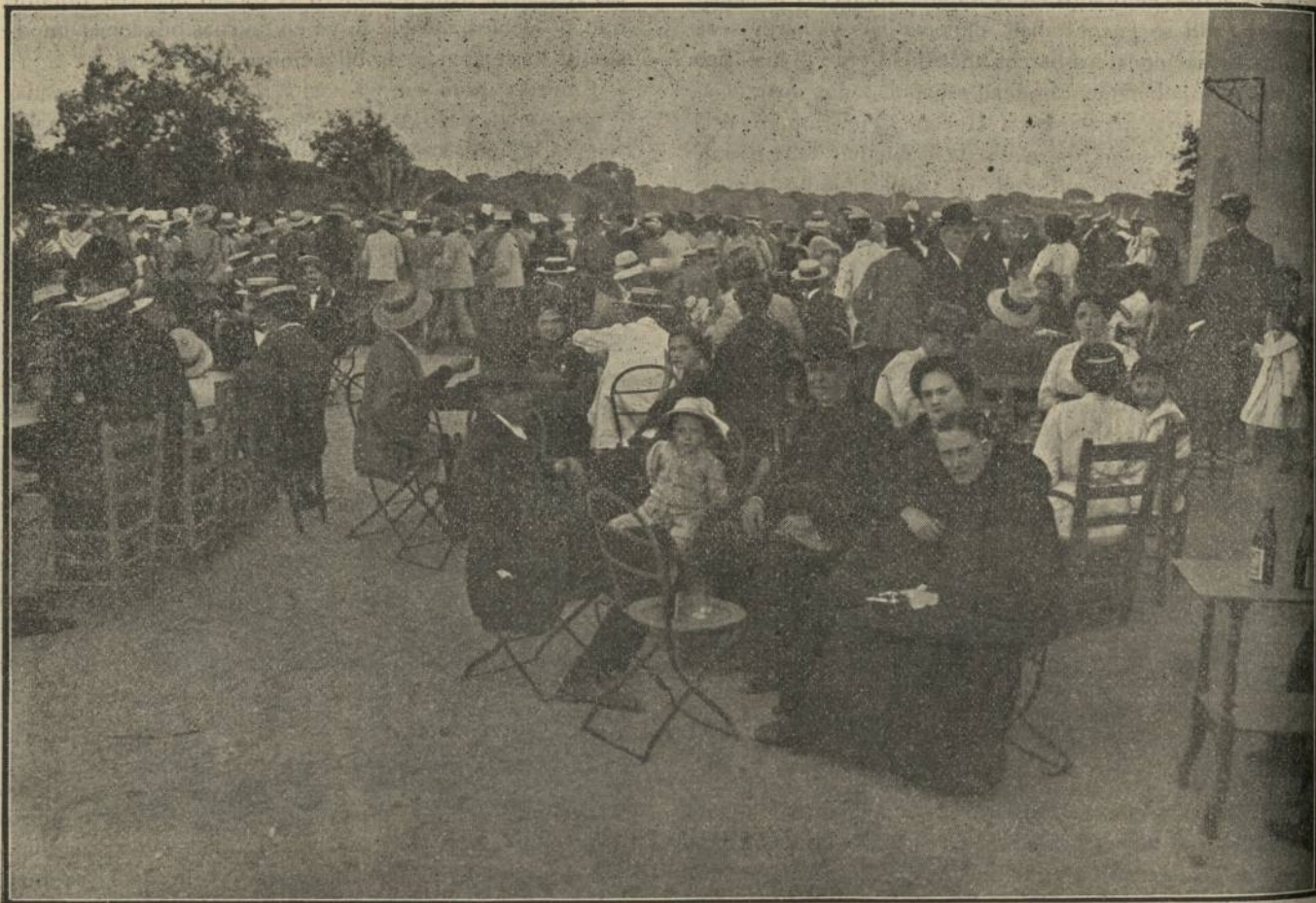
La Sociedad Colombina y los vecinos de los pueblos de la costa, en la Rábida, el 3 de Agosto

Antes de terminar el acto se leyeron los siguientes telegramas: