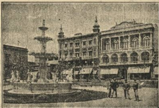
MONTEVIDEO. — Plaza de la Constitución: Club Uruguay

En los momentos espantosos actuales la voz de la vieja España se levanta de vez en cuando para demandar en justicia y para pedir por caridad, y en estos momentos, es precisamente, cuando nuestros Gobiernos deben mirar allende los mares en demanda de una cooperación moral de nuestros hermanos de raza a fin de marcar en la vida internacional la personalidad, que a la difundida y pro-