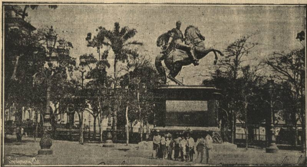
VENEZUELA.—Plaza de Bolívar en Caracas, capital de la República

Celebraríamos que este folleto de 45 páginas llegara a los más apartados rincones de España, como se propone su autor al rogar su reparto entre los amigos del lector, ofreciendo el envío gra-