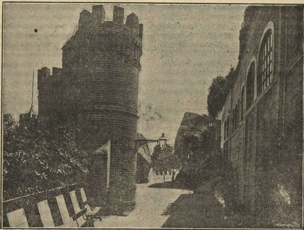
SANTIAGO DE CHILE.—Torre redonda del Cerro de Santa Lucía