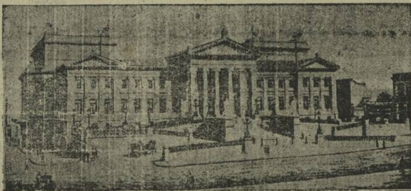
PERÚ.—Escuela de Medicina de Lima

En 1912 los productores acordaron contribuir con 3/8 de penique por quintal, en vista de la necesidad urgente de fondos para establecer Delegaciones en mercados nuevos y la competencia creciente ocasionada por la fabricación de productos nitrogenados sintéticos y del amoníaco, el aumento resultante de fondos de propaganda fué sumamente oportuno. Esto se entenderá mejor teniendo en cuenta que al estallar la guerra las Delegaciones existían en número de diecisiete, haciendo trabajos