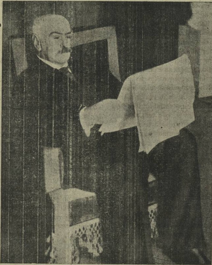
Don Juan Luis Sanfuentes Ilustre Presidente de la República de Chile.

atribuir la fuerza del régimen monárquico en España a la masa popular cuya ignorancia, según los conceptos subrayados más arriba, la hace fanática del derecho divino que fué principio religioso de la monarquía. Ni aun las clases sociales inferiores creen allí hace muchos años en tal principio. Y si es muy cierto que en el país existen numerosos elementos de eminente valor intelectual que profesan ideas contrarias a la monarquía, no lo es menos que no podrían contarse fácilmente los grandes espíritus que allí apoyan ese régimen, que lo es asimismo de orden, de paz y de progreso, porque ha de ser ciego del entendimiento quien negare los grandes progresos de