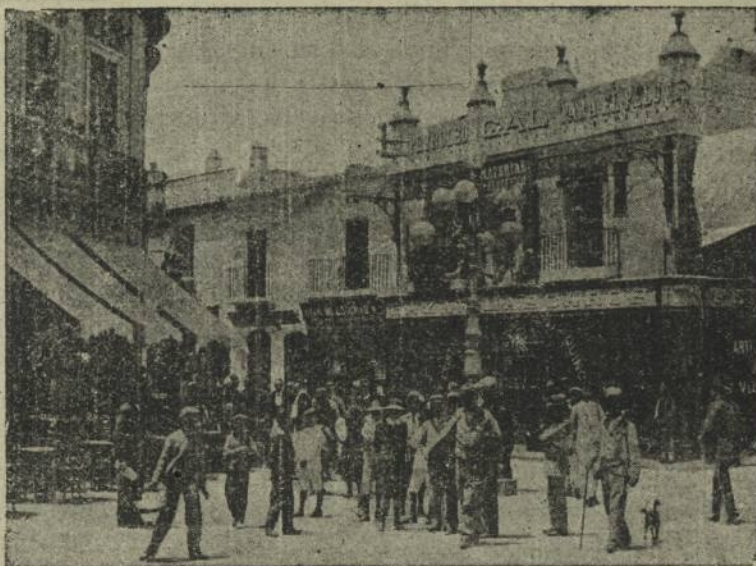
HUELVA.—Calle Concepción, lugar el más céntrico y animado de la bella capital andaluza.

El lago Poopó a 3,700 metros sobre el nivel del mar y 112 metros bajo del nivel del Titicaca del que recibe sus aguas, tiene 88 kilómetros de largo por 36 de ancho y una superficie de 2,530