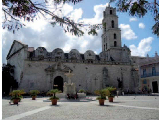
1. Plaza de San Francisco de Asís. La Habana es la ciudad que históricamente ha ofrecido el mayor atractivo patrimonial de Cuba.

A pesar de las dificultades derivadas del injusto bloqueo comercial, económico y financiero ejercido por USA desde el año 1960, de las condiciones sufridas durante el llamado periodo especial en la década de los noventa, y de sus propios errores y carencias, Cuba ha considerado el reconocimiento y la protección de su patrimonio como parte esencial de su acción cultural. Así lo ha reconocido en múltiples ocasiones Herman Van Hoof, responsable de la UNESCO para América Latina y el Caribe, señalando el enorme esfuerzo que realiza Cuba para conservar tanto sus sitios incluidos en la lista del Patrimonio Mundial como el resto de su patrimonio cultural, y destacando la voluntad política de crear instituciones con ese objetivo, dar continuidad a las mismas, y persistencia por seguir avanzando pese a las dificultades. En ese sentido, hay que resaltar el desarrollo de la planificación para la conservación y gestión patrimonial a través de Planes Maestros y Directores que responden a los requerimientos de la Convención del Patrimonio Mundial y que aprovechan el gran compromiso, interés y conciencia de la población hacia su historia, identidad y patrimonio 2 .