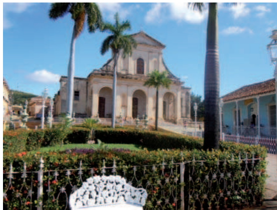
3. Trinidad, en la provincia de Sancti Spiritus, es una de las ciudades coloniales mejor conservada de América. Plaza e Iglesia de la Santísima Trinidad.

A partir de ese mandato fundamental se han ido desarrollando normativas específicas. Las más importantes son la Ley nº 1 de Protección al Patrimonio Cultural, y la Ley 2 de los Monumentos Nacionales y Locales (ambas de 4 de agosto 1977).