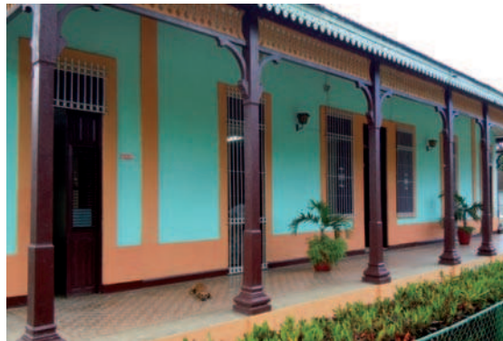
20. Antiguas oficinas del Central, hoy zona de recepción, exposición y museo. Central Azucarero Patria en Morón.

Se trata pues de un ambicioso proyecto que pretende recuperar y proteger el legado cultural agrario procedente de la actividad cañera, para ponerlo al servicio de la comunidad en sus distintos aspectos: recuperación de la identidad, rehabilitación de bienes culturales, formación y difusión, utilidad turística, generación de nuevos empleos y mejora de infraestructuras.