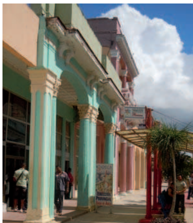
13. El tipo de arquitectura avileña se caracteriza por los soportales y el estilo ecléctico. Bulevar de Ciego de Ávila.

Todas estas dificultades, unidas al boicot informativo que oculta o manipula al resto del mundo las realidades de Cuba, provocan un importante desconocimiento sobre los valores del patrimonio cubano y sobre la labor de conservación, rehabilitación, formación, investigación y activación que se lleva a cabo en la isla.