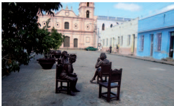
2. Camagüey ha sido la última ciudad cubana en ser incluida en la lista del Patrimonio Mundial de la UNESCO. Plaza del Carmen.

La experiencia acumulada y los conocimientos adquiridos en la Habana desde hace más de un cuarto de siglo han permitido una proyección del trabajo con el patrimonio cultural y los entornos patrimoniales no sólo en La Habana y Cuba sino fuera de sus fronteras, otorgando una gran importancia tanto a la intervención como a la formación integral. Ello tuvo como consecuencia la puesta en funcionamiento en el año 2006 del Colegio Universitario San Gerónimo como facultad de la Universidad de La Habana, donde se imparte exclusivamente la carrera Preservación y Gestión del Patrimonio Histórico-Cultural, dirigida a formar profesionales capaces de asumir y responder a las demandas contemporáneas del trabajo con el patrimonio, conscientes de que constituye además un legítimo instrumento para el sostén de la identidad universal, nacional y local. Además, tiene un doctorado interamericano y se desarrollan cursos de postgrado, muchos de ellos realizados en colaboración con universidades españolas. Pero Cuba no es sólo La Habana.