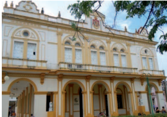
14. El recuerdo de la presencia española es permanente en todos los rincones de la isla. Edificio de la antigua Colonia Española en Morón, la ciudad del Gallo.

canaria y tabaquera), las fiestas del 10 de octubre en el municipio de Venezuela, las relacionadas con religiones afrocubanas, o la celebración del fin de la zafra en los bateyes de los centrales azucareros.