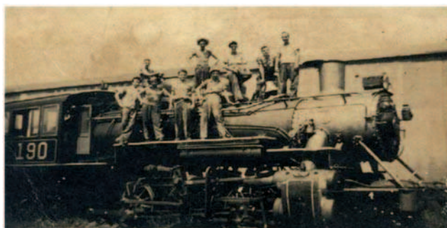
16. El primer sistema ferroviario azucarero privado se implantó en las centrales Jagueyal y Steward, en la actual provincia de Ciego de Ávila, convirtiéndose en símbolos de la cultura azucarera. Locomotora a vapor, años 40 del siglo XX.