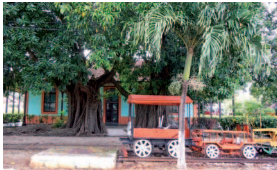
17. El Central azucarero Patria en Morón está siendo rehabilitado y restaurado con el objetivo de recuperar la cultura azucarera y reivindicar identidades culturales útiles a la educación, la generación de empleo, el desarrollo territorial y el turismo.

Tras la mencionada crisis de los años 90 del siglo XX, parte de la producción azucarera se vino abajo. Buena parte de los campos de cultivo y de los Centrales Azucareros abandonaron su actividad total o parcialmente y entraron en un proceso de deterioro importante. Una vez paralizado el antiguo Central Patria, en el año 2000 surge la necesidad de buscar otras alternativas de desarrollo y teniendo en cuenta la proximidad de la zona turística de Jardines del Rey (más conocida en Europa por los cayos Coco y Guillermo), las condiciones naturales de la región y los recursos culturales existentes, se decidió promover algunas iniciativas basadas en el patrimonio cultural agrario. Este complejo agroindustrial azucarero se convirtió en 2001 en Empresa de Producción Diversificada, favoreciendo la reconversión de la intensiva producción cañera y su compatibilización con otros usos.