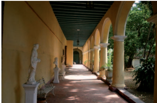
11. El CENCREM es la institución dedicada a la enseñanza, investigación e intervención en conservación, restauración y museología. Su sede es el antiguo convento de Santa Clara.

o patrimonio cultural y turístico. Es quizás esta carrera la que, fuera de la impartida en San Gerónimo y los posgrados especializados, más directamente toca la formación integral en aspectos relativos al patrimonio. Lo tocante a la formación en turismo se desarrolla en la Licenciatura de Turismo, que imparten seis universidades, y que incluyen materias de análisis del patrimonio (cultural y natural), de desarrollo social y económico y de relaciones con el territorio.