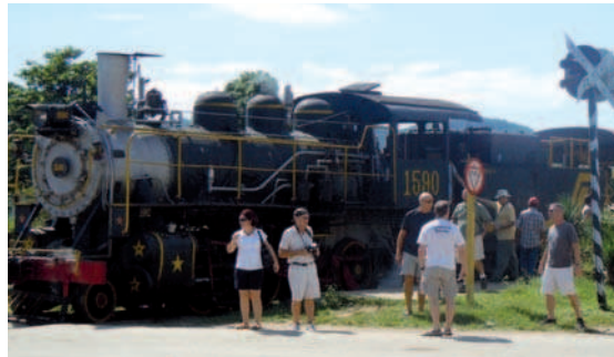
18. Uno de los usos dados a los antiguos trenes azucareros es el transporte de visitantes desde los destinos turísticos más consolidados a las ciudades patrimoniales, recorridos por paisajes singulares y a los centrales reconvertidos en museos abiertos.

sino de piezas reales y originales vivas gracias al milagro de su mantenimiento.