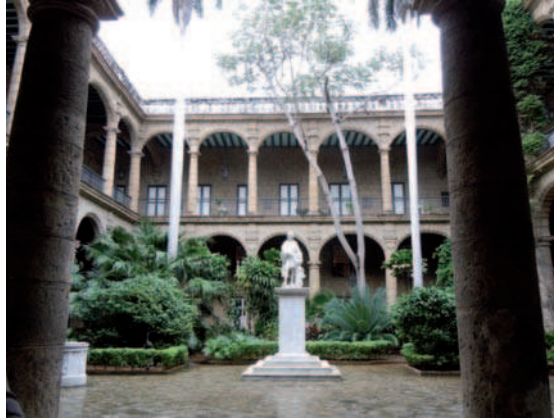
7. La Oficina del Historiador de la Habana es el núcleo central de la actividad patrimonial en la capital. Palacio de Segundo Cabo: Oficina del Historiador y Museo de los Capitanes Generales.