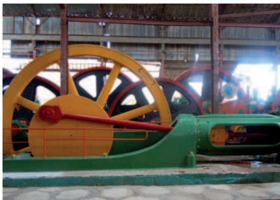
19. La antigua maquinaria de la factoría se pone en funcionamiento para mostrar el proceso de transformación industrial de la caña.

La casona, de fuerte influencia estilística del sur de los USA, igualmente restaurada, exhibe fotos, documentos, artículos de interés y una breve historia de todos los centrales de la provincia avileña, así como una muestra de los principales productos derivados de la caña que comercializa la empresa cubana Tecnoazúcar del Ministerio del Azúcar (MINAZ), a la cual pertenece la entidad moronense.