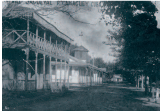
15. La explotaciones azucareras (ingenios) están muy relacionadas con el colonialismo español y la influencia norteamericana. Calle del batey (poblado) del Central Jagueyal, primera década del siglo XX.

Por último, a estos valores patrimoniales hay que añadir, para comprender nuestro interés por Ciego de Ávila, el protocolo de hermandad y cooperación establecido entre la ciudad de Baeza (incluida con Úbeda en la lista del Patrimonio Mundial de la UNESCO) y ciudad en que radica la sede Antonio Machado de la Universidad Internacional de Andalucía) y la ciudad avilena de Morón.