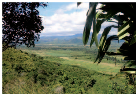
21. Paisaje agrario y natural del sur de la provincia de Ciego de Ávila.

En definitiva hay un gran campo abierto, un potencial inmenso en cuanto a bienes culturales de muy diverso tipo que son susceptibles de activación con el objetivo de contribuir al desarrollo territorial, que están siendo centro de interés de organismos gubernamentales, instituciones científicas, educativas y entes de intervención, entre los que está muy consolidado un concepto integral del patrimonio al servicio de la población que, a pesar de las grandes dificultades, está siendo aplicado con la perseverancia, el entusiasmo y el espíritu crítico y de superación del que hacen gala la mayoría de los cubanos. Desde España podemos aportar experiencias y conocimientos que enriquezcan el caudal del que disponen en la isla, pero Cuba puede reportar a España un enorme abanico de conceptos, actitudes y ejemplos de los que deberíamos estar dispuestos a aprender.