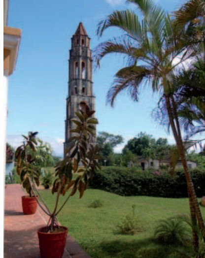
4. Torre del ingenio de Manaca-Iznaga. El valle de los Ingenios aún a un espectacular patrimonio paisajístico con la tradición agraria de la caña de azúcar.