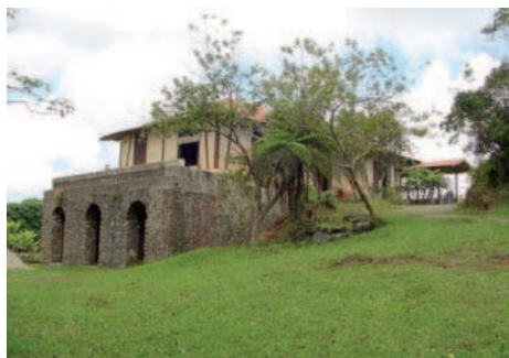
6. El Parque Arqueológico de las primeras plantaciones del café reconoce los valores patrimoniales de la actividad agrícola con su conjunto de manifestaciones materiales e inmateriales.

En definitiva, el CENCREM, el Consejo Nacional de Patrimonio Cultural, los Centros Provinciales de Patrimonio, los Equipos Técnicos de Monumentos y otras instituciones culturales, congregan a especialistas de notable experiencia en este campo y han orientado e intervenido en la conservación y restauración de ciudades y decenas de monumentos relevantes y sitios del país, trazando programas de rescate para centros, conjuntos históricos, paisajes culturales y sitios naturales, restaurando importantes obras del patrimonio mueble, conducido investigaciones de diversas índole sobre estos objetivos y conformado un sistema primario de cursos y adiestramientos.