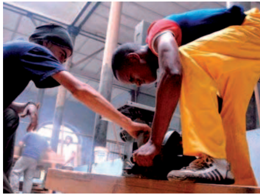
12. La Escuela Taller Gaspar Melchor de Jovellanos nace de la experiencia y colaboración españolas.

acentuado proceso de decadencia, fue incorporado en 1992 por la cooperación española e insertado en el proceso de recuperación de La Habana Vieja a través de La Escuela-Taller Gaspar Melchor de Jovellanos, de la Oficina del Historiador. En ella se forma a técnicos medios y obreros cualificados en especialidades que corrían el riesgo de perderse (yeseros, carpinteros ebanistas, herreros, etc.), en muchos casos procedentes de sectores de la población con menos oportunidades para el desarrollo y que, tras el proceso de formación y trabajo, tienen un puesto garantizado en la Oficina del Historiador.