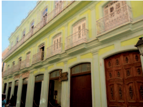
8. La diversidad y el mestizaje son señas de identidad del patrimonio cultural cubano. Casa de África en la Habana Vieja.

La complejidad del urbanismo, la realidad social y el impacto de nuevos procesos como el turismo, hacen muy difícil la intervención en una ciudad como La Habana. A pesar de lo cual no sólo se han restaurado edificios para convertirlos en museos, centros turísticos, tiendas y restaurantes o espacios para el arte y la cultura; también se han creado hogares de ancianos, hospitales, centros de rehabilitación para discapacitados, viviendas familiares o lugares de estudio, con el objetivo de revitalizar un conjunto histórico notablemente deteriorado por el abandono de más de un siglo, marginalizado y con graves problemas sociales.