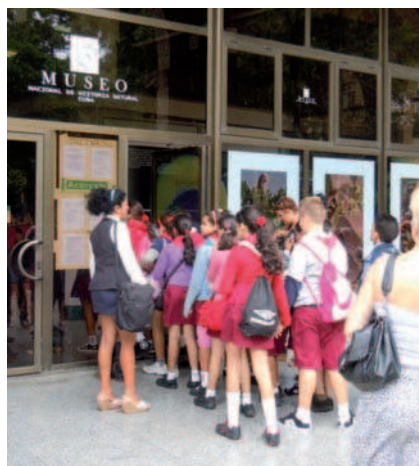
9. El conocimiento de la historia y la cultura cubanas es prioritario en el sistema educativo. Visita de estudiantes de primaria al Museo Nacional de Historia Natural.

La figura del Historiador de la Ciudad no está contemplada en la estructura orgánica general de Patrimonio, como tampoco lo están las del Restaurador o Conservador de Ciudad. Estas figuras obedecen a iniciativas de las Asambleas Municipales del Poder Popular (Ayuntamientos) que los nombran y aprueban. Así es como nació y se ha desarrollado la Oficina del Historiador de la Ciudad de La Habana: una iniciativa municipal que ha creado un modelo autónomo en función de sus necesidades y experiencias.