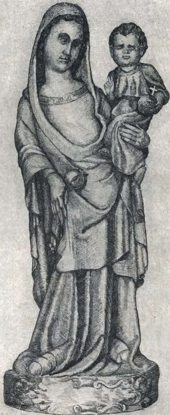
SANTA MARIA DE LA RABIDA