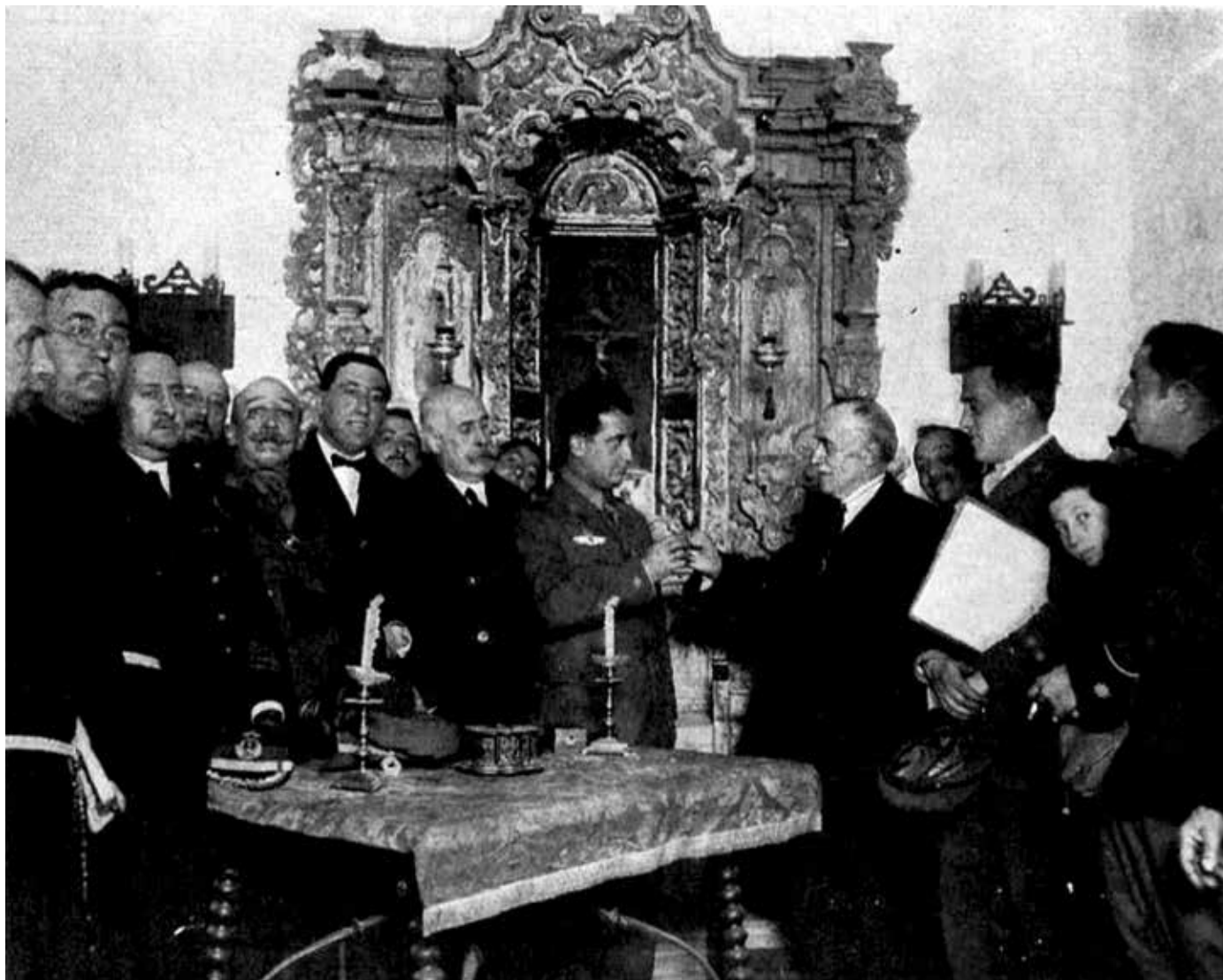
Imagen 3. El comandante Franco, en el interior del monasterio de La Rábida, recibiendo de manos del presidente de la Sociedad Colombina la copa de oro destinada al presidente argentino. Caras y Caretas , 20 de febrero de 1926, n.º 1429, p. 80.