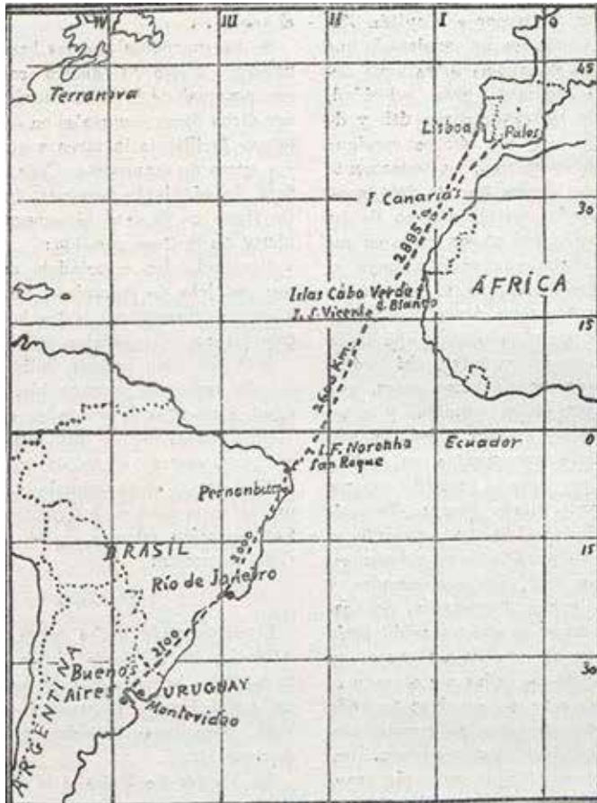
Imagen 1. Itinerario del proyecto del capitán Zuloaga en 1920. Revista España Automóvil y Aeronáutica . Fuente: Biblioteca Nacional de España: http://hemerotecadigital.bne.es/

La respuesta del Gobierno argentino no fue positiva, como queda patente en un amplio reportaje que sobre este asunto presentó la revista España Automóvil y Aero-náutica de noviembre de ese mismo año: