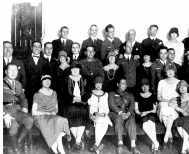
Imagen 6. Élite onubense que asistió al té con que el casino local obsequió a los aviadores antes de partir. Caras y Caretas , 20 de febrero de 1926, n.º 1429, p. 81.

Los aviadores Franco, Ruiz de Alda y Durán, como mensajeros de la «Madre Patria», llevaban consigo algunos encargos realizados por diferentes instituciones onubenses para determinadas entidades porteñas. Por un lado, la Sociedad Colombina Onubense había hecho entrega de la ya mencionada copa de oro como regalo al presidente de la República Argentina. Por otro lado, el Ayuntamiento de Huelva mandó elaborar un pergamino de salutación al artista Celso Morales Martínez, para ser ofrecido al Concejo Municipal de la ciudad de Buenos Aires. En el mismo se