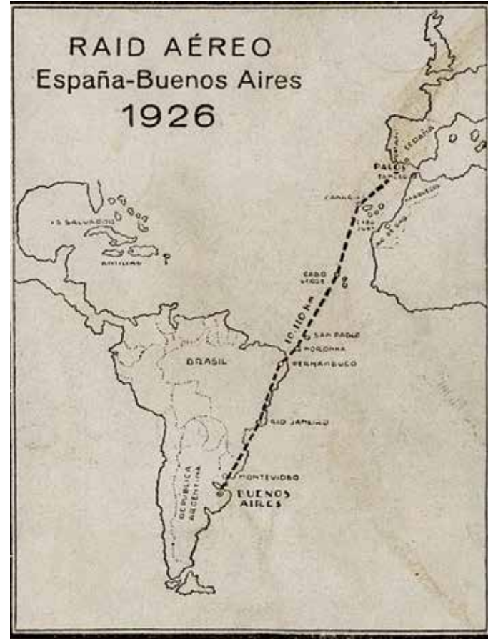
Imagen 2. Ruta del raid España-Argentina realizado en 1926. Anónimo (1926). Barcelona: Bellsoley.