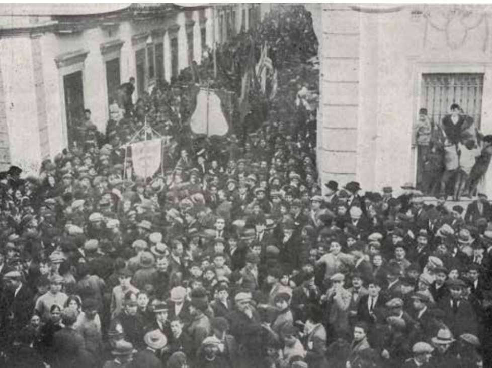
Imagen 7. Huelva. El pueblo en espontánea manifestación al saber que el Plus Ultra había llegado a Buenos Aires. Revista La Rábida , n.º 139, 28 de febrero de 1926, p. 11.

Onubense y el Círculo Mercantil— siguiendo algunas de las propuestas ciudadanas anteriormente mencionadas. Además, se incluían otras actividades como costear un almuerzo para los pobres de la ciudad, para que de ese modo pudieran «participar del regocijo del pueblo». 76