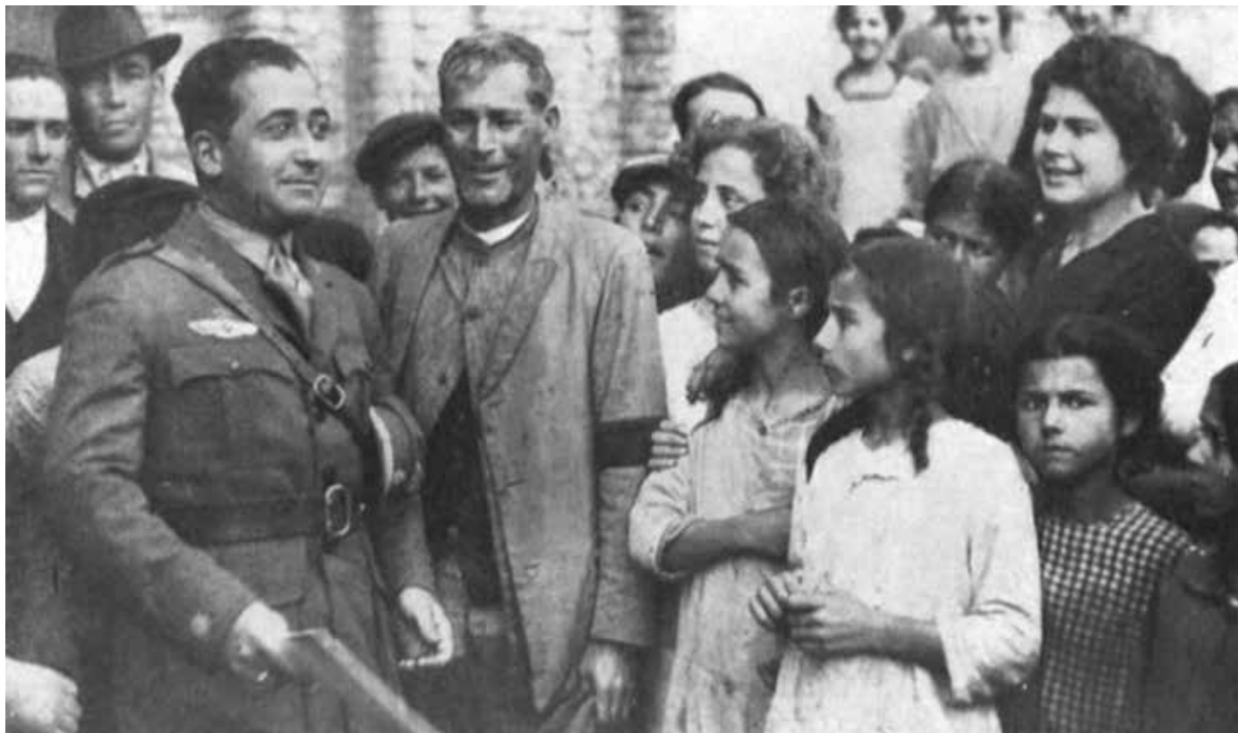
Imagen 5. Franco junto a la gente del pueblo de Palos. Caras y Caretas , 20 de febrero de 1926, n.º 1429, p. 82.

Los mismos que ayer, los españoles [que] dominaron la fiereza del hasta entonces Insondable Océano, descubriendo tierras desconocidas, hoy, los españoles descendientes de los heroicos argonautas, de la gran epopeya, sondan el espacio y surcándolo, van a América para decirle que la madre España, no olvida a aquellas tierras queridas a las cuales llevó la civilización e infiltró su gesto, haciendo de ellas, una prolongación de la Patria misma, ya que en América, todo es español y lo será siempre, mientras sus hijos hablen el recio idioma que hablara don Quijote. 53