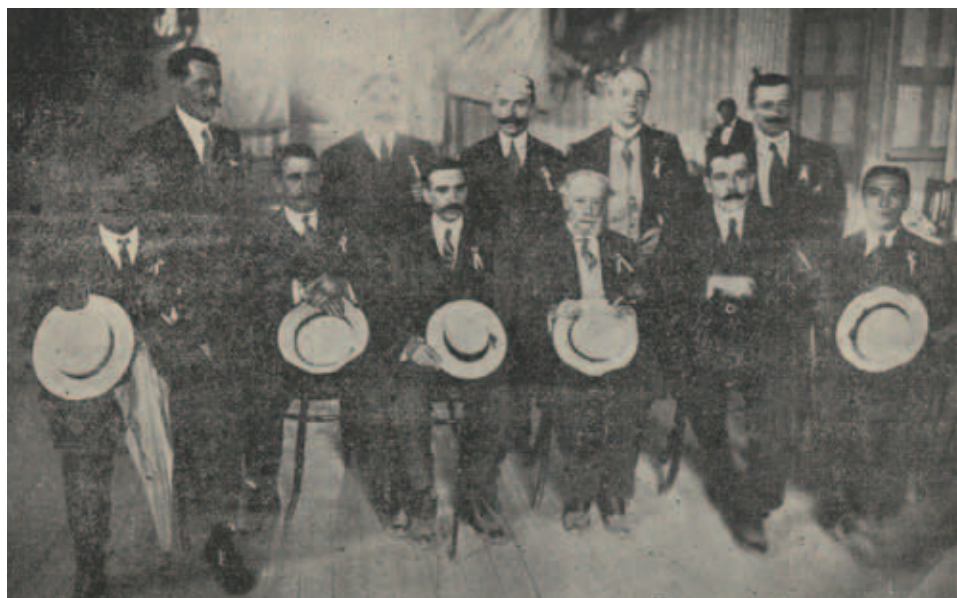
"Comité de las Fiestas Gallegas en Santiago de Chile".