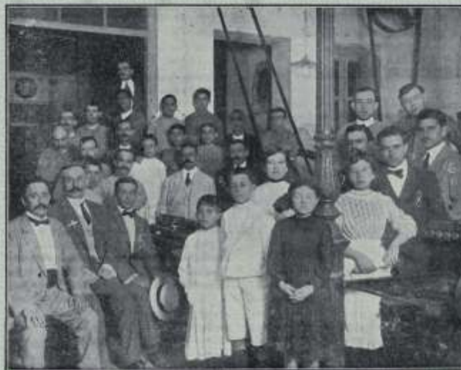
Los que hacen LA RÁBIDA