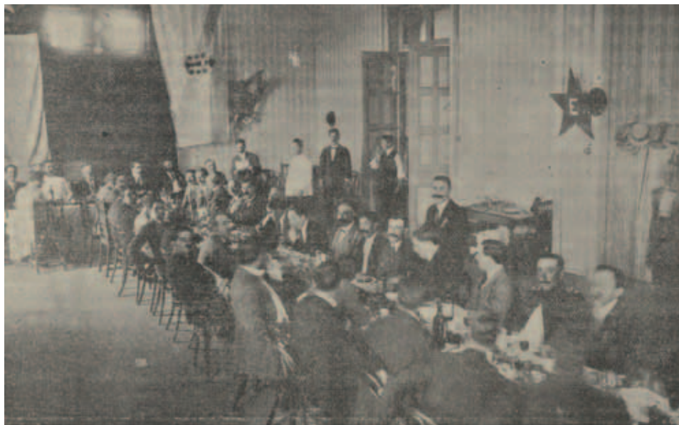
"Mesa del banquete de las Fiestas Gallegas. Santiago de Chile".

Huelva y América. Cien años de Americanismo. Revista "La Rábida". De corresponsales y colaboradores