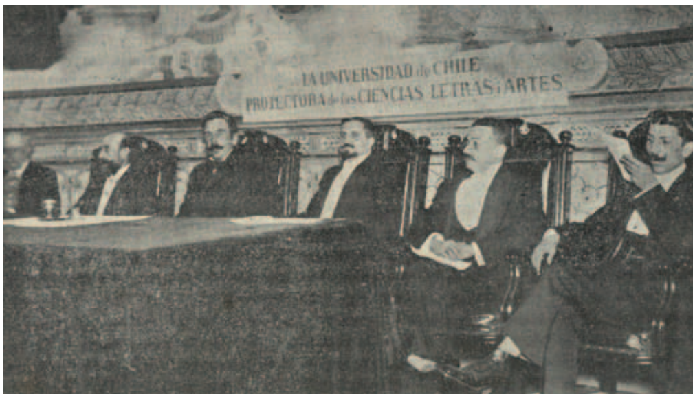
“La presidencia de la velada en honor de Vasco Núñez de Balboa en Santiago de Chile” (1913).

Por último, la prensa nacional ofreció sus columnas para cuantas noticias fueran necesarias. Y, con tan valiosos elementos, se confeccionó el siguiente programa: El Centenario del Pacífico y el Canal de Panamá; conferencia histórica por el literato español Javier Fernández