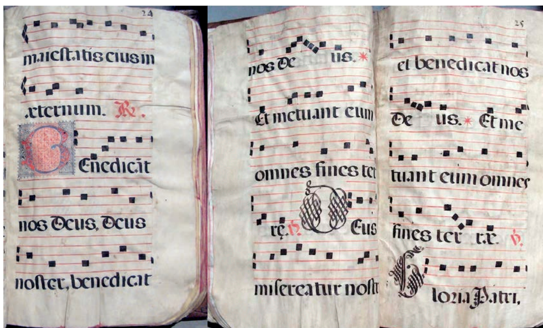
Figura 29.2: Tercer responsorio de los maitines para la Santísima Trinidad. Catedral Metropolitana de México, Libro de coro O21, fols. 24r-25r. R: cuerpo del responsorio; *: pressa ; V: verso (Foto: Silvia Salgado). Reproducido con autorización del Cabildo Catedral Metropolitano de México.

Donde el responsorio constituye un ítem aparte, sea breve o prolijo, es en los libros que contienen la música para los textos litúrgicos. Esa tradición que arranca desde la Edad Media se ve reflejada en los pocos libros de la Librería de cantorales de la Catedral de México que contienen responsorios en canto monódico. En la Figura 29.2 se observa el tercer responsorio de los maitines para la Santísima Trinidad, en el libro de coro O21 de la Catedral de México 24 , que es el mismo responsorio que se muestra en la Figura 29.1 tomada del breviario.