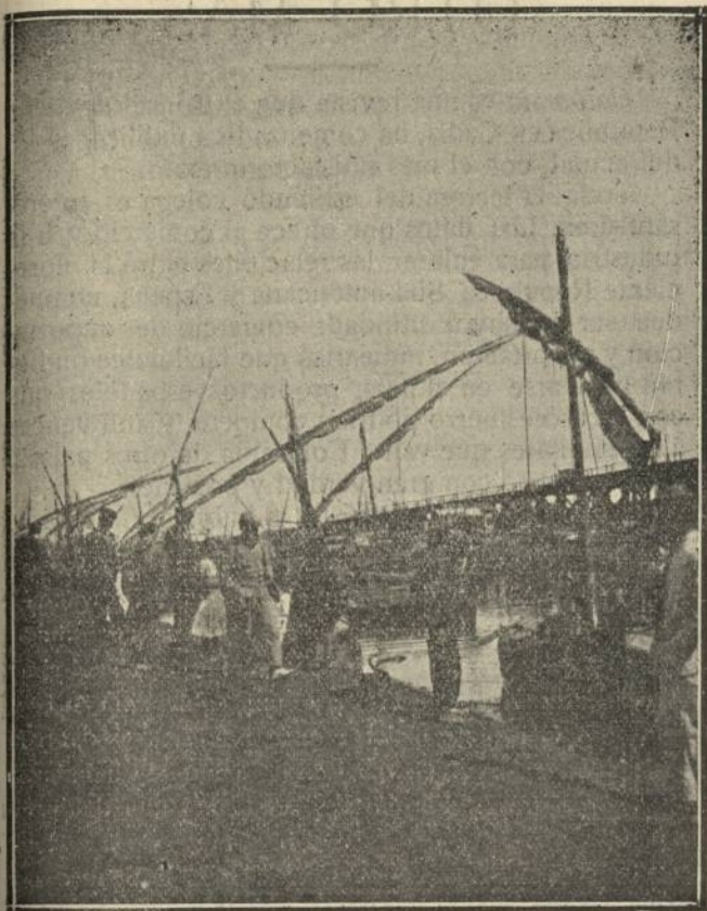
El Dique, Huelva. - Descargando Pescado.

ción de éstos, obedeciendo á un plan estudiado por los técnicos municipales, convertiría en un lugar ameno y bellissimo lo que hoy es en su mayor parte un eriazó, y nuestro Ayuntamiento, con lo que había de gastarse en una fiesta educativa y de cultura, iría, poco á poco, y sin grandes dispendios, dotando á la ciudad de un verdadero Parque con sus bosques, jardines y calles de árboles de que tan necesitado se encuentra Huelva dada su riqueza y crecimiento.