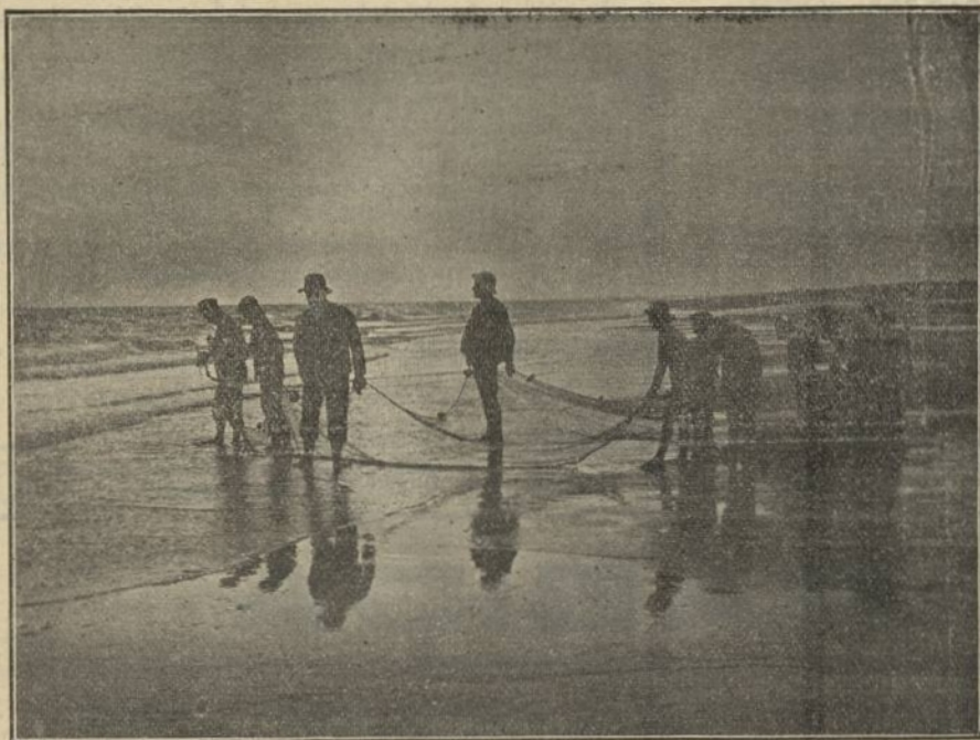
Echando el copo en la playa de Huelva

Con este anuncio echamos el copo á todas las playas y campos, pues tenemos Maquinaria, Hornos y demás accesorios para la fabricación de los modernos Materiales de Construcción que se hacen con Barros ó Arcillas y los tenemos también para fabricar los Blocks huecos, Ladrillos y demás que se hacen con Arenas, Gravillas, Cales y Cementos.