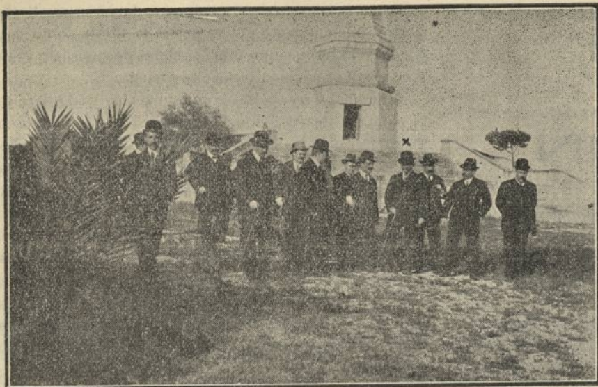
Visita del Conde de Romanones X hoy Presidente del Consejo de Ministros, al Convento de la Rábida.

que separaban los dos extremos del mundo: la idea de redondez del mundo iba tomando arraigo hasta en la gente agena á las ciencias cosmográficas.