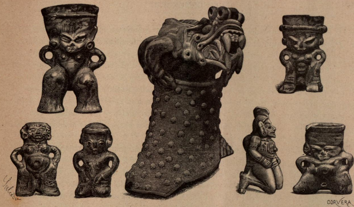
Objetos de cerámica presentados por la Comisión de Nicaragua en la Exposición Histórico-Americana.