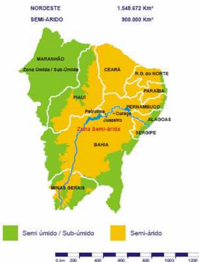
Figura 1 – Mapa de la región de semi-árido en Nordeste de Brasil.

En áreas específicas como la costa arenosa del norte del nordeste (en CE y RN), las matas del galería en las áreas bajas de las cuencas de los ríos Açú (en RN), Jaguaribe (en CE) y São Francisco (en los estados de MG, BA y PE), la Chapada do Apodi (una sierra del RN), las sierras cristalinas (en PI, CE, RN y PB) y el Cariri 14 (en PB), la principal estación lluviosa no acontece en el mismo período, más de diciembre al febrero en sur y sudeste del sertão y de marzo hasta