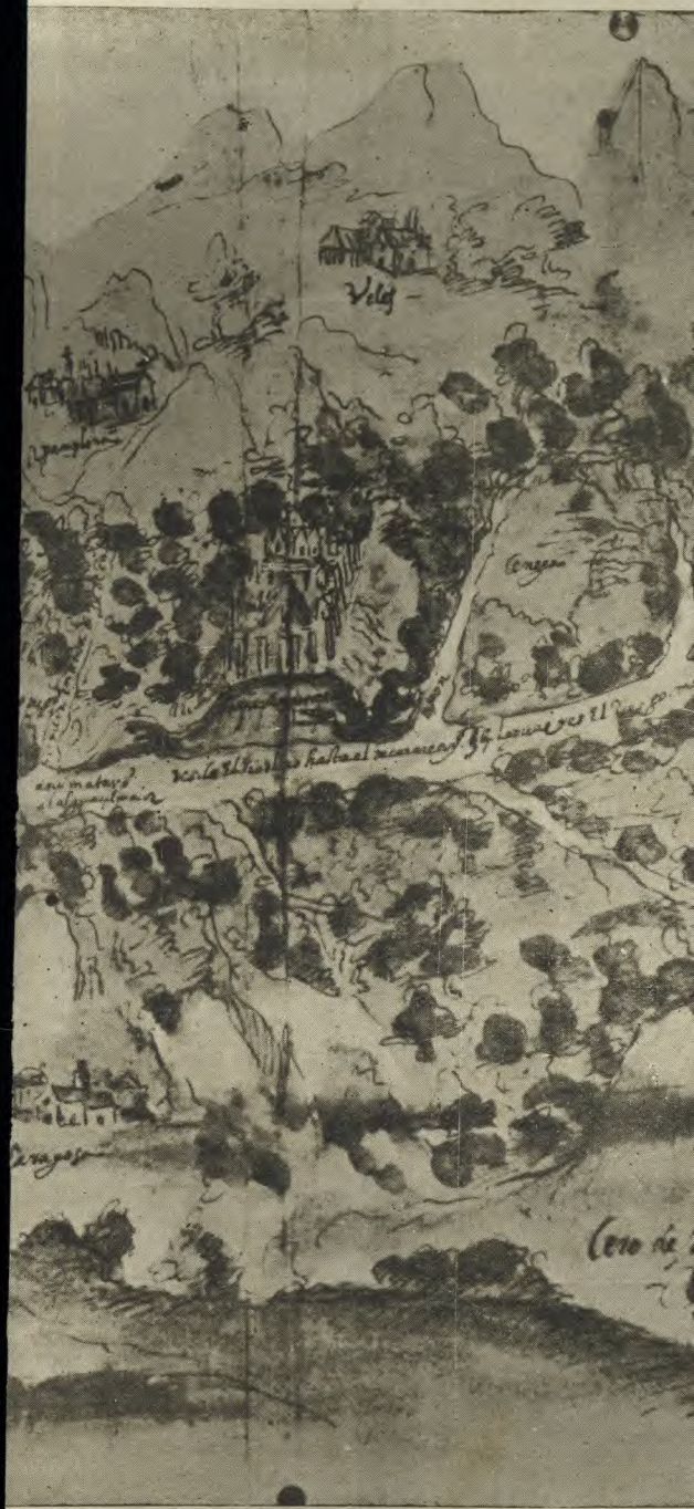
de la Magdalena en el Nuevo P VO GENERAL DE INDIAS.--72-3-23