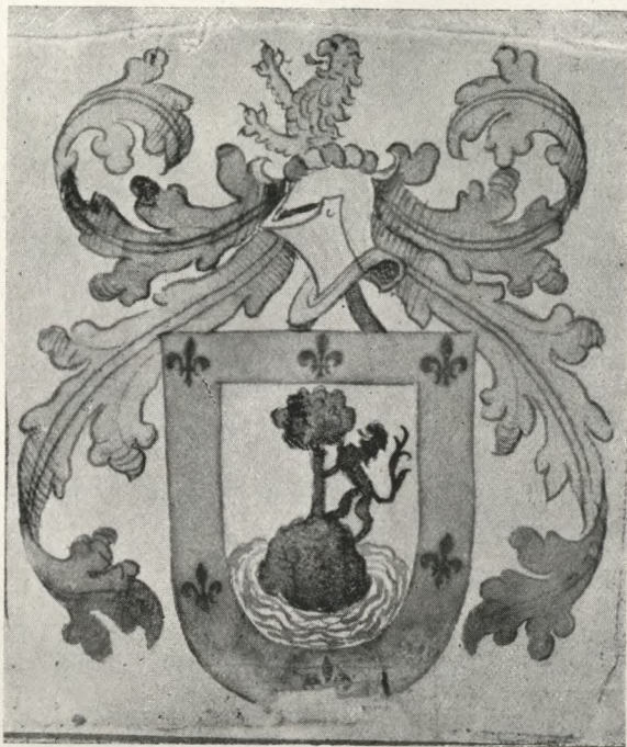
ESCUDO DE ARMAS DE LA CIUDAD DE VILLARRICA