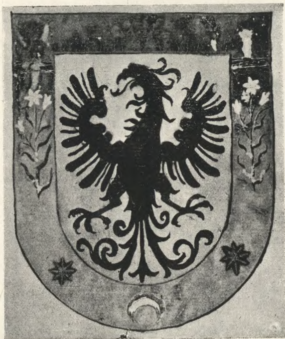
ESCUDO DE ARMAS DE LA CIUDAD DE LA CONCEPCIÓN