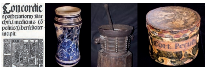
Figura 1. Piezas pertenecientes al Museo de la Farmàcia Catalana.

Todos estos elementos patrimoniales se encuentran dispersos en poblaciones del territorio catalán. En Barcelona se ubica el Museo de la Farmàcia Catalana, fundado por Jesús Isamat Vila (1895-1981), en el año 1957, ubicado en la Facultad de Farmacia de la Universidad de Barcelona; contiene el mobiliario del antiguo Colegio de Farmacia de San Victoriano y más de 10.000 piezas farmacéuticas. En el Decanato de la misma Facultad de Farmacia