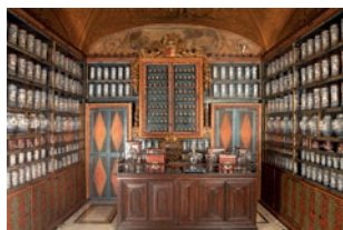
Figura 4. Farmacia antigua del Hospital de Santa Caterina (Girona).