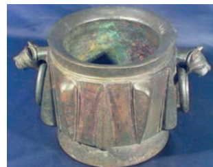
Figura 7. Mortero mozárabe de bronce, siglo XII, procedente del castillo de Monzón de Campos (Palencia). Museu Víctor Balaguer (Vilanova i La Geltrú).

Los investigadores que componen los grupos de trabajo de Historia de la Farmacia en Barcelona se integran en el proyecto del Museo de la Sanidad Catalana, ideado a partir del Museo d'Història de la Medicina de Catalunya, incorporando las colecciones de los Colegios Oficiales de Farmacéuticos, Odontólogos, Veterinarios y de Enfermería, así como la integración de los distintos museos de farmacia y farmacias antiguas.