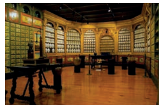
Figura 3. Farmacia de Santa Maria la Real de Nájera.