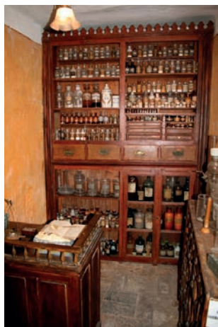
Figura 5. Botica-Museo en Salàs de Pallars.

En el Prat de Llobregat, el Laboratorio Oliver-Rodés ha recopilado una colección de 6.500 envases de botellas de agua de más de 140 países, de todo tipo de materiales: vidrio y poliméricos (PVC, polietileno, Pet, policarbonato); están organizados por países, marcas y formatos. En Puigcerdà existe una calle dedicada a Francesc Píguillem i Verdacer (1770-1826), médico y Subdelegado del Protomedicato en Catalunya, introductor en los Países Catalans de la vacuna antivariólica de Jenner.