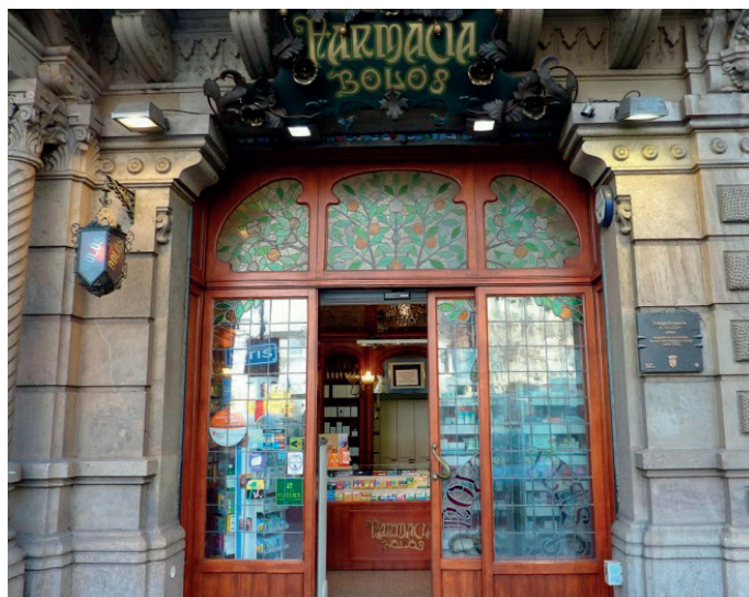
Figura 2. Farmacia Bolós (Barcelona).

Vallet (1900), Farmacia Comabella (1904), Farmacia Parent (1900), Farmacia Enrich (1902), Farmacia Rapesta (1902), Farmacia Diví (1904) y Farmacia Sanchis.