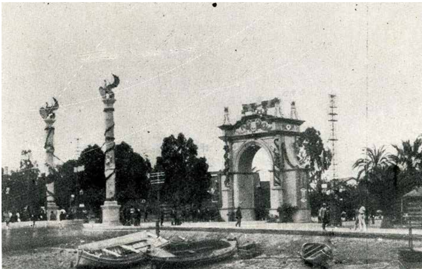
Imagen 5. Arco triunfal construido por la Junta de Obras del Puerto. Revista Tierra Argentina , octubre de 1927: http://www.huelva.es/portal/en/tierra-argentina-1927

servicio del cometido sancionador de la fiesta, caracterizada por el poderoso despliegue de efectos portadores de calculados mensajes, que penetran en sus destinatarios a través de todos sus sentidos. Se encargan de ello en este caso la riqueza visual del acicalamiento urbano ya comentado (colgaduras, luminarias y arquitectura efímera), el envolvente sonido de la música (bandas de diversa titularidad), la palabra recitada de los fervientes discursos, los gestos simbólicos, las salvas y cañones, el repique general de las