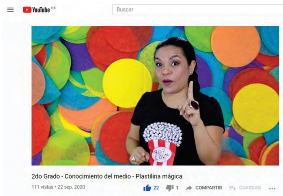
Imagen 6. Jornadas Estatales de las Humanidades, Ciencias y Tecnologías 2020