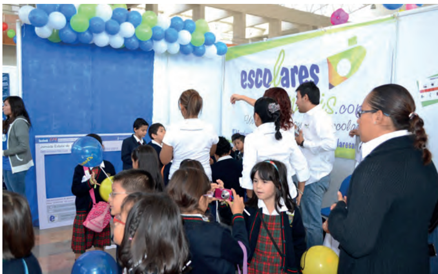
Imagen 1. XIX Semana Nacional de Ciencia y Tecnología

Es durante este año que Escolares San Luis se integra a la Red de Divulgación de Ciencia, Tecnología e Innovación (REDICITI) coordinada por el Consejo Potosino de Ciencia y Tecnología (COPOCYT) en San Luis Potosí, México. Uno de los primeros eventos en los que se participó, fue durante la XIX Semana Nacional de la Ciencia y Tecnología (Imagen 1), teniendo como meta la divulgación del impacto que tienen los medios masivos de comunicación en la interacción humana y el cuidado en el análisis de la información a la que se está expuesto.