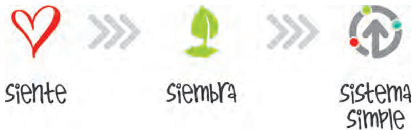
Figura 1. Metodología Carambas