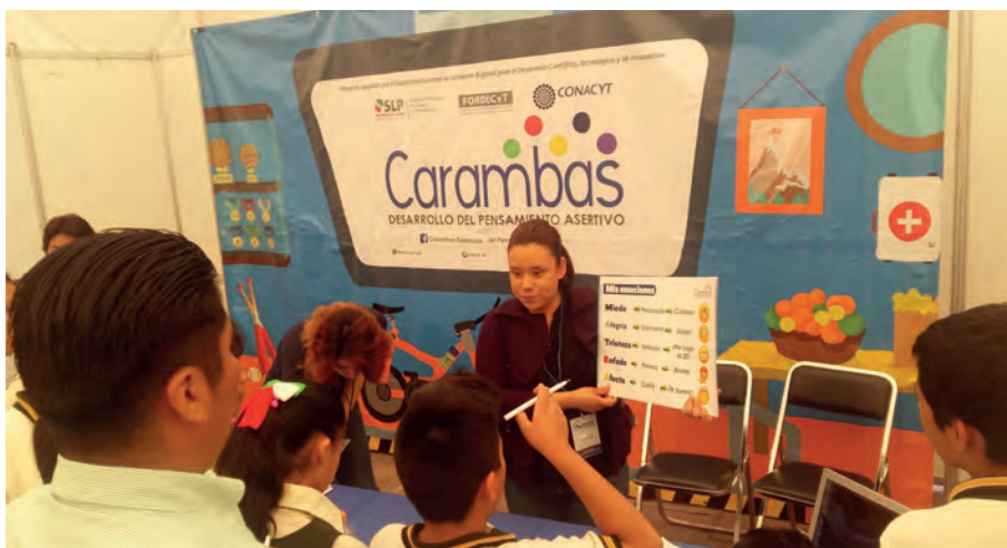
Autoría: Consejo Potosino de Ciencia y Tecnología.