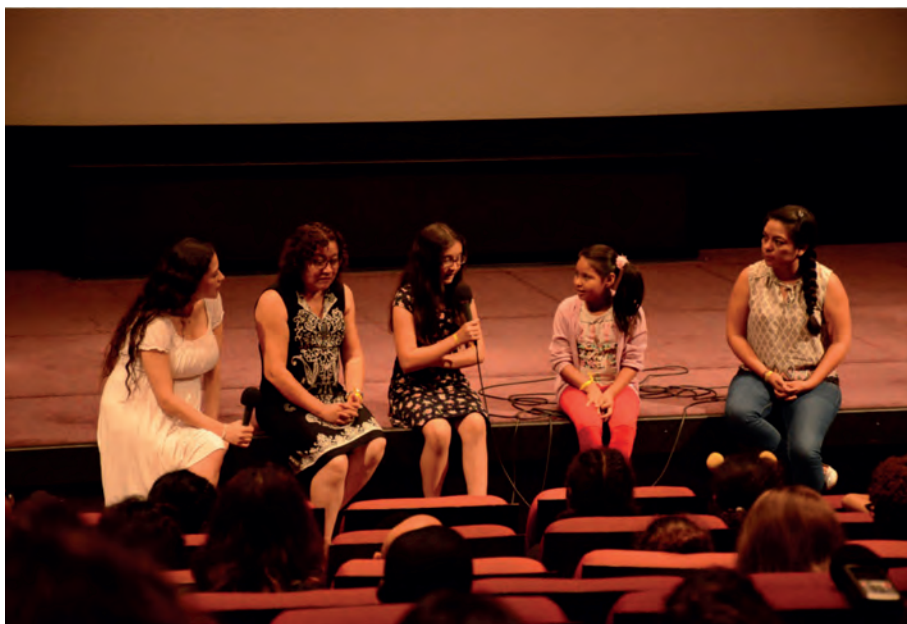
Autoría: María Olivia García Ibarra.

Con el objetivo dar seguimiento a los alumnos del grupo e integrar a nuevos miembros a la experiencia en la que la diversidad de métodos de estudio de diversas escuelas primarias no fue un factor determinante para el aprendizaje; más bien fue justo la diversidad de pensamiento e ideas lo que promovió un trabajo efectivo. Al no ser compatible con la universidad, se tomó la decisión de separar al taller, quedando registrado en el programa de cine ya mencionado y en el blog de la Cinemateca. Así se consolidó la presencia internacional de Carambas (Imagen 3).