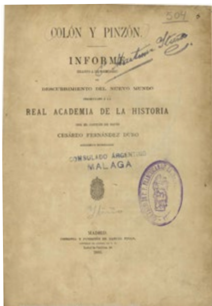
Portada del libro Colón y Pinzón , cuyo autor es Cesáreo Fernández Duro.

a Colón, señalaba en la prensa que las eventuales fiestas deberían “celebrarse en Palos de Moguer (sic) 8 el 3 de agosto de 1892” 9 .