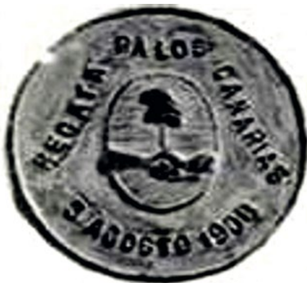
Medalla de plata que el Gobierno argentino regala a los tripulantes de los yates que tomen parte en la regata Palos-Canarias. Vida Marítima, 1 Enero 1908, p 22.