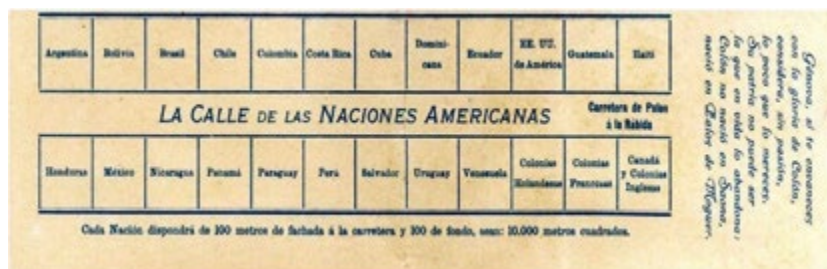
Avenida de las Naciones Americanas. Carretera entre Palos y La Rábida. Memorandum nº 5, 1 de julio de 1911.