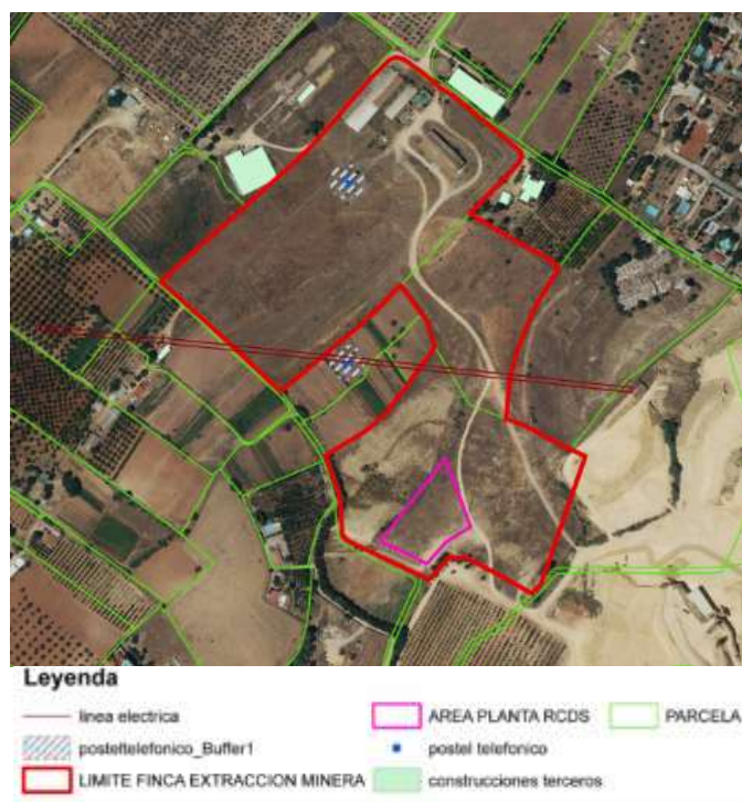
Figura 4. Localización de la planta de RCD.

De acuerdo con la Clasificación Nacional de Actividades Económicas 2009 (CNAE-2009) de España, dentro de la planta de gestión de residuos, se llevarán a cabo algunas de las actividades que se encuentran dentro del grupo E “Suministro de agua, actividades de saneamiento, gestión de residuos y descontaminación” las cuales son: