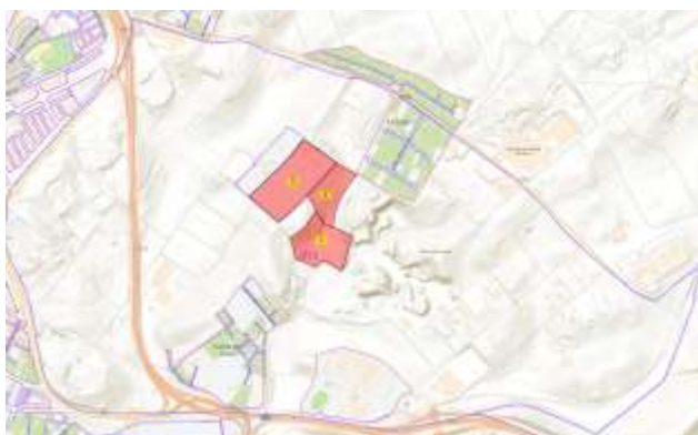
Figura 1. Localización del polígono 12, T. M. Alcalá de Guadaíra.

El área total del proyecto es de 134,779 m 2 , lo que serían 13.48 ha aproximadamente.