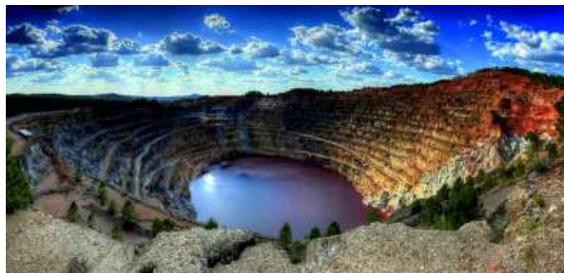
Figura 6. Corta Atalaya, parque minero Riotinto, Huelva.

Laboreo propio de yacimientos minerales metálicos que profundizan en vertical. Se realiza mediante un diseño geométrico tridimensional, en forma de cono invertido. Un diseño muy similar, pero no con la misma forma cónica invertida, se da en los yacimientos de carbón masivo, como son los lignitos pardos, donde la extracción mineral se realiza por banqueo descendiente, hasta llegar al fondo de la corta, calculado en función de parámetros de rentabilidad. El hueco que se genera en las cortas de minería metálica es, por lo general, muy profundo, en ocasiones superando los 300 m, como es el caso de la “Corta Atalaya” (Minas de Riotinto, Huelva).