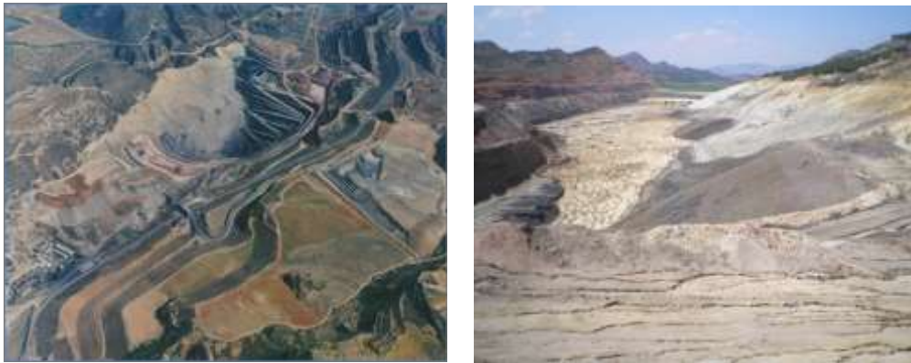
Figura 7. Minería de transferencia (izquierda) y relleno final (derecha) corta Barrabasa (Andorra, Teruel).

Este método permite la rehabilitación progresiva de la zona afectada a medida que se va transfiriendo el estéril y el suelo vegetal.