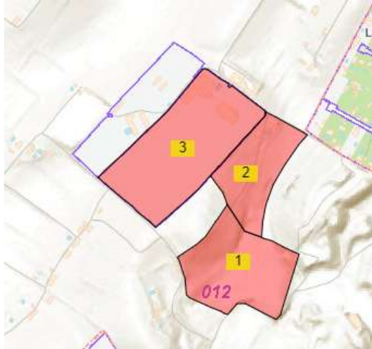
Figura 2. Localización de parcelas 112 (1), 53 (2) y DS LAPILLA_LA2 (3).

El proyecto tendrá dos actividades principales: la explotación minera de la cantera y la planta de gestión de residuos RCD.