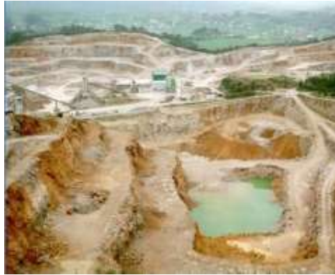
Figura 9. Cantera de rocas industrial, calizas para áridos de machaqueo en Camargo, Cantabria.

fracturas, rocas oxidadas e impurezas que no hacen posible su comercialización por no cumplir las calidades técnicas exigidas y otros rechazos de tratamiento, como los lodos. En el caso de las escombreras de mármol, caliza marmórea y granito, suele ser común una amplia variedad de tamaños del material con bloques que pueden medir desde centímetros hasta varios metros. Estos residuos como áridos han sido valorizados a través de la instalación de plantas de machaqueo y trituración dentro de la misma explotación.