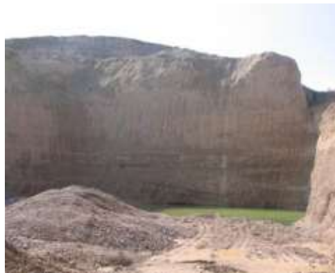
Figura 10. Gravera abandonada en Fuentes de Ebro, Zaragoza.

Las graveras con explotación bajo lámina de agua, son cuando el nivel freático se ve afectado, ya que la extracción se realiza parcial o totalmente bajo el agua. Generalmente, se realiza en un solo banco, el cual tiene una altura igual a la de la profundidad del hueco inundado. En este caso, los terrenos afectados son restaurados como lagunas. Y, las graveras con rebajamiento del nivel freático, se realizan mediante la construcción de pozos, zanjas, etc.