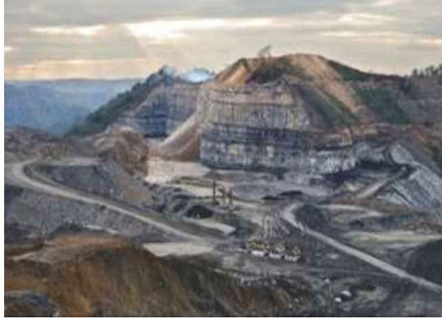
Figura 8. explotación de carbón por minería de contorno en los Apalaches E.E.U.U.