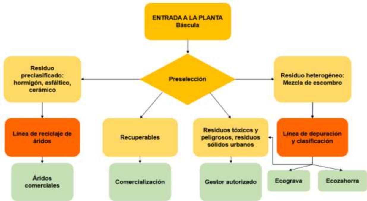
Figura 5. Diagrama general de procesos de la planta de gestión de residuos RCD.

Como se puede observar en el diagrama, el proceso de la planta de gestión de residuos RCD iniciaría en el momento en el que estos se reciben y se pesan en la báscula, que ya está instalada en el acceso de la explotación minera, en este punto se entrega un ticket, con el cual se debe dirigir hacia la caseta de control ubicada en la entrada de la planta de gestión de residuos RCD; allí, el encargado, revisará el contenido del material, y determinará si es aceptado o es rechazado. Una vez aceptado, se procederá a realizar la separación manual, diferenciando los residuos inertes no valorizables limpios, los cuales se almacenarán en un acopio, los residuos peligrosos, que serán almacenados en una caseta hasta su entrega al gestor autorizado, residuos no peligrosos, que serán almacenados en celdas, como plásticos, maderas, vidrios, hierro, cartón y fracción residuos, y también se entregarán al gestor autorizado. Los materiales recibidos como el hormigón, el asfalto y la cerámica, serán triturados y cribados, para obtener áridos que puedan ser vendidos. Así mismo, del escombros que se reciba, se pretende obtener material de relleno para obras civiles como son la Ecografa y Ecozahorra.