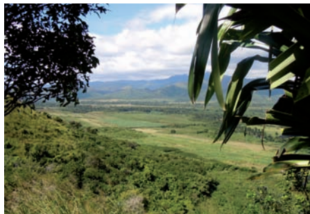
21. Paisaje agrario y natural del sur de la provincia de Ciego de Ávila.

En definitiva hay un gran campo abierto, un potencial inmenso en cuanto a bienes culturales de muy diverso tipo que son susceptibles de activación con el objetivo de contribuir al desarrollo territorial, que están siendo centro de interés de organismos gubernamentales, instituciones científicas, educativas y entes de intervención, entre los que está muy consolidado un concepto integral del patrimonio al servicio de la población que, a pesar de las grandes dificultades, está siendo aplicado con la perseverancia, el entusiasmo y el espíritu crítico y de superación del que hacen gala la mayoría de los cubanos. Desde España podemos aportar experiencias y conocimientos que enriquezcan el caudal del que disponen en la isla, pero Cuba puede reportar a España un enorme abanico de conceptos, actitudes y ejemplos de los que deberíamos estar dispuestos a aprender.