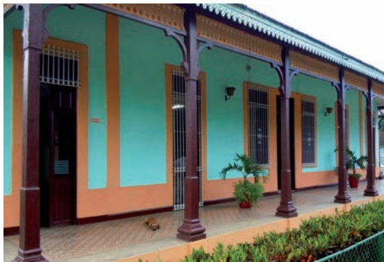
20. Antiguas oficinas del Central, hoy zona de recepción, exposición y museo. Central Azucarero Patria en Morón.

Se trata pues de un ambicioso proyecto que pretende recuperar y proteger el legado cultural agrario procedente de la actividad cañera, para ponerlo al servicio de la comunidad en sus distintos aspectos: recuperación de la identidad, rehabilitación de bienes culturales, formación y difusión, utilidad turística, generación de nuevos empleos y mejora de infraestructuras.