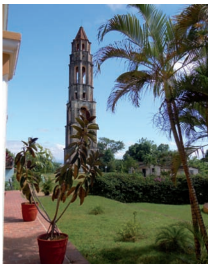
4. Torre del ingenio de Manaca-Iznaga. El valle de los Ingenios aún a un espectacular patrimonio paisajístico con la tradición agraria de la caña de azúcar.