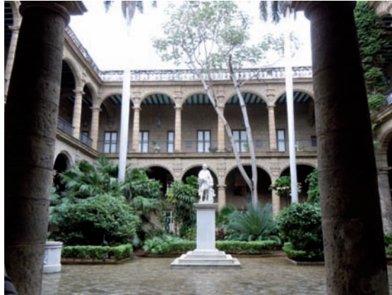
7. La Oficina del Historiador de la Habana es el núcleo central de la actividad patrimonial en la capital. Palacio de Segundo Cabo: Oficina del Historiador y Museo de los Capitanes Generales.