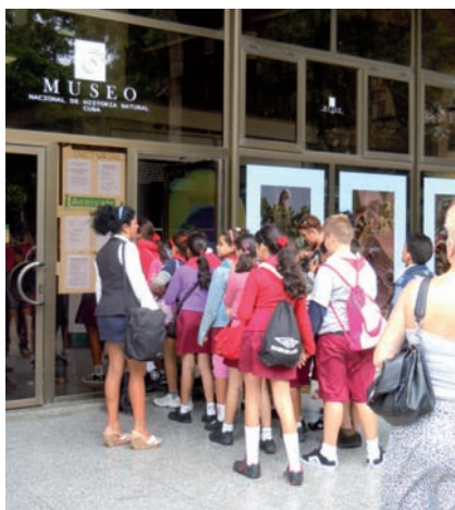
9. El conocimiento de la historia y la cultura cubanas es prioritario en el sistema educativo. Visita de estudiantes de primaria al Museo Nacional de Historia Natural.

La figura del Historiador de la Ciudad no está contemplada en la estructura orgánica general de Patrimonio, como tampoco lo están las del Restaurador o Conservador de Ciudad. Estas figuras obedecen a iniciativas de las Asambleas Municipales del Poder Popular (Ayuntamientos) que los nombran y aprueban. Así es como nació y se ha desarrollado la Oficina del Historiador de la Ciudad de La Habana: una iniciativa municipal que ha creado un modelo autónomo en función de sus necesidades y experiencias.