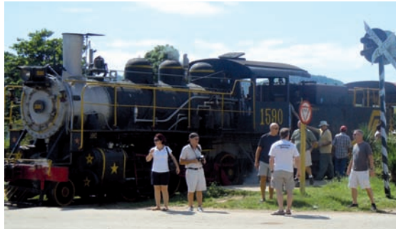
18. Uno de los usos dados a los antiguos trenes azucareros es el transporte de visitantes desde los destinos turísticos más consolidados a las ciudades patrimoniales, recorridos por paisajes singulares y a los centrales reconvertidos en museos abiertos.

sino de piezas reales y originales vivas gracias al milagro de su mantenimiento.