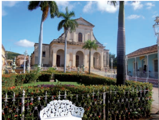
3. Trinidad, en la provincia de Sancti Spiritus, es una de las ciudades coloniales mejor conservada de América. Plaza e Iglesia de la Santísima Trinidad.

A partir de ese mandato fundamental se han ido desarrollando normativas específicas. Las más importantes son la Ley nº 1 de Protección al Patrimonio Cultural, y la Ley 2 de los Monumentos Nacionales y Locales (ambas de 4 de agosto 1977).