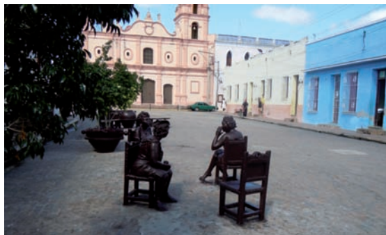
2. Camagüey ha sido la última ciudad cubana en ser incluida en la lista del Patrimonio Mundial de la UNESCO. Plaza del Carmen.

La experiencia acumulada y los conocimientos adquiridos en la Habana desde hace más de un cuarto de siglo han permitido una proyección del trabajo con el patrimonio cultural y los entornos patrimoniales no sólo en La Habana y Cuba sino fuera de sus fronteras, otorgando una gran importancia tanto a la intervención como a la formación integral. Ello tuvo como consecuencia la puesta en funcionamiento en el año 2006 del Colegio Universitario San Gerónimo como facultad de la Universidad de La Habana, donde se imparte exclusivamente la carrera Preservación y Gestión del Patrimonio Histórico-Cultural, dirigida a formar profesionales capaces de asumir y responder a las demandas contemporáneas del trabajo con el patrimonio, conscientes de que constituye además un legítimo instrumento para el sostén de la identidad universal, nacional y local. Además, tiene un doctorado interamericano y se desarrollan cursos de postgrado, muchos de ellos realizados en colaboración con universidades españolas.