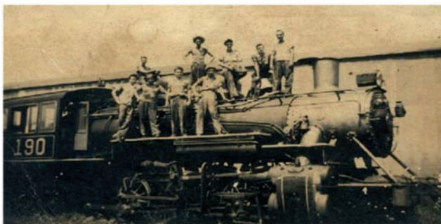
16. El primer sistema ferroviario azucarero privado se implantó en los centrales Jagueyal y Steward, en la actual provincia de Ciego de Ávila, convirtiéndose en símbolos de la cultura azucarera. Locomotora a vapor, años 40 del siglo XX.