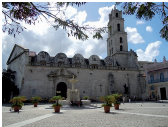
1. Plaza de San Francisco de Asís. La Habana es la ciudad que históricamente ha ofrecido el mayor atractivo patrimonial de Cuba.

A pesar de las dificultades derivadas del injusto bloqueo comercial, económico y financiero ejercido por USA desde el año 1960, de las condiciones sufridas durante el llamado periodo especial en la década de los noventa, y de sus propios errores y carencias, Cuba ha considerado el reconocimiento y la protección de su patrimonio como parte esencial de su acción cultural. Así lo ha reconocido en múltiples ocasiones Herman Van Hoof, responsable de la UNESCO para América Latina y el Caribe, señalando el enorme esfuerzo que realiza Cuba para conservar tanto sus sitios incluidos en la lista del Patrimonio Mundial como el resto de su patrimonio cultural, y destacando la voluntad política de crear instituciones con ese objetivo, dar continuidad a las mismas, y persistencia por seguir avanzando pese a las dificultades. En ese sentido, hay que resaltar el desarrollo de la planificación para la conservación y gestión patrimonial a través de Planes Maestros y Directores que responden a los requerimientos de la Convención del Patrimonio Mundial y que aprovechan el gran compromiso, interés y conciencia de la población hacia su historia, identidad y patrimonio 2 .