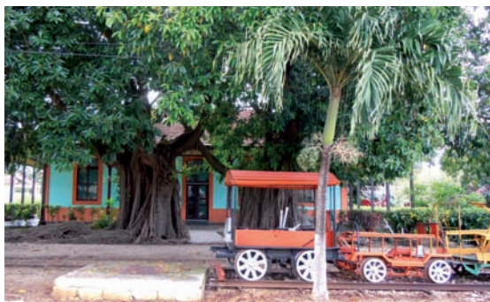
17. El Central azucarero Patria en Morón está siendo rehabilitado y restaurado con el objetivo de recuperar la cultura azucarera y reivindicar identidades culturales útiles a la educación, la generación de empleo, el desarrollo territorial y el turismo.

Tras la mencionada crisis de los años 90 del siglo XX, parte de la producción azucarera se vino abajo. Buena parte de los campos de cultivo y de los Centrales Azucareros abandonaron su actividad total o parcialmente y entraron en un proceso de deterioro importante. Una vez paralizado el antiguo Central Patria, en el año 2000 surge la necesidad de buscar otras alternativas de desarrollo y teniendo en cuenta la proximidad de la zona turística de Jardines del Rey (más conocida en Europa por los cayos Coco y Guillermo), las condiciones naturales de la región y los recursos culturales existentes, se decidió promover algunas iniciativas basadas en el patrimonio cultural agrario. Este complejo agroindustrial azucarero se convirtió en 2001 en Empresa de Producción Diversificada, favoreciendo la reconversión de la intensiva producción cañera y su compatibilización con otros usos.