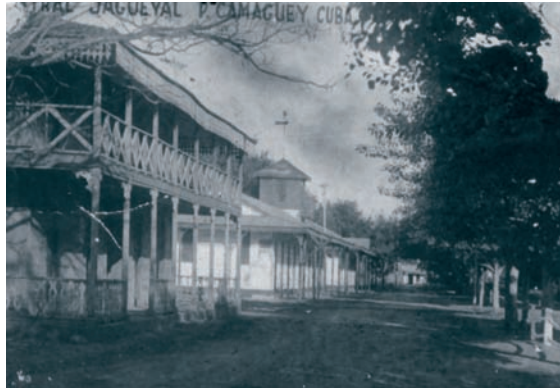
15. La explotaciones azucareras (ingenios) están muy relacionadas con el colonialismo español y la influencia norteamericana. Calle del batey (poblado) del Central Jagueyal, primera década del siglo XX.

Por último, a estos valores patrimoniales hay que añadir, para comprender nuestro interés por Ciego de Ávila, el protocolo de hermandad y cooperación establecido entre la ciudad de Baeza (incluida con Úbeda en la lista del Patrimonio Mundial de la UNESCO) y ciudad en que radica la sede Antonio Machado de la Universidad Internacional de Andalucía) y la ciudad avilena de Morón.