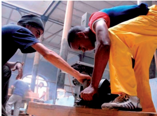
12. La Escuela Taller Gaspar Melchor de Jovellanos nace de la experiencia y colaboración españolas. Fotografía de Alberto Borrego (Cuba).

acentuado proceso de decadencia, fue incorporado en 1992 por la cooperación española e insertado en el proceso de recuperación de La Habana Vieja a través de La Escuela-Taller Gaspar Melchor de Jovellanos, de la Oficina del Historiador. En ella se forma a técnicos medios y obreros cualificados en especialidades que corrían el riesgo de perderse (yeseros, carpinteros ebanistas, herreros, etc.), en muchos casos procedentes de sectores de la población con menos oportunidades para el desarrollo y que, tras el proceso de formación y trabajo, tienen un puesto garantizado en la Oficina del Historiador.