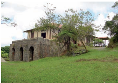
6. El Parque Arqueológico de las primeras plantaciones del café reconoce los valores patrimoniales de la actividad agrícola con su conjunto de manifestaciones materiales e inmateriales.

En definitiva, el CENCREM, el Consejo Nacional de Patrimonio Cultural, los Centros Provinciales de Patrimonio, los Equipos Técnicos de Monumentos y otras instituciones culturales, congregan a especialistas de notable experiencia en este campo y han orientado e intervenido en la conservación y restauración de ciudades y decenas de monumentos relevantes y sitios del país, trazando programas de rescate para centros, conjuntos históricos, paisajes culturales y sitios naturales, restaurando importantes obras del patrimonio mueble, conducido investigaciones de diversas índole sobre estos objetivos y conformado un sistema primario de cursos y adiestramientos.