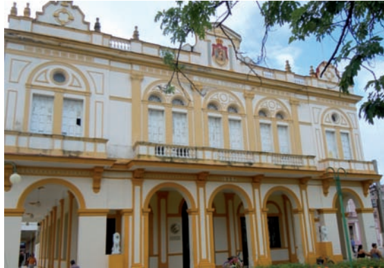
14. El recuerdo de la presencia española es permanente en todos los rincones de la isla. Edificio de la antigua Colonia Española en Morón, la ciudad del Gallo.

canaria y tabaquera), las fiestas del 10 de octubre en el municipio de Venezuela, las relacionadas con religiones afrocubanas, o la celebración del fin de la zafra en los bateyes de los centrales azucareros.