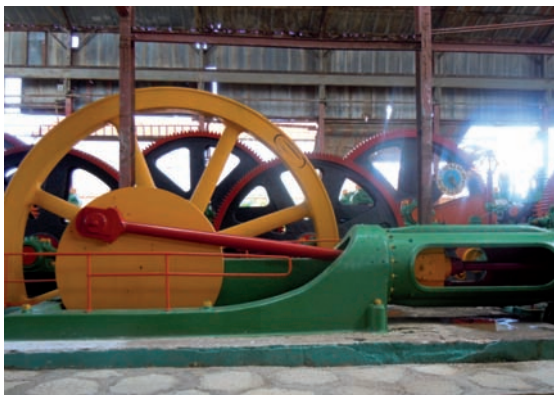
19. La antigua maquinaria de la factoría se pone en funcionamiento para mostrar el proceso de transformación industrial de la caña.

La casona, de fuerte influencia estilística del sur de los USA, igualmente restaurada, exhibe fotos, documentos, artículos de interés y una breve historia de todos los centrales de la provincia avileña, así como una muestra de los principales productos derivados de la caña que comercializa la empresa cubana Tecnoazúcar del Ministerio del Azúcar (MINAZ), a la cual pertenece la entidad moronense.