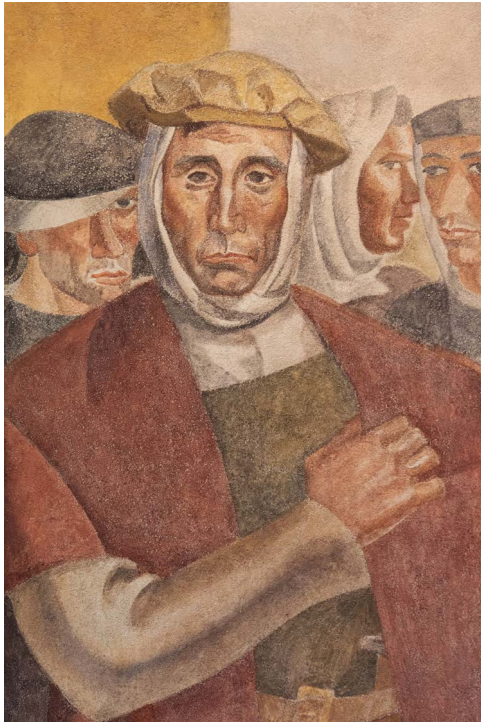
Detalle del fresco los «Heroicos hijos de Palos y Moguer». Daniel Vázquez Díaz. Monasterio de La Rábida.

músicos ciegos" (1921). Todas estas obras sintetizan más de dos décadas de evolución, concretan el ideario estético y humano del artista onubense y que se manifiesta con autoridad e independencia plástica en las estancias del monasterio de La Rábida. El compendio se revela en esa sencilla disposición estructural, humilde y armoniosa, síntesis de la tradición clásica de Nuno Goçaves (el padre de la pintura española lo denominó Eugeni D'Ors), Zurbarán (cargado de su primoroso goticismo, que dijera el crítico Juan de la Encina) y El Greco con los ecos parisinos de Cezanne y el primer cubismo que brota en Horta del Ebro de la mano de Pablo Picasso. Tergiversando a Benjamín Palencia, el paisaje de La Rábida enlaza un viaje en bucle a la persona y al paisaje, pues "más que personas humanas, son volúmenes, formas o masas crea-