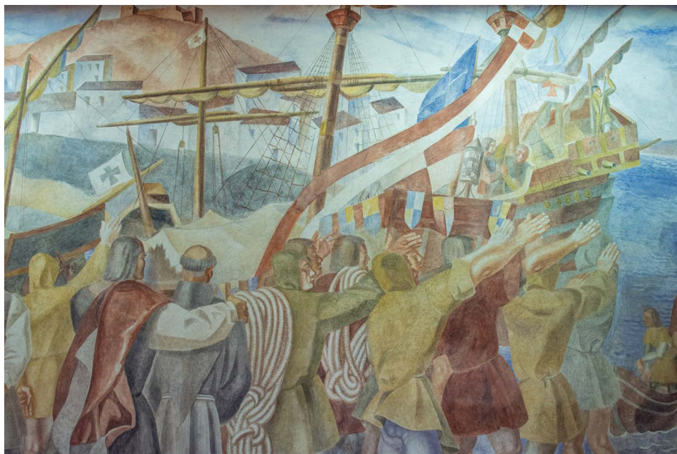
Detalle del fresco «La partida de las Naves». Daniel Vázquez Díaz. Monasterio de La Rábida.

saje, en palabras suyas celebrando sus encuentros con Juan Ramón Jiménez y Zenobia Camprubí, que “se aparta muchas veces en soledad para vivir el silencio y la emoción de aquella luz, la transparencia de aquellos cielos atlánticos tan cantados en los versos de su Moguer: ‘Soledad sonora’; los malvas y oros de las tierras donde trotara Platero”.