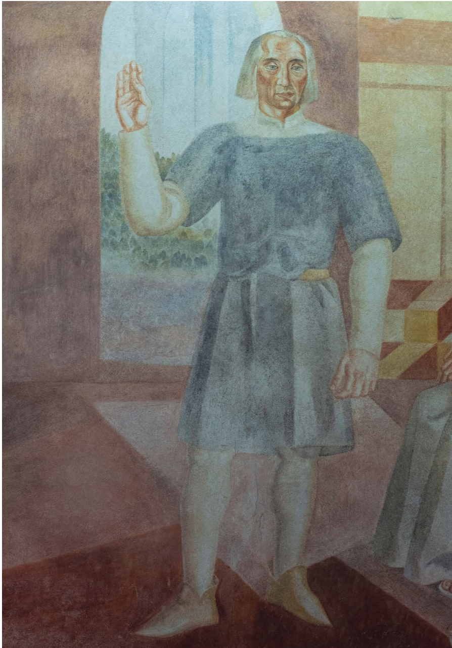
Detalle del fresco «Las conferencias». Daniel Vázquez Díaz. Monasterio de La Rábida.