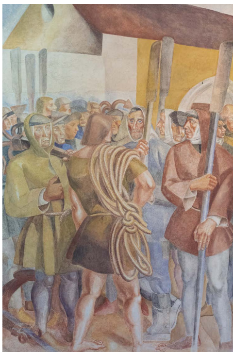
Detalle del fresco los «Heroicos hijos de Palos y Moguer». Daniel Vázquez Díaz. Monasterio de La Rábida.

5. Años de Academia, Excelencia y Transmisión (1936-1969). Pudiéramos decir que en Palos asió el cielo. Y la tierra. Y los unió. Es una larga etapa de revisión constante de procesos estudiados. Larga etapa donde las sospechas de moderno y europeizante aún le señalan. Estigma de cancerberos ciegos e inquisidores. Qué gran estupidez la de los etiquetadores, la de los fisgonos impotentes. Y Vázquez Díaz los soportó durante toda su vida, desde la monarquía de Alfonso XIII hasta la dictadura del general Franco. Dalí, a comienzo de la década de los veinte, como muchos miembros de El Paso, en los años cincuenta y sesenta, supieron defender la voz de Vázquez Díaz ante tanta estulticia.