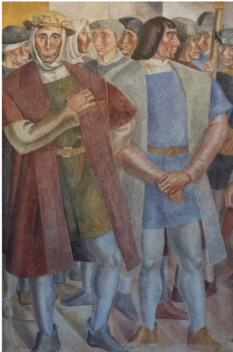
Detalle del fresco los «Heroicos hijos de Palos y Moguer». Daniel Vázquez Díaz. Monasterio de La Rábida.

ella a través de la mejor tradición de su país. Aprende, suma, vive, dialoga, selecciona, funde y alecciona sin pasar facturas.