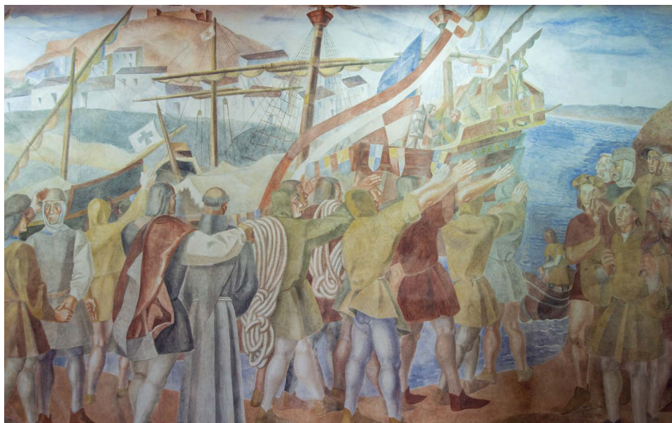
«La partida de las Naves». Daniel Vázquez Díaz. Monasterio de La Rábida.