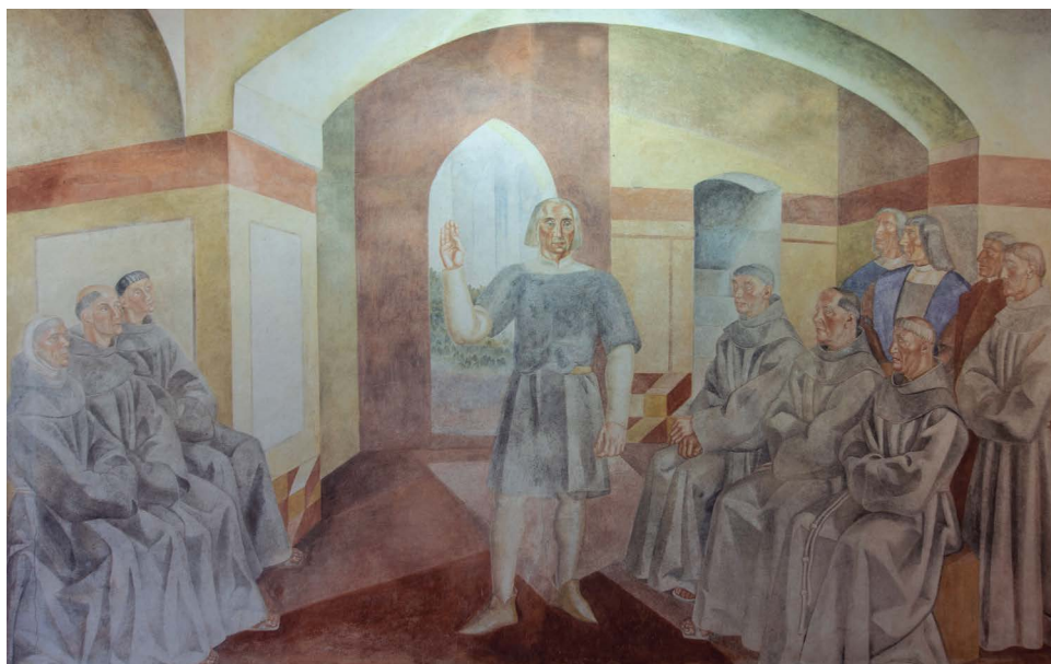
«Las conferencias». Daniel Vázquez Díaz. Monasterio de La Rábida.