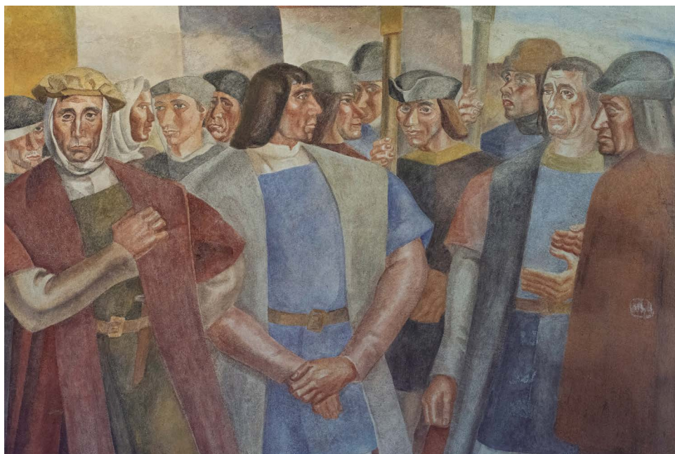
Detalle del fresco los «Heroicos hijos de Palos y Moguer». Daniel Vázquez Díaz. Monasterio de La Rábida.

tierra, que se pisa, palpa y respira, razones que confieren caracterización y determinismo. Madrid (la sierra de Guadarrama) y el País Vasco son dos estados perceptivos. Sin duda imprescindible el que se abre en Fuenterrabía. Pero las tierras de Huelva (de la cuenca minera de su Nerva natal a La Rábida y Palos) protegen y valorizan toda su obra. No es un burdo o simple compromiso de estancia eventual. No es un paisaje más. Reitero, es la síntesis, la simplicidad de líneas y cuerpos, no sencillez, a todo su ideario estético. Todo el paisaje, como el pensamiento de Vázquez Díaz, se hace más suyo cuando se comunica en Palos con su paisaje y con su gente. En todo el año del "Poema del descubrimiento", en toda su conformación, todos los paisajes palermos se hacen en pureza Vázquez Díaz, cristalizados, bajo el pensamiento de Ángel Ganivet, de misticismo cristiano, individualismo y senequismo. Vázquez Díaz en toda su esencia, en todo su esplendor intelectual y sensitivo.