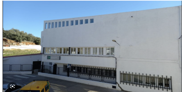
FIG 4: Edificio dedicado a la FP

Además, el municipio cuenta con una Residencia Escolar, por lo que la mayoría del alumnado no es de la localidad, sino en su mayoría de pueblos de un radio aproximado de 60 km.