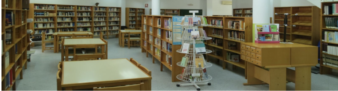
FIG 2: Biblioteca Pública municipal