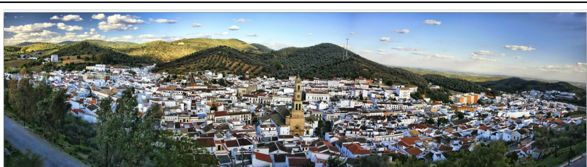
FIG 1: Municipio

También cuenta con una Biblioteca Pública que se inauguró en 1995, tiene tres plantas y posee un fondo de casi 10.000 ejemplares compuesto por libros, audiovisuales y algunas revistas de temática local. Además, forma parte de la Red de Bibliotecas Públicas de Andalucía.