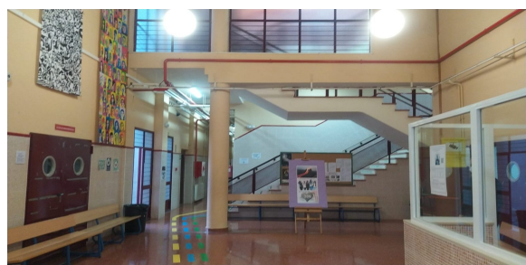
FIG 8: Hall del edificio