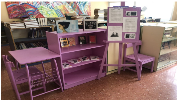
FIG 5: Rincón Violeta

El centro cuenta con una biblioteca escolar, donde además se exponen los trabajos que realizan los distintos cursos del centro, como puede ser el rincón violeta con motivo del 25N para dar visibilidad a todas las mujeres injustamente olvidadas, cuadros inspirados en poemas de autores andaluces celebrando el Día de Andalucía, etc.