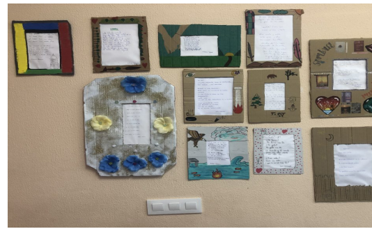
FIG 6: Cuadros inspirados en poemas de autores andaluces

Nuestro centro tiene aprobado el Plan de Compensatoria y también pertenece a la Red de Escuela Espacio de Paz, es importante mencionar el Pacto sobre la Igualdad de género.