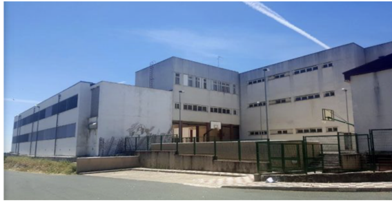
FIG 3: Edificio principal