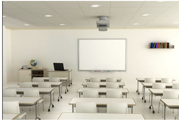
FIG 9: aula de referencia

El aula cuenta con wifi libre del programa de Escuelas Conectadas.