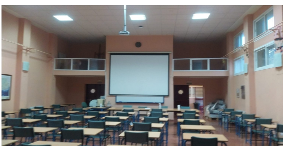
FIG 7: Salón de Usos Múltiples

Por otro lado, el centro cuenta con Salón de Usos Múltiples, aula de informática y cuenta con wifi libre del programa de Escuelas Conectadas, pantallas digitales y Restaurante-comedor. La pantalla digital se utiliza como pizarra y para proyección de vídeos, exposiciones de los alumnos, apoyo de material audio-visual, búsqueda o apoyo de información.