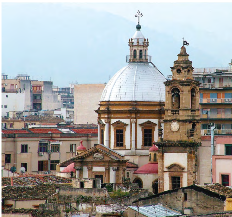
Figura 2. Palermo. Iglesia de San Francesco Saverio. Exterior.

estáticas y morfológicas de esta fachada que, sin embargo, encuentra su límite pero también su razón en las cadencias artesanales.