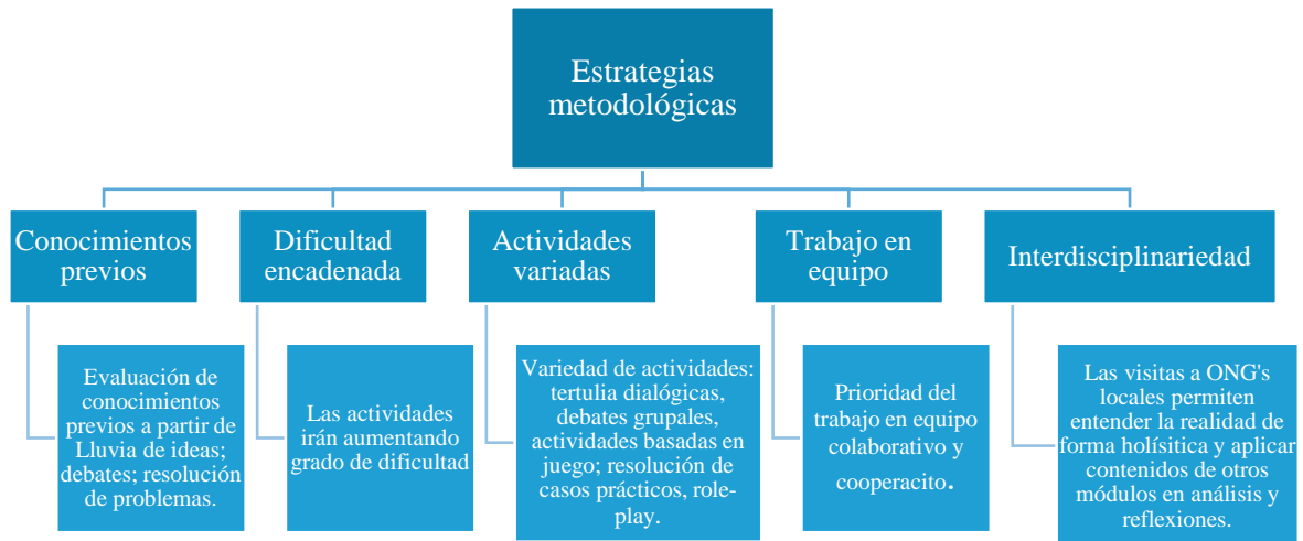
Figura 2. Estrategias metodológicas.

Por lo tanto, en base a favorecer la inserción laboral del alumnado y contribuir a la mejora de su proceso de enseñanza-aprendizaje se tendrán en cuenta una serie de estrategias metodológicas, como se muestra en la imagen siguiente: