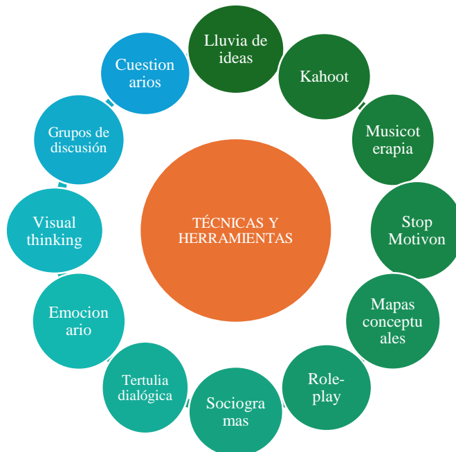
Figura 3. Técnicas y herramientas metodológicas.

A lo mencionado anteriormente, hay que sumar diversas técnicas y herramientas que van a permitir el desarrollo de la metodología, tal y como se muestra en la siguiente imagen: