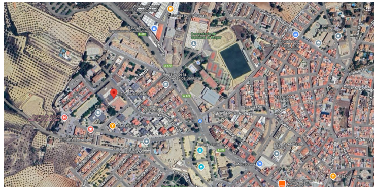
Ilustración 1 Localización geográfica del centro

alcanza los 14.126 habitantes que conviven en un entorno fundamentalmente agrícola , donde predomina el olivar de mesa y el cultivo de cereal (trigo). Sin embargo, cuenta con vocación emprendedora , de tal manera que el sector empresarial supera las 900 unidades empresariales, destacando el sector servicios.