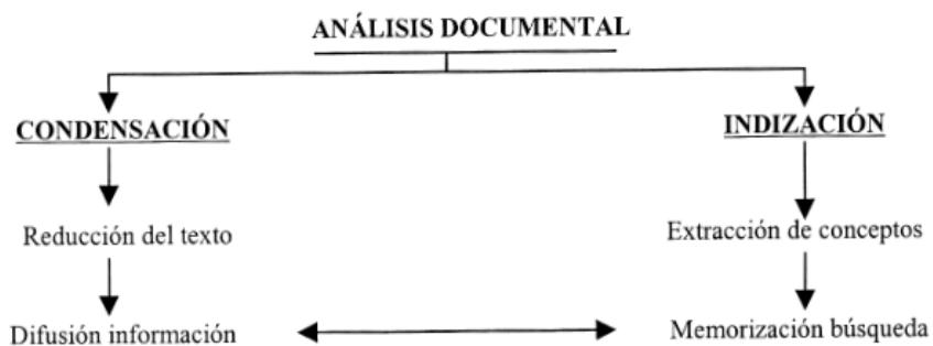
Figura 2. El análisis del contenido según Gamarra (2003).

De otro lado, el análisis de contenido consta de dos partes: la condensación y la indización (véase figura 2). La primera consiste en la reducción del texto para su posterior