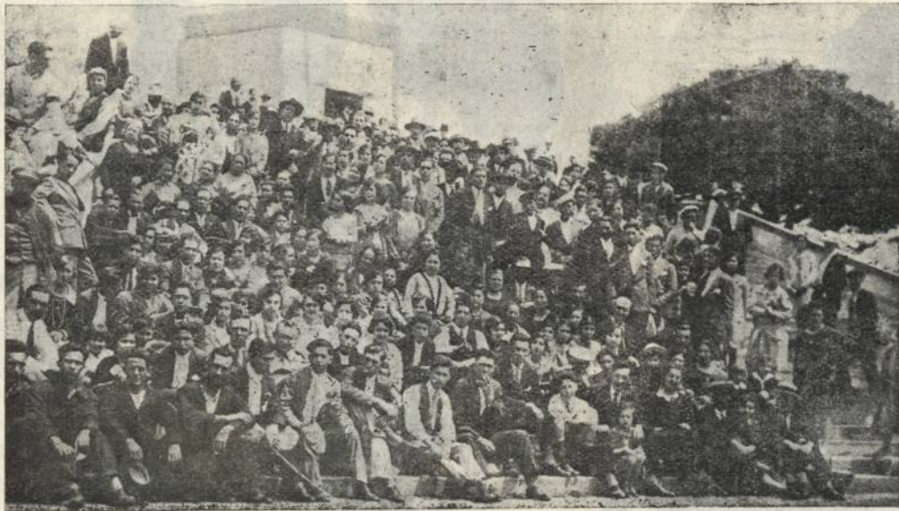
RECUERDOS COLOMBINOS. EMPLEADOS Y OBREROS DE LA COMPAÑÍA DE RÍO-TINTO CON SUS FAMILIAS VISITANDO LA RÁBIDA EN UNIÓN DE LA BENEMÉRITA SOCIEDAD COLOMBINA QUE LOS RECIBIÓ Y AGASAJÓ.