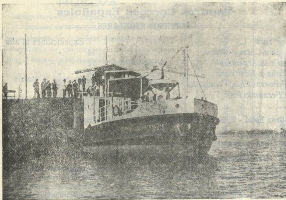
Transbordador «F. MONTENEGRO», para atravesar el río Tinto de Huelva a la Rábida.