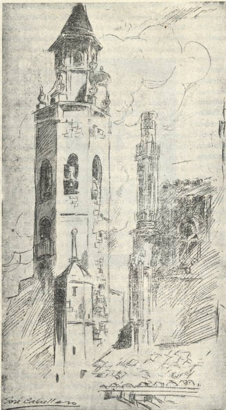
HUESCA. CATEDRAL. PARTE ALTA DE LA PACHADA Y TORRE DE LA PARTE ALTA DEL CAMPANARIO.