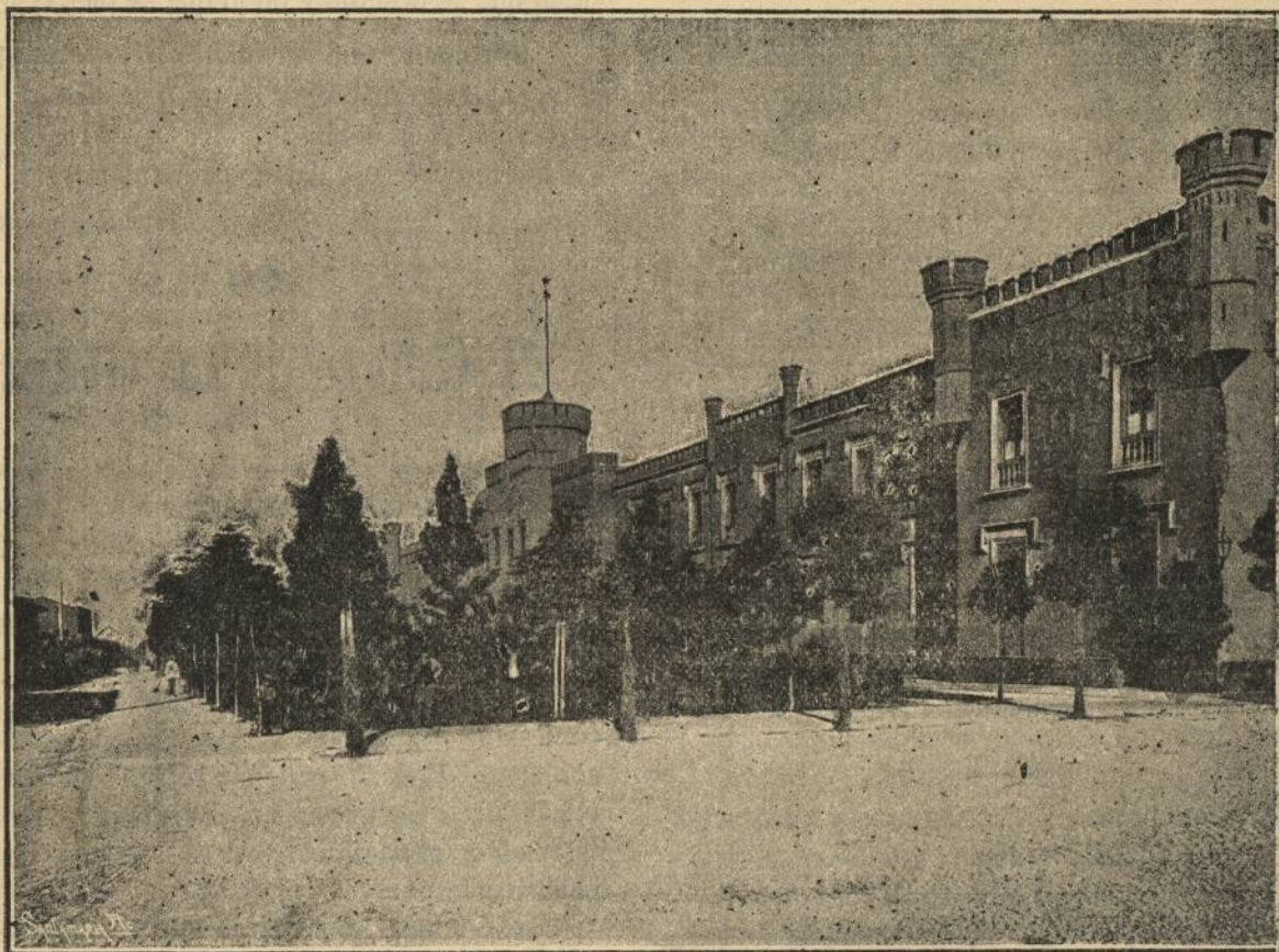
CHILE.—Santiago: Cuartel de la Policía