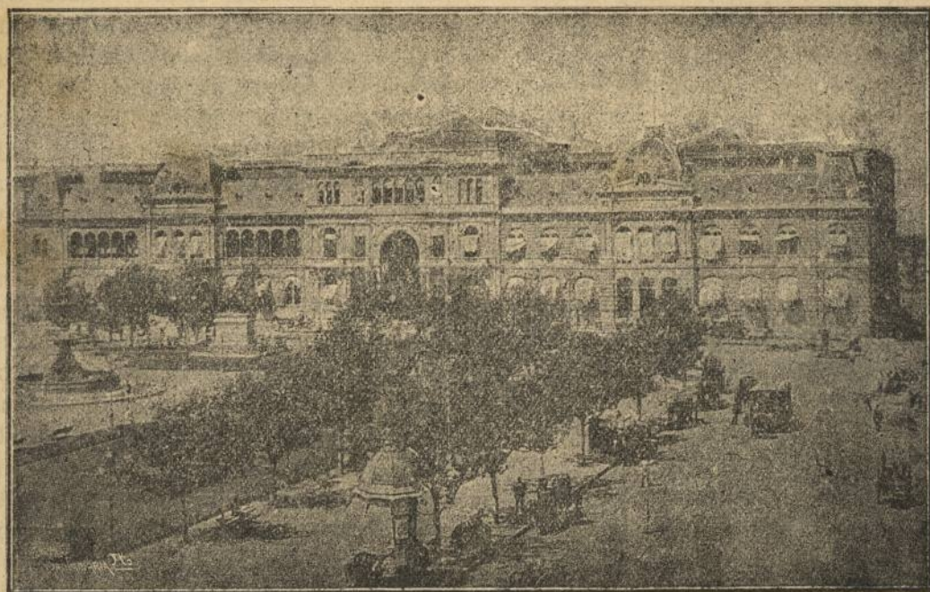
ARGENTINA.—Casa de Gobierno en la capital de Buenos Aires

por el colega onubense, pues perpetuar la memoria del Almirante sin asociarla a la de los que lo secundaron en la empresa, encarnada en los nombres de los lugares en que vieron la luz, es como olvidar en la Natividad Cristiana aquel rústico y humilde portal que albergara al Dios Hombre en aquella memorable noche en que entre la pobreza