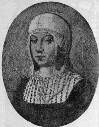
DOÑA ISABEL LA CATÓLICA.