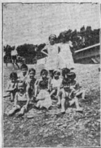
TARDES DE AGOSTO. NIÑOS BAÑÁNDOSE EN LA BELLSIMA PLAYA DE LA PUNTA DEL CISO, FRENTE A LA RÁBIDA.

Todas son realidades. Esta oratoria fina, recta—camina por el cauce del amor—debe ser espiritual, porque está impulsada por un corazón ardiente; porque el orador ha puesto en ella, viveza en la palabra y amor en el alma porque ha hablado con el espíritu.