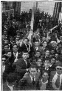
EL 12 DE OCTUBRE. LOS ESTUDIANTES Y COLOMBINOS EN EL TRANSBORDADOR