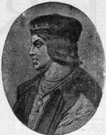
DON FERNANDO EL CATÓLICO.

cuerdo—nada más que el recuerdo—de nuestras glorias pretéritas.