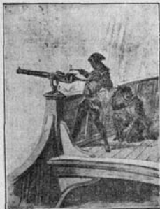
DE LA CARABELA SANTA MARÍA.

rrables amargas, pero conquistó y disfruta en la posteridad de la máxima grandeza espiritual de que en lo humano puede tenerse idea.