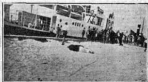
LOS ESTUDIANTES EMBARCANDO EN EL TRANSBORDADOR MONTNEGRO LA MAÑANA DEL 12 DE OCTUBRE

Y en ese empeño os acompañaron estas criaturas que, en camaradería gentil, dan belleza, gracia y donosura a nuestra peregrinación anual, tributo de las generaciones que nacen