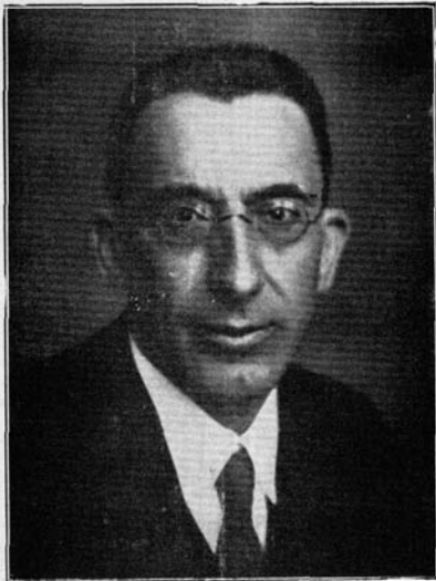
EXCMO. SR. D. LUIS DE ZULUETA MINISTRO DE ESTADO DE LA REPÚBLICA.

¿Queréis tener aquí una impresión directa de estas realidades? Observad que estamos congregados en este recinto ciudadanos de nacionalidades muy diferentes. Pues bien: ¿hay entre vosotros uno solo que tenga esta noche la sensación de hallarse entre extranjeros? Esta es la realidad profunda sobre la cual hay que contar siempre en nuestra relaciones. Este es el privilegio singular que poseemos en común los hombres de nuestro idioma y de nuestra estirpe; el de que podamos recorrer más de veinte naciones soberanas, pesar de un continente a otro, de uno a otro hemisferio, ver como cambian los paisajes, las temperaturas y varían sobre nuestras cabezas las cons-