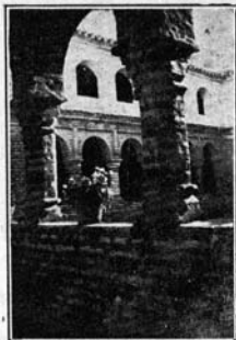
EL FOTÓGRAFO HA ESCOGIDO UN BELLO BINCÓN

Generalmente se pensaba que ninguno de los medios de que disponen los sentimientos colectivos de la gratitud y de la admiración, había permanecido inactivo en la obra uni-