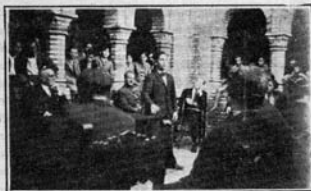
EL 12 DE OCTUBRE HABLARON LOS ESTUDIANTES...

rés que despierta en el Mundo nuestro momento actual y de las responsabilidades del mismo, le hablaba yo de su discurso en Ginebra, discurso que nosotros debemos recoger y recogemos, que la Sociedad Colombina es continuidad histórica, continuidad que hoy la exageración de la mental-