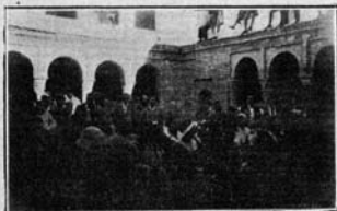
...ARRANCANDO ENTUSIASTAS OVACIONES...

La sede de ese organismo, de esa institución permanente que con visión de la realidad declara el Ministro ser el momento de constituirse, está en este rincón andaluz que empieza en los ríos Tinto y Odiel y acaba en la casa de Contratación de Sevilla, rincón ancestral del sentimiento