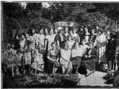
«AMIGOS DEL NIÑO». UN GRUPO DE BELLAS «CAMARERAS» EN LA MAÑANA DEL 12 DE OCTUBRE.

Actuaron de camareras, muy gentilmente, varias señoras y señoritas profesoras.