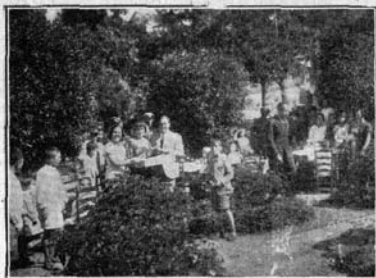
AMIGOS DEL NIÑO. LAS MESAS ENTRE LOS ÁRBOLES Y LAS FLORES

Después de visitar el Monasterio el numerosísimo público se congregó en el patio donde debía celebrarse el tradicional acto en recuerdo de la fecha.