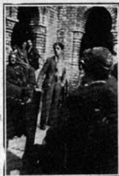
...DE SUS COMPAÑEROS.

No podéis romper con la Historia; aunque quisierais, no podríais, equivaldría a renegar de vosotros mismos.