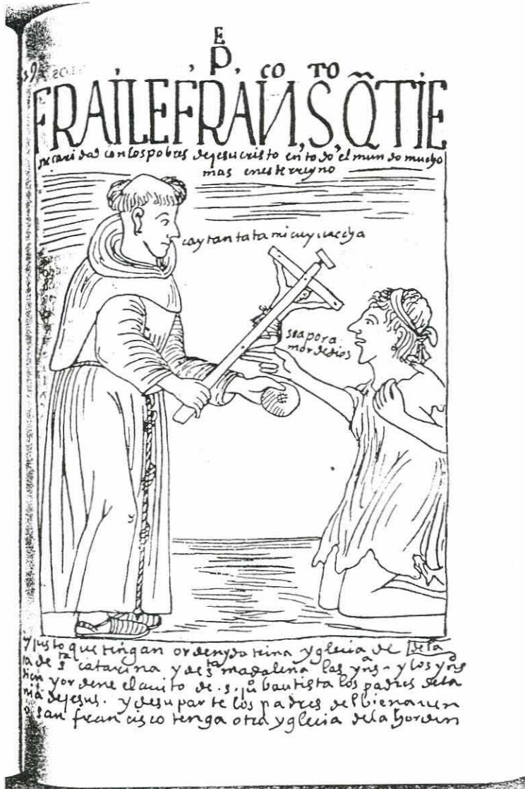
Franciscano según el cronista Huamán Poma.