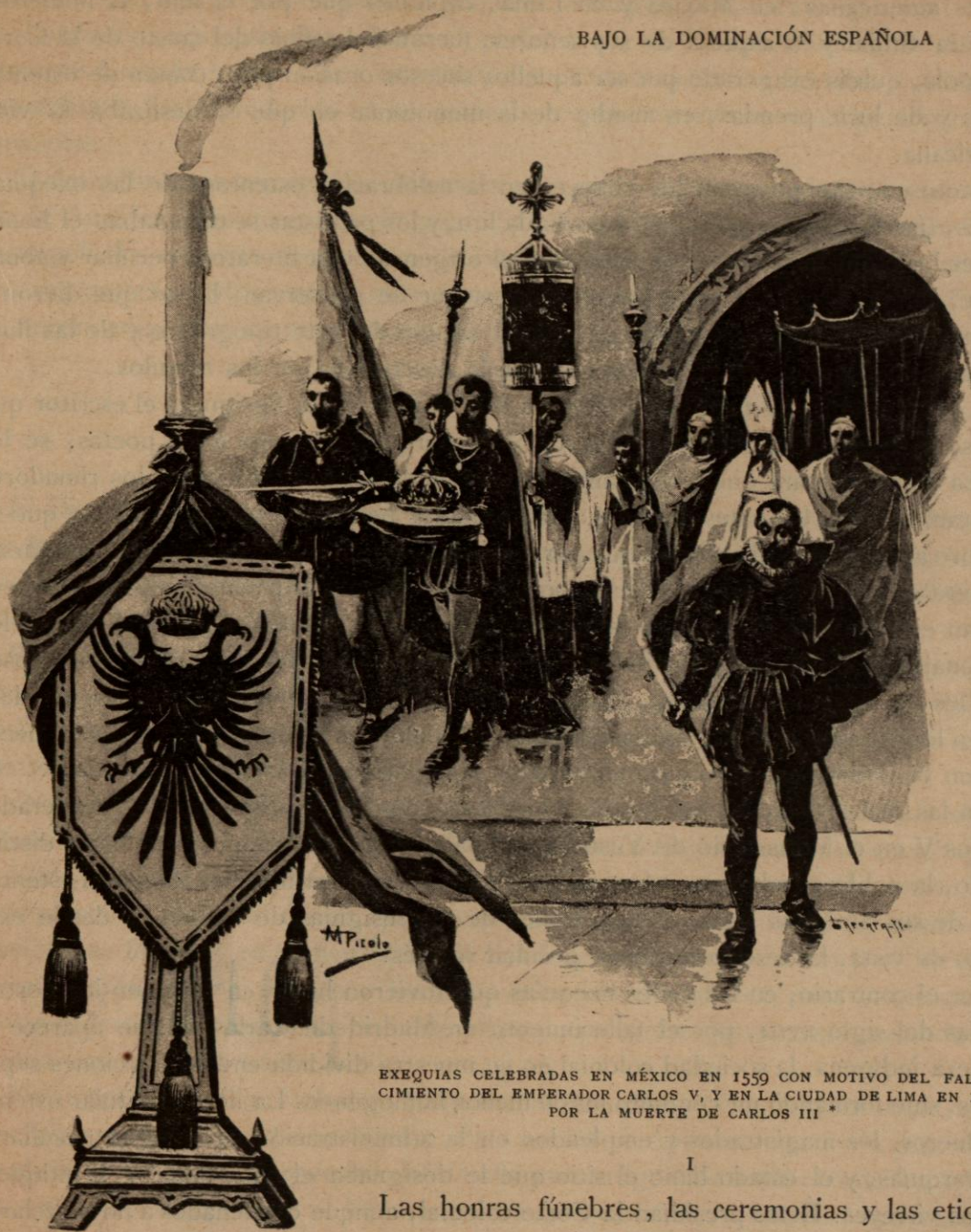
EXEQUIAS CELEBRADAS EN MÉXICO EN 1559 CON MOTIVO DEL FALLECIMIENTO DEL EMPERADOR CARLOS V, Y EN LA CIUDAD DE LIMA EN 1788 POR LA MUERTE DE CARLOS III *