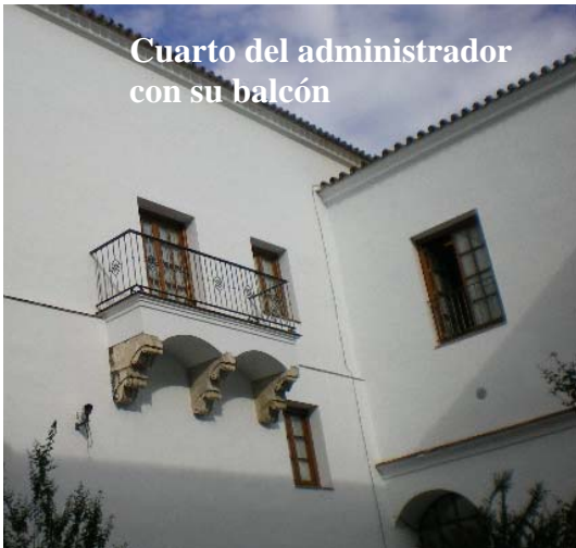
Cuarto del administrador con su balcón

Bajaban y se dirigían a la iglesia acompañados con el repique de todas las campanas. Ante la puerta de la iglesia del hospital el patrono presidente tomaba el hisopo con el que asperjaba el agua bendita a las personas presentes. Lo primero que se hacía era entrar en la iglesia del hospital y llegando a las gradas del presbiterio del altar mayor (adornadas con alfombras y almohadas de terciopelo carmesí) junto a los otros dos patronos, todos juntos, hincados de rodillas, realizaban la oración al Santísimo Sacramento. Subían al presbiterio donde hacían la genuflexión ante el Altar Mayor,