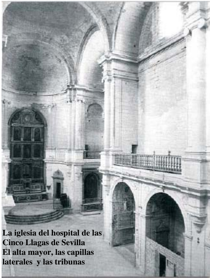
La iglesia del hospital de las Cinco Llagas de Sevilla El alta mayor, las capillas laterales y las tribunas