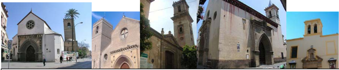
Parroquias de Santa Catalina, Santa Marina, San Bartolomé, San Esteban, San Nicolás