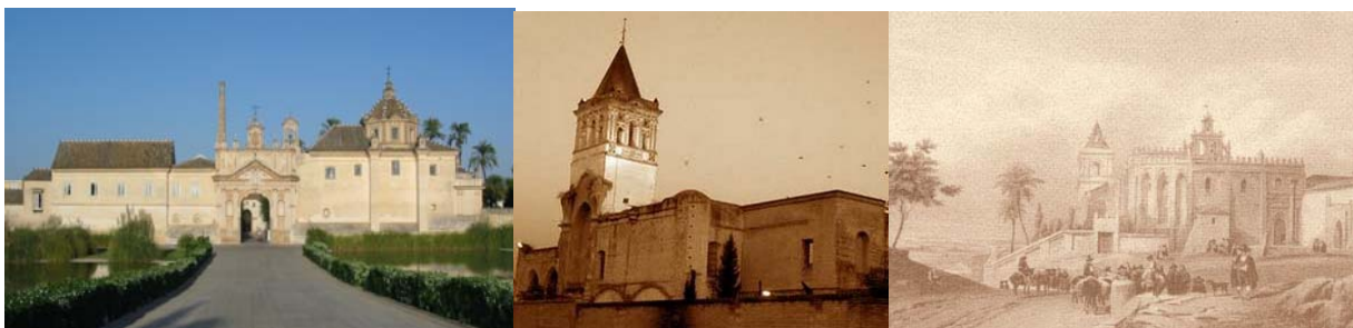
Los conventos de Santa María de las Cuevas, Jerónimo de Buena Vista y San Isidoro del Campo