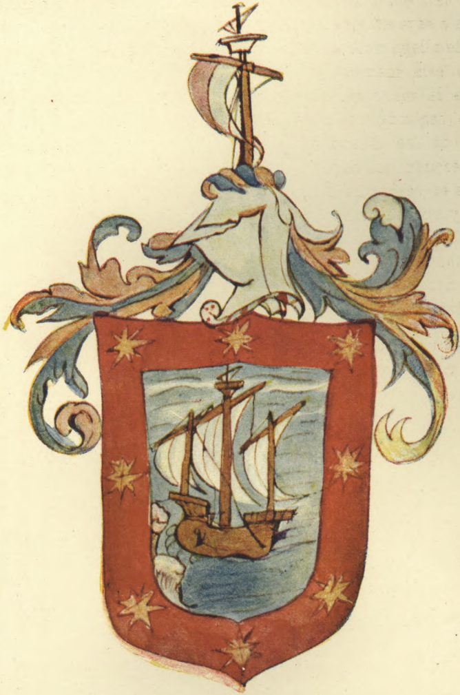
ESCUDO DE ARMAS DE CRISTÓBAL DE BURGOS