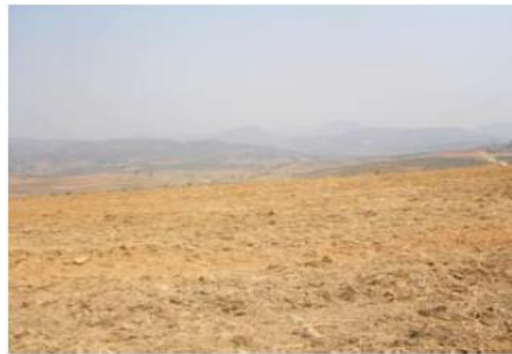
Fotografía 2. Paisaje típico del área de estudio