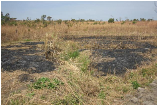
Fotografía 1. Quemada de residuos de cosechas