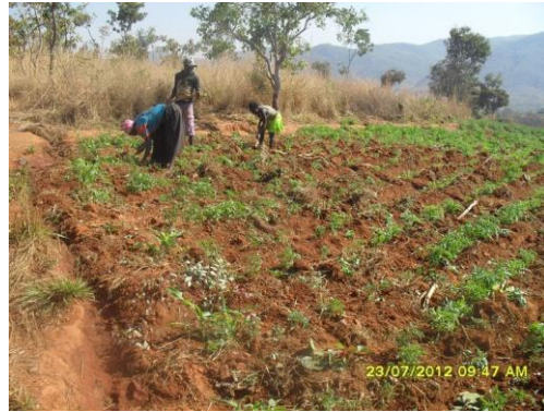
Fotografía 8. Pérdida de floresta por causa del avance de la agricultura.