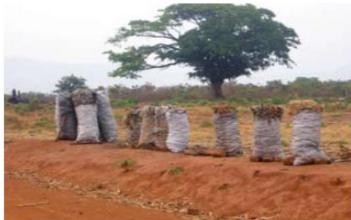
Fotografía 10. Carbón preparado para la venta del pequeño agricultor.