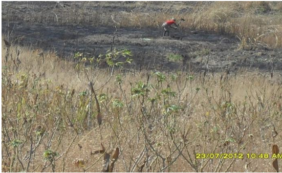
Fotografía 9. Práctica de agricultura itinerante Agricultura itinerante en medio de la floresta