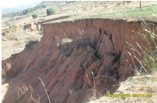
Fotografía 6. Presencia de Cárcavas en la región de estudio.