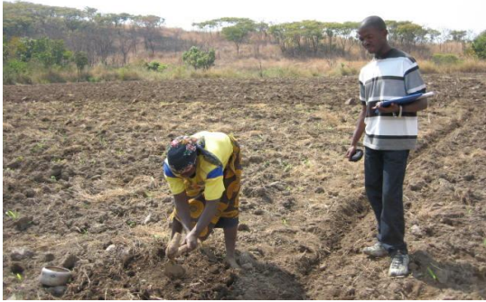
Fotografía 7. Entrevista a los agricultores