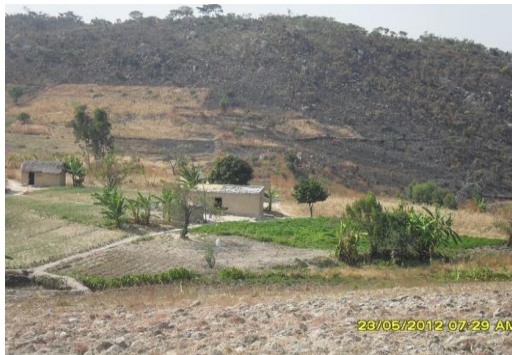
Fotografía 4. Incendios cercanos a asentamiento poblacionales