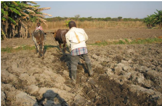
Fotografía 3. Uso de tracción animal en la preparación de suelo.