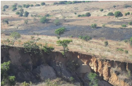
Fotografía 5. Incendios cercanos asentamiento poblacionales y degradación de suelos provocados por la acción del hombre