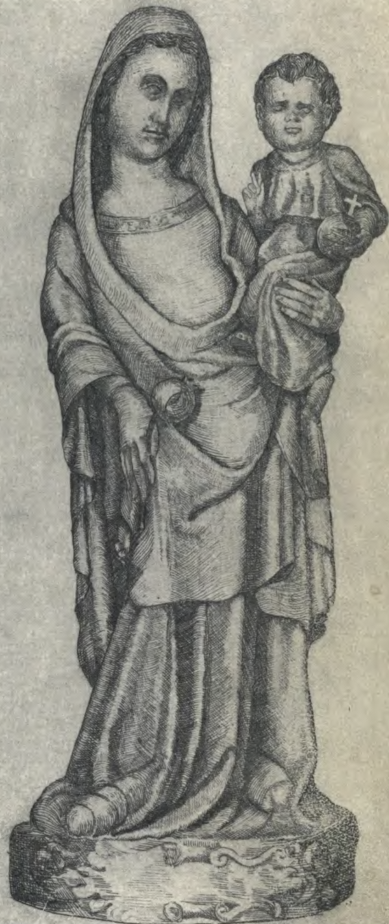
SANTA MARIA DE LA RABIDA