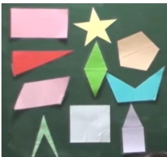
Imagen 1. Figuras poligonales

Además, parece que Ernesto, puede que implícitamente, asocia clasificar y definir en geometría; pues propone primero clasificar las figuras y después construir una definición para las figuras que pertenecen a un grupo (los polígonos), de modo que las que no pertenecen al grupo queden excluidas. Esta idea de qué es definir en matemáticas muestra su conocimiento de la práctica matemática ( KPM ). A continuación, se muestran los dos grupos (polígonos y no polígonos) formados por los alumnos (tal como Ernesto las dispone en la pizarra).