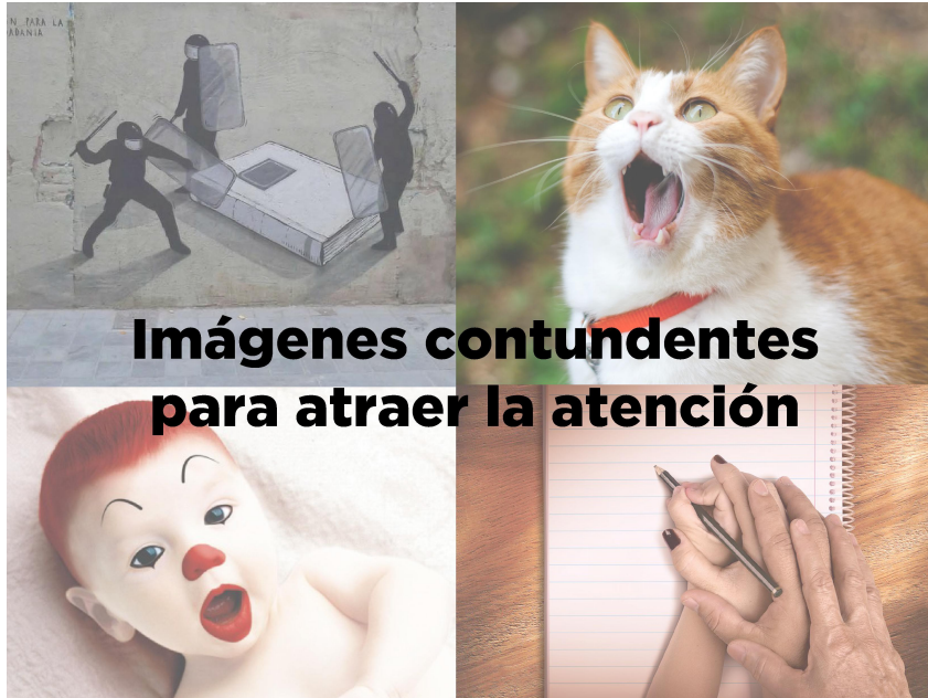
Imagen 5: Material propio