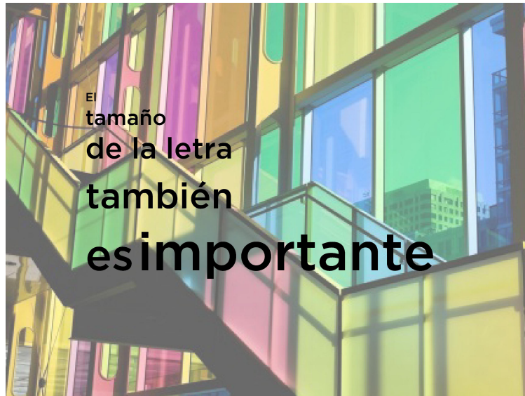
Imagen 3. Material propio.

adecuado para que se pueda ver desde cualquier punto del aula de forma nítida.