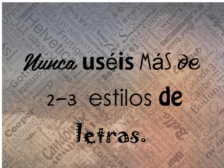
Imagen 2. Material propio.