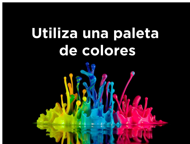
Imagen 4. Material propio