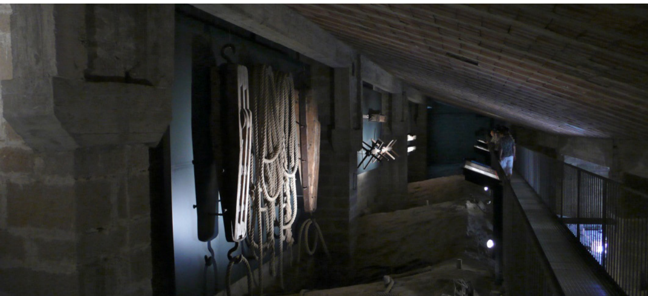
Imagen 8. El espacio bajo cubierta de la catedral de Pamplona, donde fueron abandonados los ingenios utilizados en la fábrica de la fachada neoclásica, se convirtió en el lugar ideal donde explicar el proceso y las vicisitudes que implicó su construcción.

Y en el caso de este museo la ausencia de perspectiva espacial se echa especialmente de menos, porque el museo se ubica en un edificio histórico que ya es por