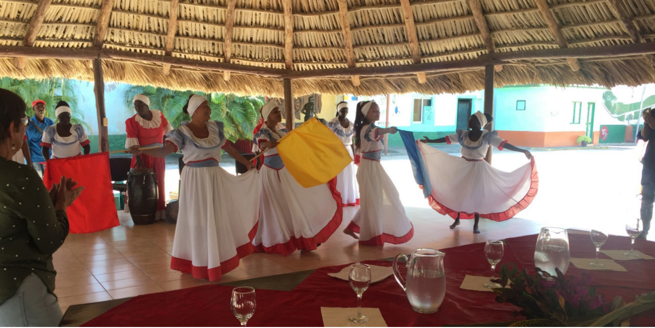
Imagen 10. La expresión artística utilizada como lenguaje museográfico en el Museo Central Patria o Muerte.

La música y el baile son los recursos que se usan para desgranar a partir de un relato poético los conflictos de culturas y de clases. Las sensaciones continúan con la degustación de la canchánchara, un combinado a base de ron, miel y cítricos y se culminan con un recorrido en un tren de vapor en el que se puede degustar la caña de azúcar.