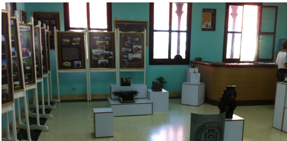
Imagen 9. La exposición del módulo de entrada del Museo Central Patria o Muerte contrasta con el concepto y el lenguaje museográfico principal del museo. Mientras este está orientado a proporcionar una experiencia sensorial, la exposición del módulo de entrada insiste en una estrategia poco eficaz, la de considerar la exposición como un libro de hojas gigantes.

En lugar de proponer un recorrido por las instalaciones industriales acompañado de una narración de corte científico técnico sobre locomotoras, toneladas producidas o variedades de cañas, los responsables del museo apostaron deliberadamente por centrar el discurso del museo en el factor humano, usando como hilo conductor la manifestación cultural que se produjo en el contexto de las plantaciones y los ingenios a partir del sincretismo entre la cultura hispanocubana y la cultura francohaitiana de raíces africanas.