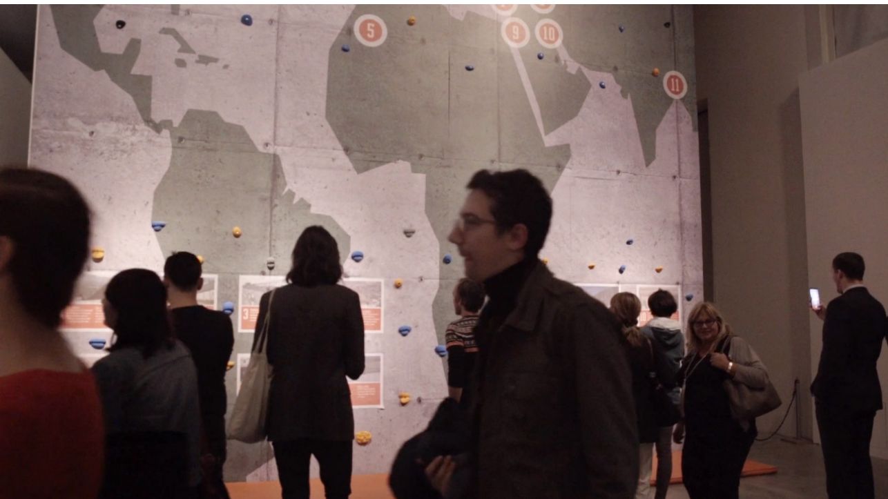
Imagen 2. El mapamundi rocódromo.

El espacio expositivo de «Welcome to hard times», recuerda el ambiente impersonal y frenético del gimnasio porque las instalaciones son interactivas y el espacio expositivo está lleno de gente haciendo actividades. El discurso es claro y diáfano, una instalación con un «mapamundi rocódromo» ofrece a los visitantes la experiencia de trepar para escapar del sur deprimido y alcanzar el norte deseado, como sucede en el mundo real.