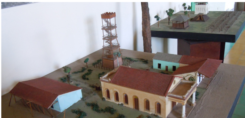
Imagen 5. Detalle de las maquetas de La Trocha que se exponen en el Museo Provincial.

El museo fue inaugurado el 13 de marzo de 1983 y se encuentra ubicado desde el año 2006 en el edificio que fue la Comandancia Militar de la Trocha de Júcaro a Morón, construido en 1874. Conserva diferentes colecciones relacionadas con la historia de la provincia, entre las que destacan la colección arqueológica procedente del yacimiento neolítico lacustre de Los Buchillones, objetos relacionados con las guerras por la independencia, especialmente la «Guerra de los Diez Años», la colección relacionada con el movimiento revolucionario de estudiantes y obre-