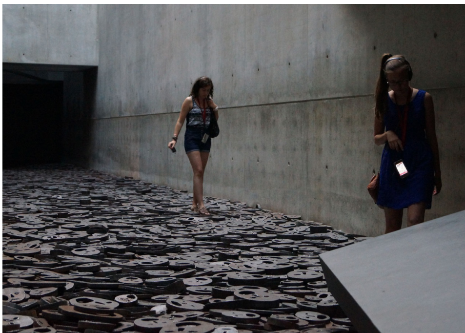
Imagen 14. «El Vacío de la Memoria» alberga la instalación «Shalecht» del artista Menashe Kadishman en el Museo Judío de Berlín.