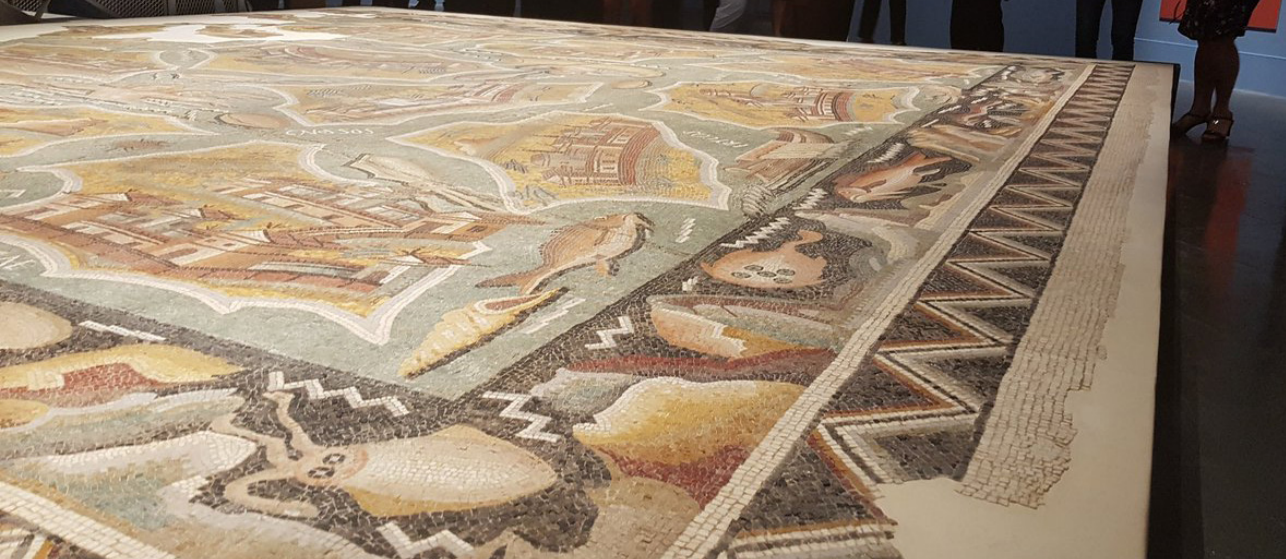
Imagen 13. Uno de los mosaicos que se presentan en la exposición permanente del Museo del Arles Antiguo.