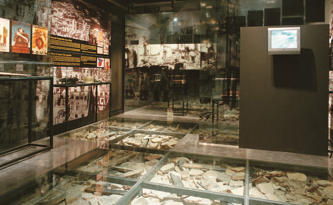
Imagen 16. Este ámbito de la exposición permanente del Museo de la Paz de Gernika está dedicado a mostrar la ciudad devastada por la guerra. El espacio museográfico caracterizado por este suelo lleno de escombros introduce el tema sin necesidad de mediar una palabra.

fías que son la base del relato y que permiten de manera eficaz caracterizar el tema que trata el espacio al primer golpe de vista. En contraposición a la museografía de estructuras, el Museo de la Paz ofrece un planteamiento de espacio museográfico pensado no como un mero contenedor de muebles sino como parte esencial del discurso de la exposición.