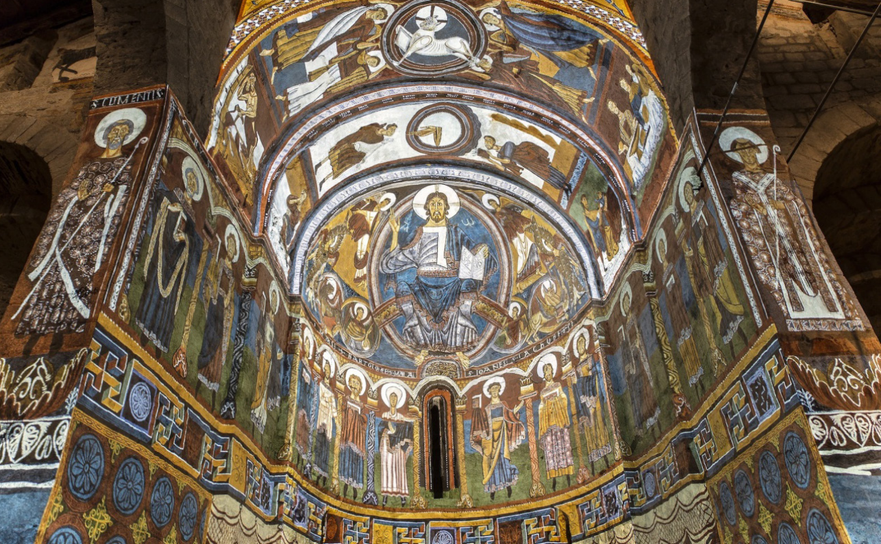
Imagen 15. Mapping «Taüll 1123».

mento tal y como ha llegado a nuestros días pero también se pueden sumergir en una experiencia que les lleva al lejano año de 1123 cuando fueron terminados los frescos que la decoraron durante casi ocho siglos.