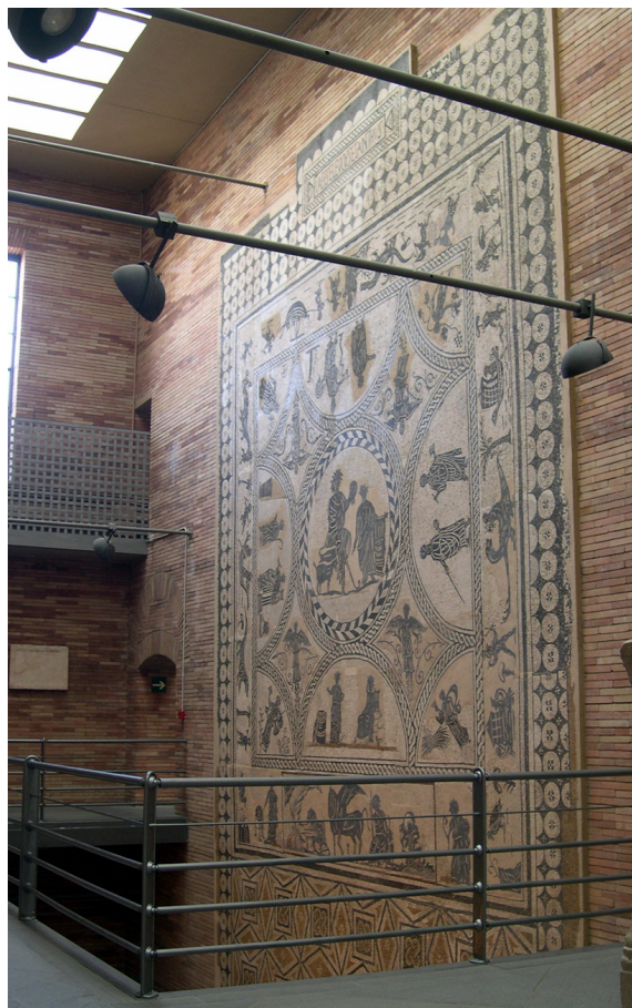
Imagen 12. Mosaico colgado en la pared en el Museo Nacional de Arte Romano de Mérida.

La arquitectura del Museo del Arlés Antiguo fue proyectada a partir de un proyecto museológico que definía el discurso y la personalidad del museo. El resultado fue que el espacio arquitectónico fue a la vez el espacio museográfico y un potente instrumento de comunicación. A menudo, la museografía didáctica peca de centrar su atención en los dispositivos expositivos y atender poco al espacio expositivo, como sucede en el caso del Museo Provincial Coronel Simón Reyes Hernández de Ciego de Ávila. Pero cuando un museo de corte didáctico usa el espacio expositivo con intencio-