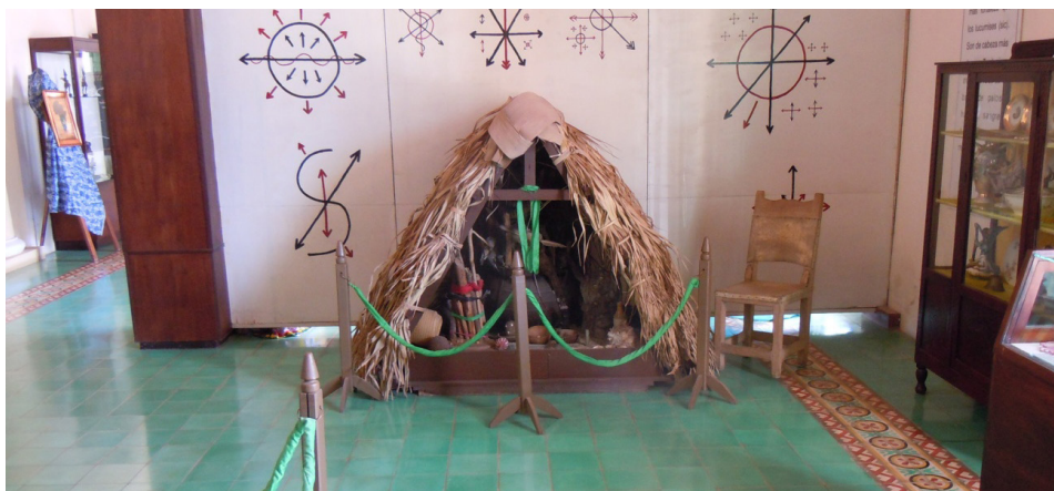
Imagen 7. Sala dedicada a la santería afrocubana.

El museo sigue un relato cronológico y su vocación didáctica se manifiesta en el uso de numerosas maquetas, muy útiles para entender la arqueología de la Cultura Taína, el desarrollo urbanístico de la ciudad de Ciego de Ávila y el sistema defensivo militar habilitado por el ejército español durante las guerras de independencia, que recibió el nombre de «La Trocha».