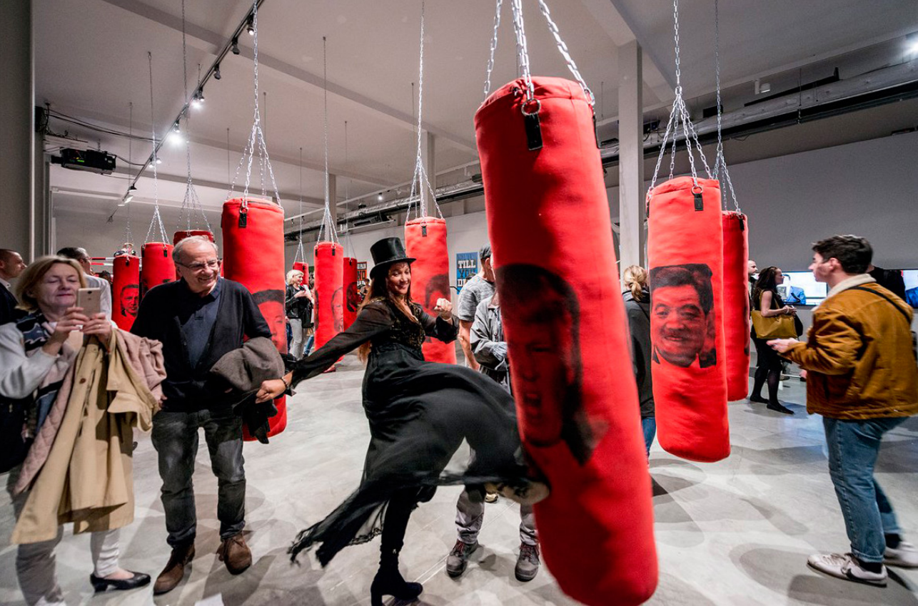
Imagen 3. Visitantes de la exposición interactuando con los sacos de golpes y descargando su ira.

como metáfora de nuestra alienación y al mismo tiempo alberga una serie de instalaciones que le dan sentido al espacio y lo llenan de contenido que debe consumirse de manera activa. No hay descanso en «Welcome to hard times» como no hay descanso en el mundo actual ni en el gimnasio, y el consumo frenético de la exposición es el reflejo del consumo frenético de nuestro mundo. No hacen falta instrucciones para disfrutar esta exposición y entenderla, es cultura popular, una cultura crítica.