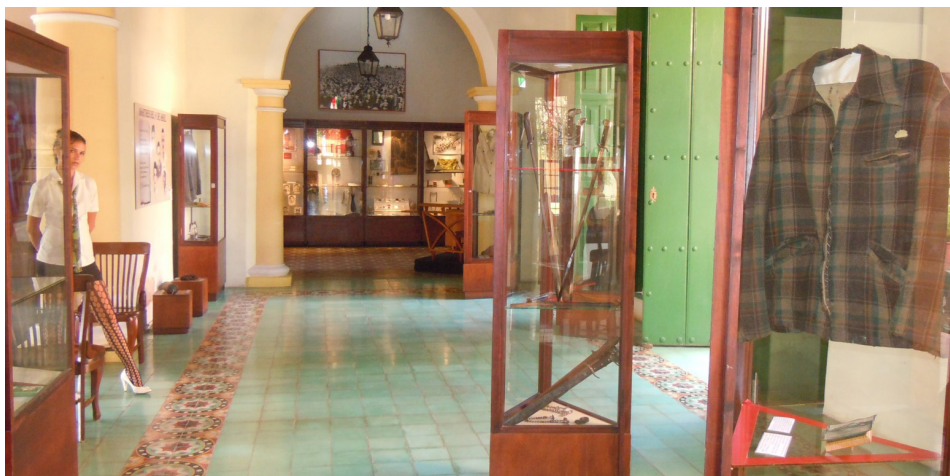
Imagen 6. Sala dedicada a la lucha por la independencia.