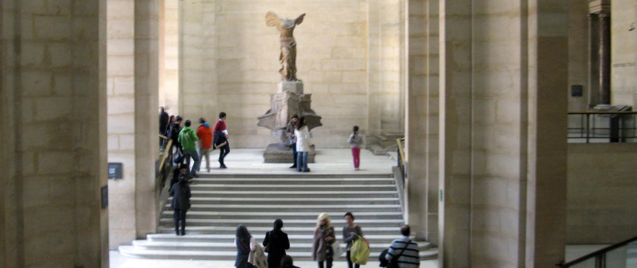
Imagen 11. Presentación de la Victoria de Samotracia en el Museo del Louvre.

como veremos a continuación, el tratamiento del espacio museográfico guarda una relación estrecha con el lenguaje museográfico utilizado.