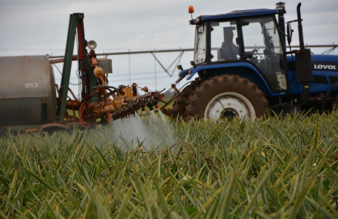
Imagen 8. Labores de cultivo en los campos de piña.

poseen una doble dirección: de abajo arriba, cuando el agente patrimonializador es la base social (Obbelaar y Pedroli, 2011); y de arriba abajo, cuando el agente es el conjunto de instituciones académicas, legales y administrativas (Arnese, 2011).