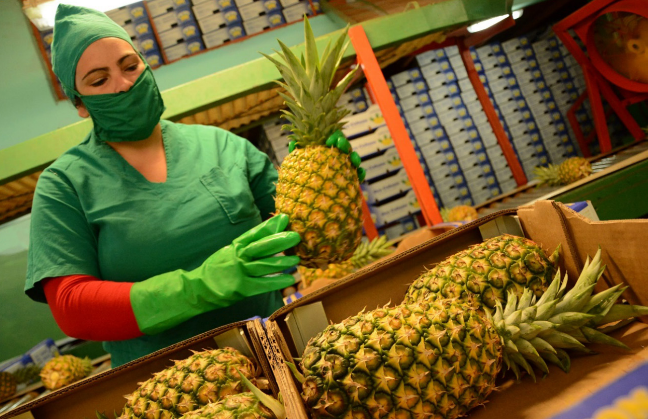
Imagen 4 Presencia de la mujer en los procesos industriales. Fotografía Gutierrez, 2018.

de entrevistas a las unidades productivas valoradas, donde la mujer es el principal recurso laboral de la provincia de Ciego de Ávila, para alcanzar lo planificado en la estrategia de desarrollo económico y social hasta el 2030.