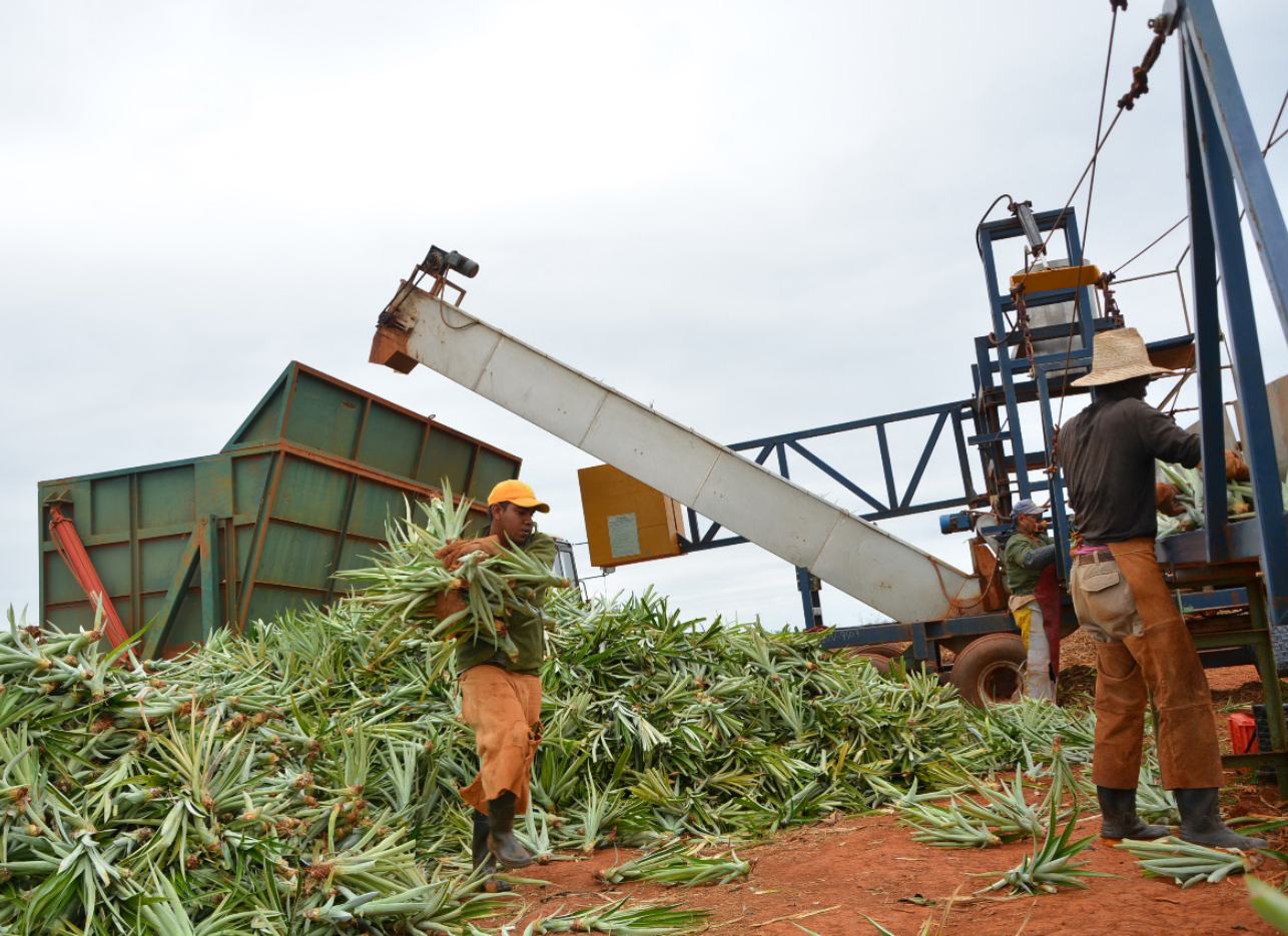
Imagen 1. Labores de cultivo de la piña en la provincia de Ciego de Ávila.

agropecuarios para formular soluciones a las problemáticas que afectan incluso a aspectos como la soberanía alimentaria, el cambio climático, las sequías, la salinización de los suelos y el déficit de fuerza laboral de zonas altamente productivas.