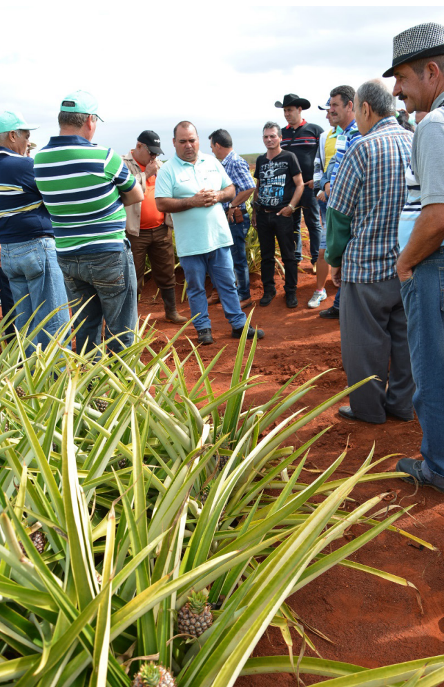
Imagen 2. Espacio de aprendizaje entre los actores locales que se relacionan con los cultivos de la piña. Fotografía Gutierrez, 2018.

Para la implementación del SIAL en los diferentes territorios fue necesaria la creación de modalidades de posgrados para la formación de sus facilitadores. Las lecciones aprendidas, como el ciclo de aprendizajes en un Diplomado que aborda como eje central el SIAL, facilitaron la creación de una ideología proactiva de académicos ante el desarrollo, que se traduce específicamente en partir de los requerimientos de la innovación social para la aportación, concreción e implementación de buenas prácticas que impacten en la segu-