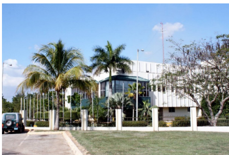
Imágenes 5 y 6. Universidad de Ciego de Ávila Máximo Gómez Báez y Centro de Bioplantas.