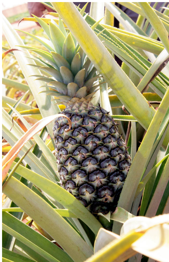
Imagen 10. La piña, uno de los símbolos del patrimonio agrario de la provincia de Ciego de Ávila.

Para una mayor aproximación a las valoraciones sobre Patrimonio, Territorio y Desarrollo en el diseño de buenas prácticas es importante que se evalúen los niveles de percepción respecto al tema de que se trata. Por eso es que se realizó una valoración sobre Necesidades, Oportunidades, Problemas y Soluciones (NOPS) sobre la dignificación de la piña como patrimonio agrario a un grupo de actores locales (académicos, productores, científicos y empresarios).