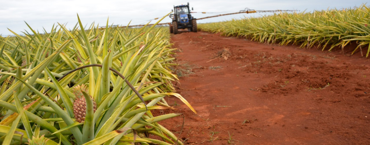
Imagen 7. Campos de sembrados de piña.

extendida en Cuba). Según Leandro (2017) la exportación hasta el cierre de junio del 2017 era de 823 toneladas de piña de Ciego de Ávila a naciones europeas, especialmente para Francia, Italia y España a través de la entidad «Cítricos Caribe» del Ministerio de la Agricultura, lo que significa un notable ingreso de divisas al país. Para el año 2018 la proyección era de 1200 toneladas.