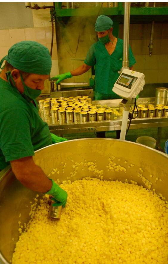
Imagen 9 Mini-industria «Ernesto Che Guevara».

la piña implica que surjan espacios de concertación entre diferentes agencias de desarrollo que reconozcan todas las potencialidades de uso de un determinado agro-ecosistema, como también un conocimiento de sus capacidades (Constabel, S/A: 35).