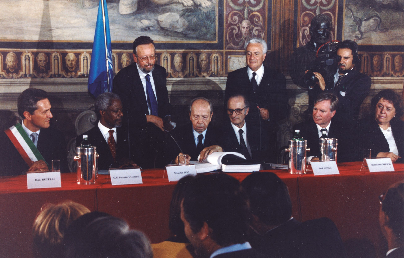
Firma del Estatuto de Roma.

de los Estados Parte (AEP), la cual se reunió por última vez en diciembre de 2019.