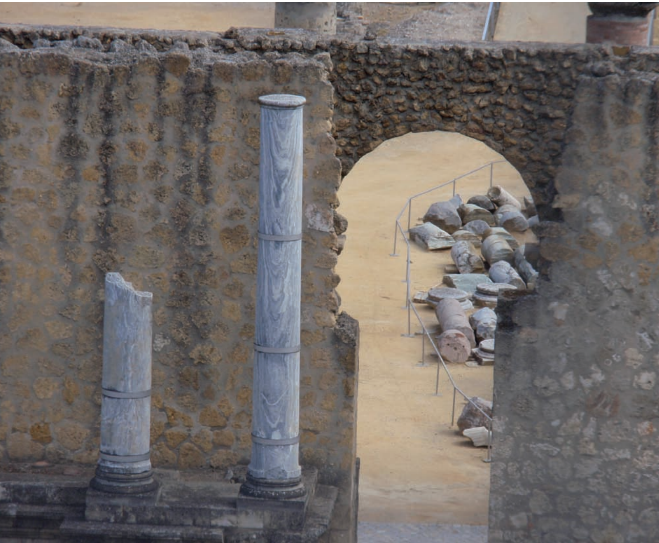
Teatro de Itálica.