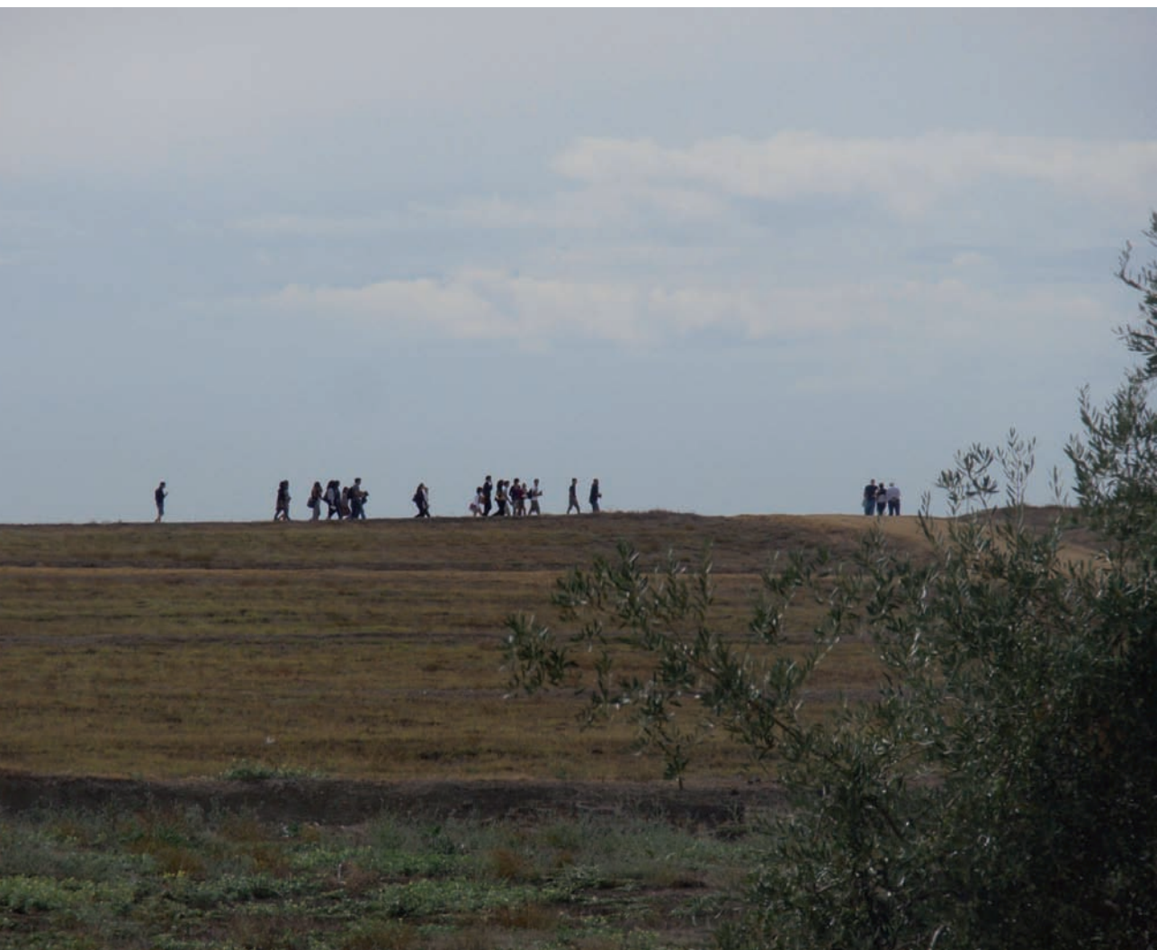
Visita al Conjunto Arqueológico de Itálica.