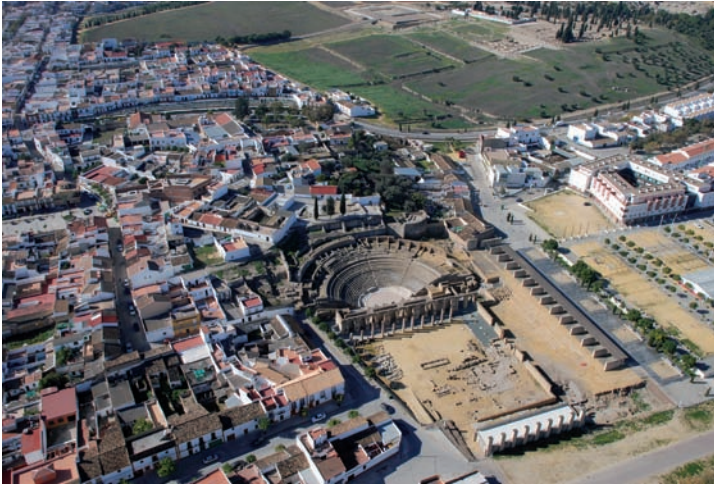
fig. 7. Vista de la relación entre el Teatro y la colina al fondo, con cipreses y el muro blanco del cementerio de Santiponce, hacia donde se establece el nuevo itinerario de acceso al Conjunto Arqueológico en el PDI a través de una de las calles excavadas que discurre entre la superficie baldía.

contenidos y recursos de que dispone el CAI. Aun cuando no analiza las características del paisaje interior, se incluye un documento de análisis paisajístico de los entornos del CAI por vez primera.