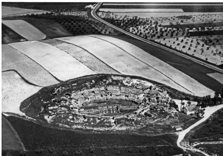
Fig. 2. Convivencia entre el escenario rural, con su estructura catastral y productiva, y las ruinas, salpicadas, sin continuidad física pero que ya ofrecen algunos cipreses como significantes específicos.

para la escenografía arqueológica que se incrementaba mediante la implantación de cipreses como elemento significativo en el paisaje para este tipo de elementos patrimoniales 5 . En Itálica se operaba desde esta visión cultural, mantenida desde inercias centenarias, apareciendo grupos de ruinas de mayor monumentalidad dispersas por el campo, inconexas entre si.