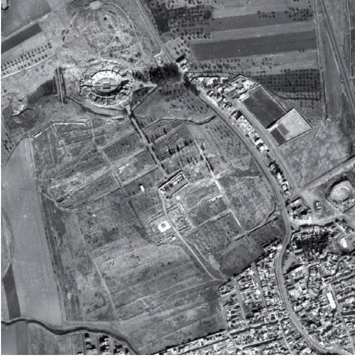
fig. 5. La imagen vertical de 1980 nos ofrece la estructura orgánica del parque de la colina del Anfiteatro, recién planteado y plantado, el muro de contención a la izquierda del Anfiteatro, aún sin el lago lleno y los restos de olivares tradicionales del interior de la ciudad, muy deteriorados. El flanco norte, aquel donde se conocen los límites de la ciudad, queda resuelto con estas intervenciones sobre suelo propio.

afectaban anualmente al Anfiteatro y se conformó un pequeño lago (fig. 6, nº 1 y 2).