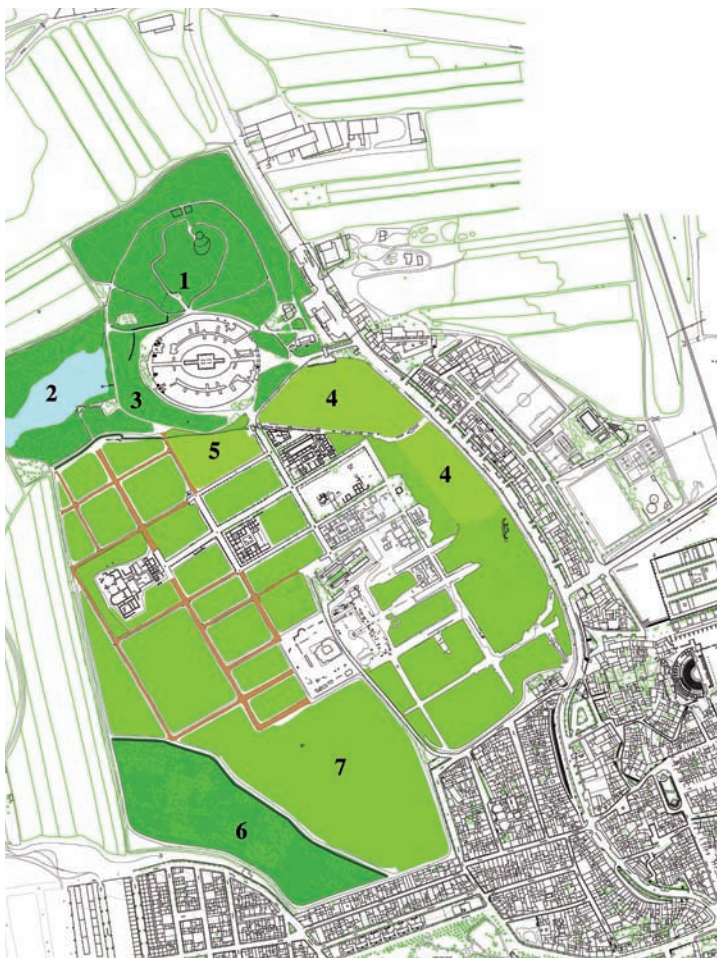
fig. 6. Plano del CAI con indicación cromática y numérica de los elementos de significación paisajística tratados.

desarrollado protocolos para la gestión y ordenación de estos espacios que se expresan en la redacción de ambiciosos Planes Directores derivados del art. 79 de la LPHA 15 . El Plan Director de Itálica (PDI) está ultimado y marca las directrices para el futuro del monumento, que describiremos más adelante. Hasta este momento, en los 12 años de la etapa que comentamos, las actuaciones en la vertiente paisajística que nos ocupa pueden sintetizarse del modo siguiente: