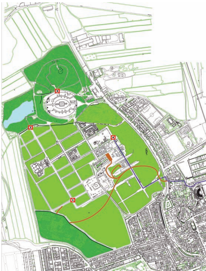
fig. 8. Plano del CAI con las propuestas del nuevo itinerario (azul) y los miradores según el PDI y nuestra propuesta de pasarela sinuosa. Superficies excavadas en blanco y espacios y superficies verdes coloreadas.

Los conjuntos de mosaicos no permiten por más tiempo resistir a las inclemencias meteorológicas (lluvia, heladas, luz) sin coberturas. La tradición de ofrecerlos au plein air , si hasta hora ha sido normal para muchos, a partir de hace tiempo se entiende como temeraria para muchos otros, por más que las inercias locales hayan hecho de ello un atavismo endémico, no protegible en este caso.