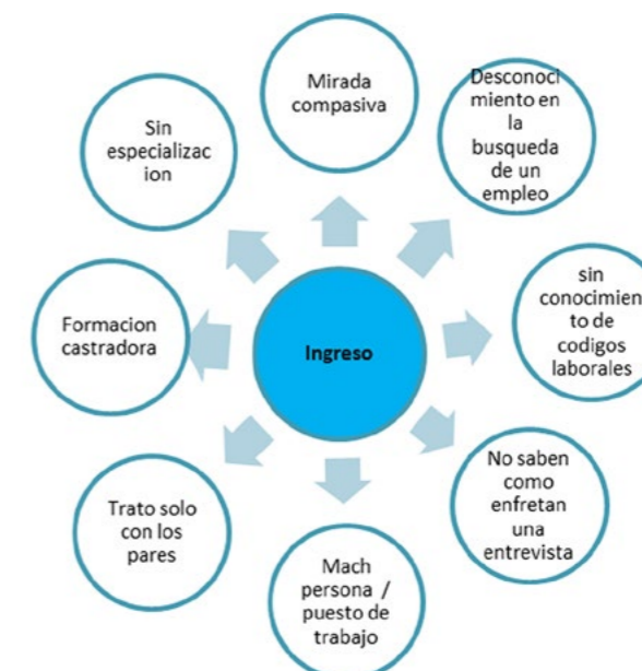
Figura 1. En torno al momento de búsqueda de empleo

El programa de inclusión que desarrolla la Fundación Arando Esperanza, es un modelo integral, donde se tiene que enfrentar y trabajar muchas variables, derribar muchos mitos y destruir muchos paradigmas en la etapa de ingreso, tal como se muestra en la figura 1: