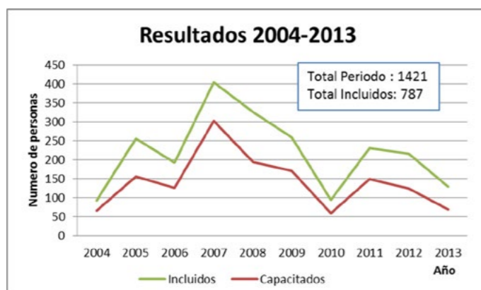
Figura 5 Resultados de aplicación del Modelo ARESPE.

El modelo busca la permanencia en los puestos de trabajo. Mediante esta metodología, las personas han logrado un 94% de permanencia, lo que les ha permitido avanzar hacia otras funciones y posiciones en las empresas.