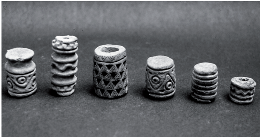
6. Husos o fusayolas para hilar el algodón. Cultura Araguaco.