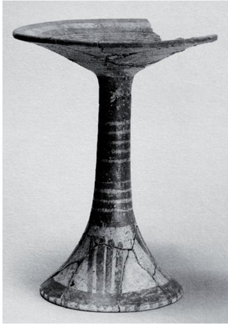
1. Copa de pedestal policromada. Cultura Araguaco, Llanos de Venezuela.

restos arqueológicos que por doquier surgen en diversos lugares de las islas que conforman el archipiélago antillano.