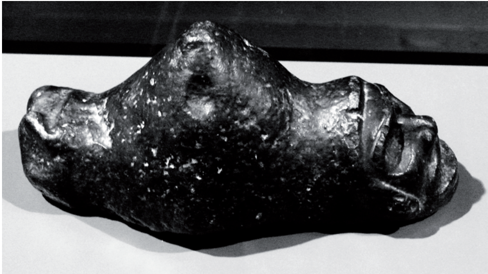
7. Trigonolito. Cultura Taina, Antillas Mayores.