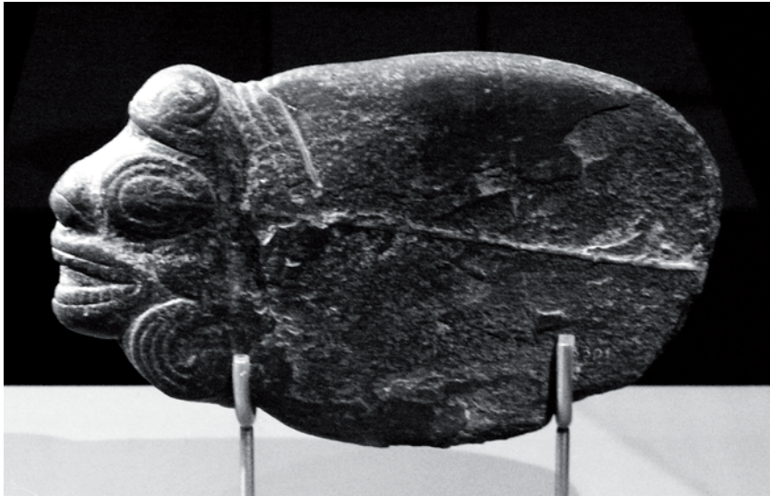
5. Hacha lítica. Cultura Taina, Cuba. Museo de América, Madrid.