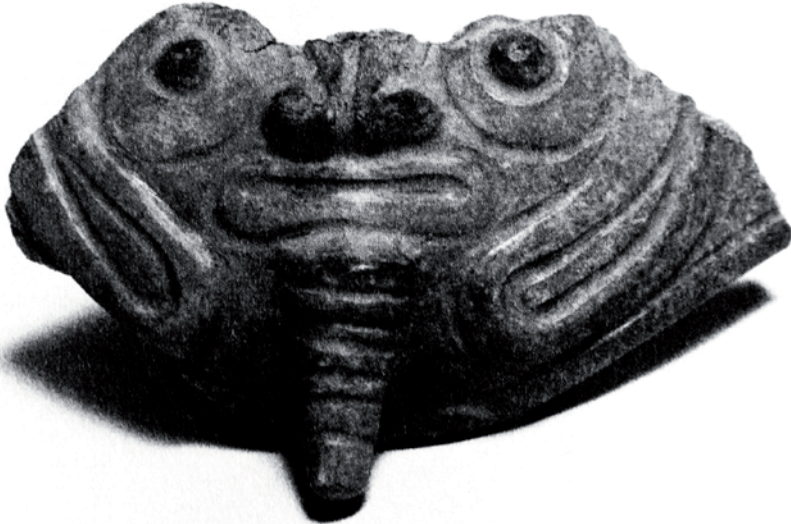
2. Curioso fragmento de figura humana. Cultura Araguaco,