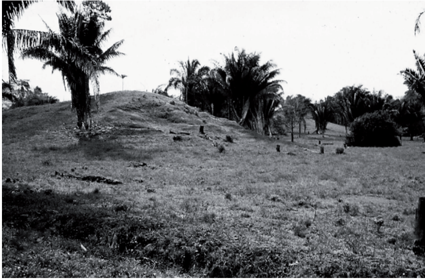
3. Gigantescos montículos de tierra de uso ceremonial.