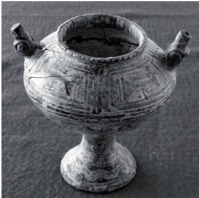
8. Vasija de doble vertedero. Cultura Araguaco, Llanos de Venezuela.