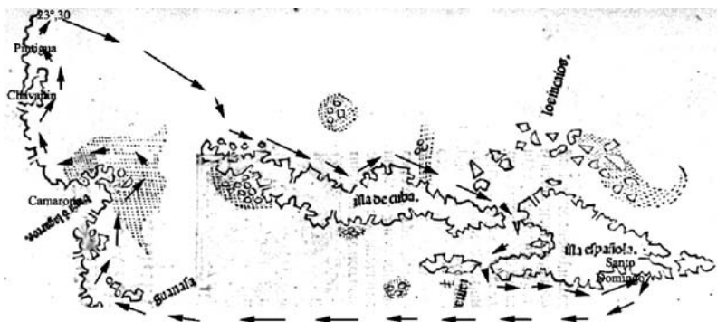
Recorrido de Solís-Pinzón en 1508 descubriendo la costa mexicana que Alaminos recorrerá en sus viajes con Francisco Hernández, Grijalva y Cortés

El resultado de la expedición fue considerado en la corte como negativo y se les abrirá a ambos capitulantes, Solís y Pinzón, un proceso para determinar si habían cumplido con la capitulación. Pero desde el punto de vista geográfico fue positivo aportando un nuevo trozo de costa más al continente descubiertos por los españoles.