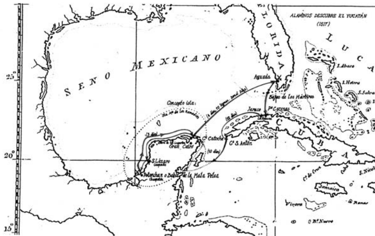
Recorrido del viaje de Alaminos con Francisco Hernández en 1517

después avistaron tierra. Estaban frente a la isla de Cozumel que rodean y, a través del estrecho se acercan a la costa de Yucatán, que confunden con una isla. Esta tierra nueva para ellos la bautizan como isla de Santa María de los Remedios, e incluso Alaminos llega a cartear en su mapa como tal isla. Error que se trasmite a la cartografía española y perdurará hasta 1529 y que podemos comprobar en cartas tan famosas como: La carta de Diego Ribeiro de 1525 o el planisferio de Castiglione.