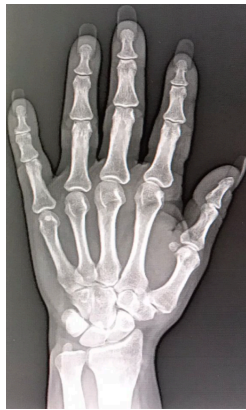
Figura 1 Estadio II OA TM de mano derecha.

et al. 3 en mano derecha, mano de dominancia según escritura, que se confirmó con un estudio radiográfico y con el exámen físico. El estudio radiográfico (Figura 1) mostró una disminución franca de la interlínea articular y la presencia de osteofitos marginales de menos de 2 mm de diámetro, pero sin signos de afectación de la articulación trapecioescafoidea.