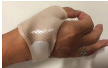
Figura 3 Ortesis corta de pulgar.

2.2A- Ortesis: Se confeccionó una ortesis corta para pulgar 19 20 que incluyó las articulaciones CMC y MCF y dejó libre la IF y la muñeca. El objetivo final de la ortesis es ayudar a aumentar la función y disminuir el dolor en reposo y durante las Actividades de la vida diaria (AVDs). La indicación de uso fue nocturno y diurno de 3 a 4 horas para las actividades diarias, durante los tres meses que duró el tratamiento.