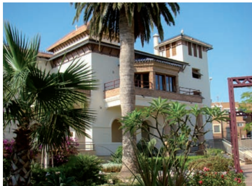
6. Almería, Casa del Cine.

Para finalizar estos itinerarios de cine por la ciudad, es obligada la visita a la “Casa del Cine de Almería”, inaugurada el 15 de enero del pasado año de 2011, como espacio donde recuperar la memoria cinematográfica de la ciudad. El lugar elegido es la Casa Balmas o finca Santa Isabel, una vivienda suburbana propiedad de una adinerada familia catalana que se instaló en Almería en 1866. La finca fue elegida como escenario cinematográfico pero también como alojamiento de actores y directores, como fue el caso de Peter O’Toole durante el rodaje de Lawrence de Arabia . Pero esta casa del cine de Almería rinde fundamentalmente homenaje a la figura de John Lennon, quien la alquiló en 1966 durante los meses que pasó en Almería rodando la ya mencionada película Cómo gane la guerra del director Richard Lester. Aquí, según contó el propio Lennon, escribió la célebre canción “Strawberry Fields Forever”. Por todo ello, las principales dependencias de la casa del cine exponen objetos personales de Lennon y del rodaje de su película.