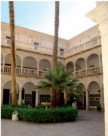
3. Almería. Escuela de Artes.

urbana de la capital, siendo desde su origen el lugar elegido por la burguesía almeriense para construir sus grandes casas, además de alojar los edificios de mayor entidad y trascendencia para la vida cotidiana y social de la ciudad. Como no, esta vía principal también ha contado con su correspondiente protagonismo cinematográfico, esta vez como escenario de una persecución de coches para la película El Reportero , dirigida por Michelangelo Antonioni en 1975, y protagonizada por los conocidos actores Jack Nicholson y María Schneider. Jalonando el paseo, otros inmuebles como el Antiguo Casino Cultural y el Mercado, han servido de escenario para secuencias de ésta y otras películas.