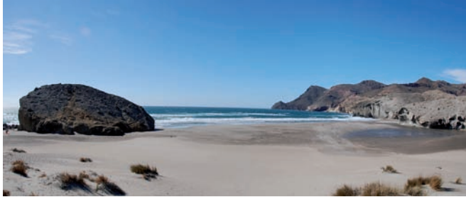
9. Parque Natural Cabo de Gata-Níjar. Playa de Mónsul.

El recorrido por el litoral nos lleva a parajes de gran belleza, como el Arrecife de las Sirenas o la playa y dunas de Mónsul, escenarios de un gran número de las películas rodadas en Almería, y protagonistas continuados de videoclips y anuncios publicitarios. Aquí, por supuesto, David Lean para su Lawrence de Arabia situó una batalla e hizo volar un tren compuesto por once vagones. La playa de Mónsul, con sus características lenguas de lava, es mundialmente conocida por el famoso vuelo de gaviotas que provoca el doctor Jones padre con su paraguas en la película Indiana Jones y la última cruzada .