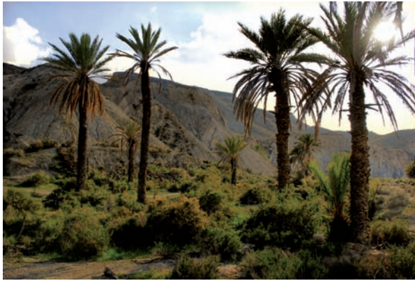
7. Tabernas, Rambla Viciana.

los films rodados en Almería como es el caso de La muerte tenía un precio e Indiana Jones y la última cruzada .