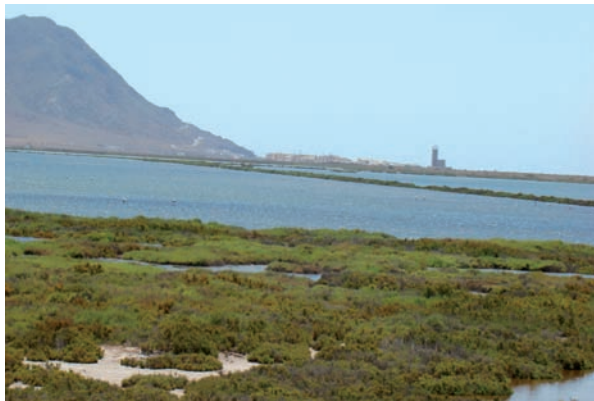
8. Parque Natural Cabo de Gata-Níjar. Salinas de Cabo de Gata.

El itinerario comienza en el propio pueblo de Cabo de Gata, donde junto a su extensa playa y su acantilado sobre el cual se levanta el faro más importante de la zona, hay que destacar las salinas en cuyos humedales habita el flamenco rosado. Las salinas, conocidas y explotadas ya por fenicios, romanos y cartagineses, fueron adquiridas a finales del siglo XIX por la familia almeriense Acosta, que fundó la empresa “Salinas de Almería”, y financió la construcción de un barrio y una iglesia para sus trabajadores. La iglesia es un pequeño edificio, de planta rectangular y de carácter ecléctico, que fue inaugurado el año de 1907. La última misa aquí oficiada fue en el año 2004, sufriendo el inmueble desde entonces el abandono y la ruina. En la actualidad, y tras reiteradas denuncias de los vecinos, el obispado junto con el ayuntamiento de la capital, han afrontado su rehabilitación, rescatando para el imaginario colectivo del cine, la silueta de un edificio que ha protagonizado secuencias para numerosas películas, entre ellas Pattón .