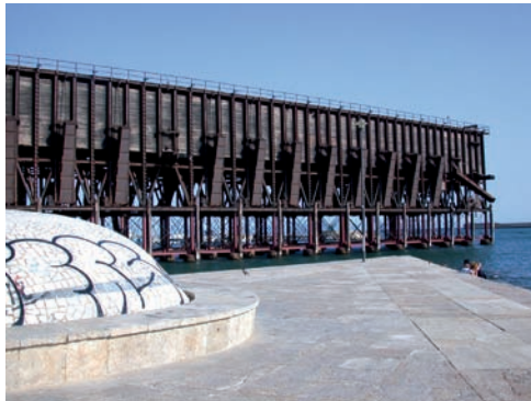
5. Almería, Cargadero de Mineral.

El Puerto, con sus dársenas comercial y pesquera, ha sido protagonista de gran número de películas, como la Llamada de África y El Boulevard del Ron . De interés son dos edificios que estuvieron vinculados a la actividad portuaria, el cargadero de mineral y la estación de ferrocarril, ambos realizados para el traslado y embarque de mineral de hierro, que la compañía británica The Alquife Mines and Railway Company Limited explotaba en el yacimiento de la localidad granadina de Alquife. El cargadero o “Cable Inglés” como se le conoce popularmente, es un magnífico ejemplo de arquitectura industrial, cuyo proyecto se debe al ingeniero británico Jonh Ernst Harrison quien lo diseñó entre 1902 y 1904. En cuanto a la estación de ferrocarril se terminó el año de 1893, siendo diseñada por el ingeniero francés L. Farge miembro de la compañía Fives-Lille 12 .