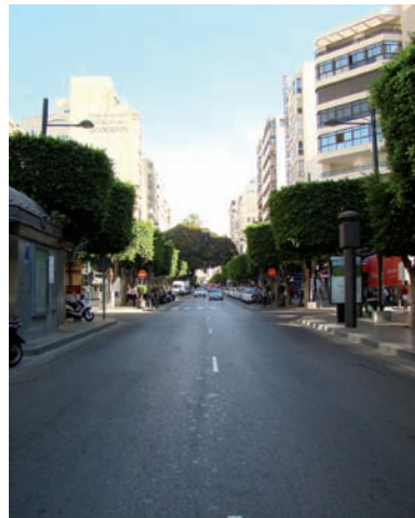
4. Almería, Paseo.

El Paseo de Almería desemboca en la calle Federico García Lorca, conocida como Rambla de Almería, y en la zona del puerto, ubicándose en sus inmediaciones varios inmuebles y espacios urbanos de interés para nuestro itinerario. El primero a destacar es el Gran Hotel Almería, edificio construido en 1968 para proporcionar plazas hoteleras a los cineastas que venían de todo el mundo ante la carencia que de ellas había en la ciudad, pues en estos momentos solo existían disponibles unas cuantas habitaciones en modestas pensiones. En este mismo año también se construyó el Aeropuerto con el fin de propiciar la llegada de los cineastas a la provincia, paliando de alguna forma los graves problemas de comunicación que tenía la comarca no solo a nivel internacional, sino con las propias provincias limítrofes, y que hacía del viaje a Almería una