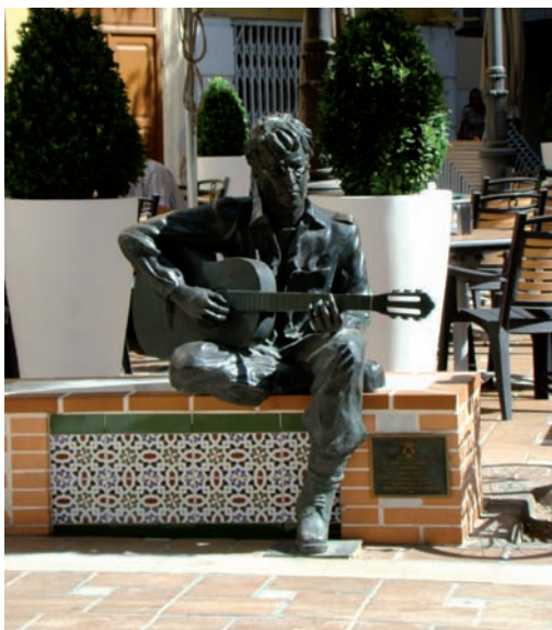
2. Almería. Escultura de John Lennon en la Plaza de las Flores.

perdido 9 , es de forma irregular, y está conformada por varios edificios historicistas realizados a principios del siglo XX. Hoy día la plaza rinde homenaje a John Lennon, con una escultura que conmemora la estancia que tuvo el bettle en la ciudad para rodar, como mencionaremos más adelante, la película Como gané la guerra , una producción británica del año 1966. Como decíamos, cerrando la plaza se encuentra la iglesia de Santiago obra del arquitecto Juan de Orea, quien la finalizó el año de 1559, labrando entre otras cosas la portada Norte, la cual destaca por el programa escultórico dedicado al patrón del templo.