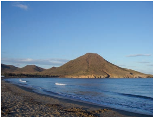
10. Parque Natural Cabo de Gata-Níjar. Playa de los Genoveses.

Junto a Mónsul se encuentra la espectacular Playa de los Genoveses, una bahía llamada así porque en ella desembarcó la flota genovesa que participó en el asalto cristiano de Almería en el año de 1147. Su fina arena fue el escenario de la película del director John Milius El viento y el león .