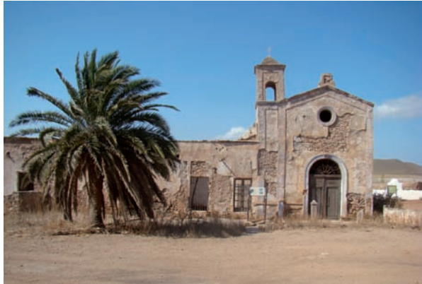
12. Parque Natural Cabo de Gata-Níjar. El Cortijo del Fraile.

El Cortijo del Fraile fue construido por los frailes dominicos de Almería en el siglo XVIII, como centro de una importante explotación agrícola, que contaba también con olivos y vides. Durante la Desamortización de Mendizábal en el año 1836, la finca se dividió y pasó a manos de varios propietarios que, finalmente, la vendieron a la familia Acosta. Esta familia de la burguesía almeriense mando construir la ermita y la utilizó como panteón familiar hasta la pasada década de los años 80 del siglo XX. Hoy día, el cortijo se encuentra en un lamentable estado de ruina y abandono, a pesar de haber sido declarado BIC con la categoría de “Sitio Histórico” el mes de febrero del pasado año de 2011.