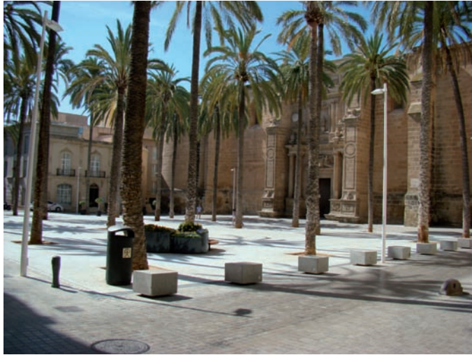
1. Almería, Plaza de la Catedral.

Esta catedral, es uno de los pocos ejemplos que se conserva en la península de Catedral-Fortaleza, pues en un principio se concibió como bastión defensivo de la ciudad, entonces un importante enclave de la frontera marítima del Reino de Granada. Las obras comenzaron el año de 1525, promovidas por el obispo fray Diego Fernández de Villalán, y se prolongaron durante gran parte del siglo XVI. En la catedral se observan dos conjuntos bien diferenciados, la fortaleza y el templo. La parte meridional la ocupa el recinto de la fortaleza, construida con sólidos muros de sillería, lisos y desornamentados como corresponde a una construcción militar, rematados en parapetos con troneras y aspilleras, torres octogonales y circulares. Por su parte, la iglesia se extiende a lo largo del costado Norte del claustro, exhibiendo un sólido volumen exterior perfectamente integrado en el carácter militar del conjunto, destacándose las portadas clasicistas obras del arquitecto y escultor Juan de Orea. El interior de la catedral responde al prototipo de iglesia de salón del gótico tardío, con todos sus espacios a la misma altura y con bóvedas de crucería estrellada. El claustro, última dependencia construida de la catedral pero que marca la separación entre el templo y la fortaleza, es una pieza