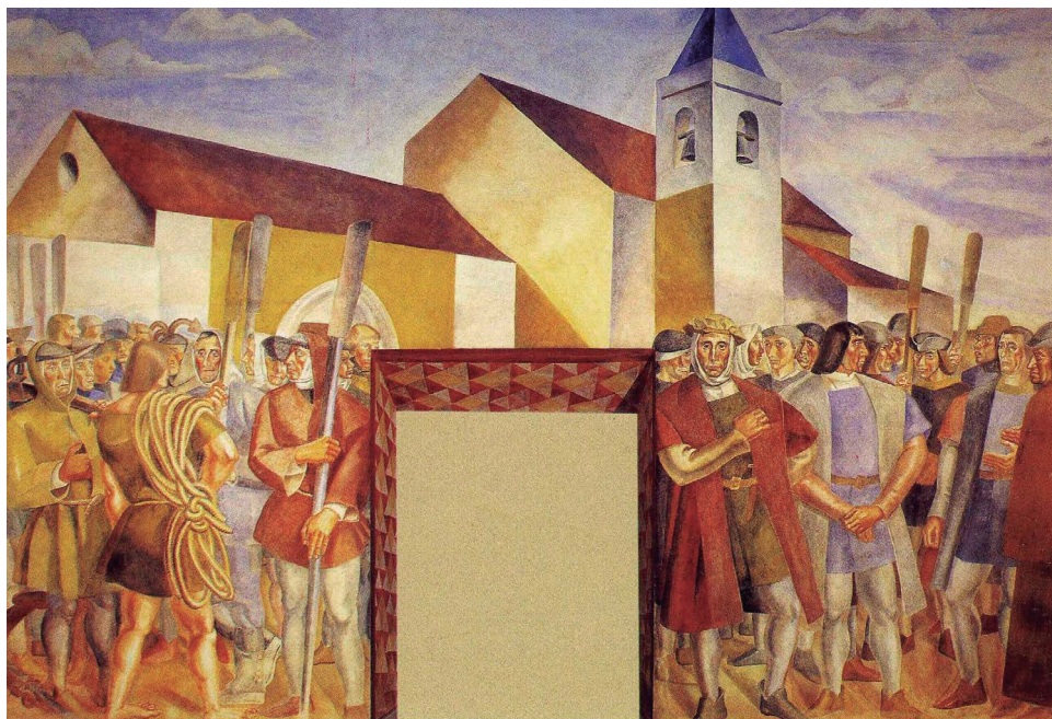
Los heroicos hijos de Palos y Moguer. Monasterio de La Rábida.

Dentro de los elogios recibidos, contaba Vázquez Díaz que el que más le había complacido era que el que le habían dedicado unos turistas del Monasterio al creerse frente a una obra antigua redescubierta: “Esa sensación de arte clásico que mi pintura les daba (mi pintura, que es precisamente criticada de demasiado revolu-