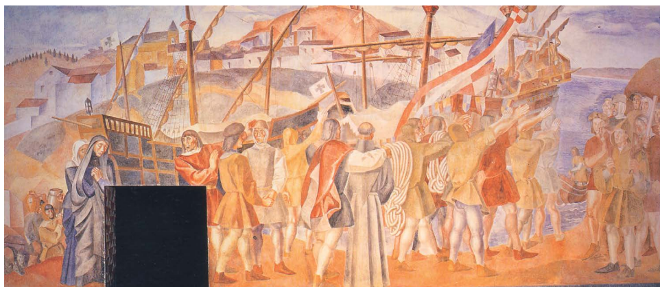
La partida de las naves, Monasterio de La Rábida.

Para otros, el lenguaje absolutamente moderno de los murales colombinos llegaba incluso a situarlos como emblema de la mejor pintura contemporánea