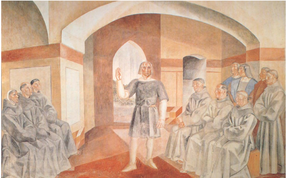
Las Conferencias, monasterio de La Rábida.

ron para los personajes. Las figuras aparecen amontonadas en un primer plano conversando entre ellas. El ritmo dinámico que aportan sus gestos y movimientos, contrasta con la quietud que respira la representación de la iglesia de San Jorge de Palos a sus espaldas. Si comparamos la representación del edificio con la interpretación que del mismo había realizado el pintor de la iglesia en un lienzo poco anterior (colección Rafael Botí) observaremos la simplificación total que se ha producido de la arquitectura, hasta reducirla a su expresión mínima y esencialidad en sus formas geométricas.